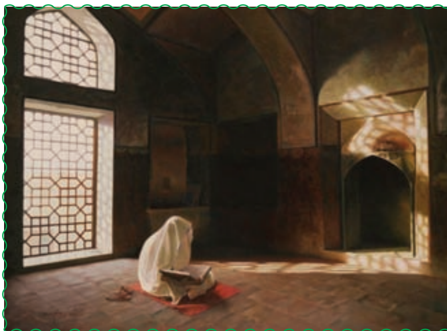
دانش آموزان خود را به خواندن روزانه قرآن کریم تشویق کنیم.

در پایان درس، دانش آموزان را تشویق کنید که همین امروز در خانه، کلمات و عبارات درس را برای اعضای خانواده‌ی خود با صدای بلند بخوانند.