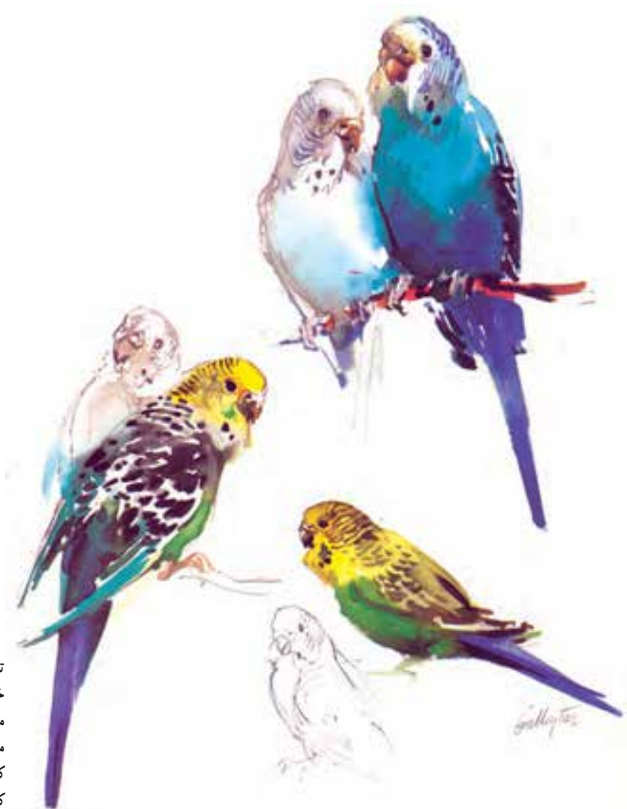
تصویر ۹- نمونه‌ای دیگر از نقاشی به شیوه خیس در خیس بر روی کاغذ خشک را نشان می‌دهد. مشخص بودن نقشه مسیر حرکت می‌تواند در جلوگیری از اشتباه و خطا در هنگام کار به شما کمک کند. در این اثر هنرمند شروع کار را از سر پرنده‌ها آغاز و به دُم آنها ختم کرده است، اثر وی چنس بالستار

با توجه به این که ترکیب رنگ بیشتر بر سطح کاغذ در این روش اتفاق می‌افتد با استفاده از نقشه مسیر حرکت می‌توانید تا حد بسیاری جلوی خطا و اشتباهات احتمالی را بگیرید. شما می‌توانید هنرجویان را در استفاده از ابزار، شیوه مناسب و چگونگی نقشه مسیر حرکت با توجه به موضوعی که برمی‌گزینید یاری کنید (تصویر ۹).