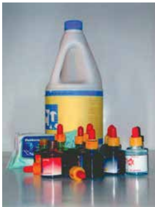
تصویر ۱- وسایل مورد نیاز شیوه آبرنگ مایع (جوهرهای رنگی) و پاک کننده (سفیدکننده) از قبیل مایع پاک کننده، دستمال کاغذی و آبرنگ مایع را نشان می دهد.