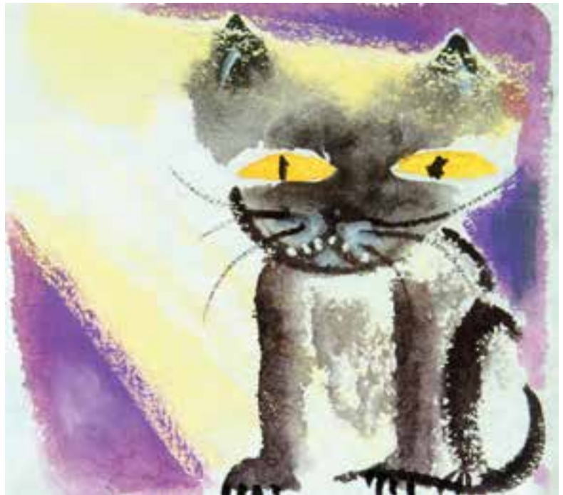
تصویر ۱۲- تصویرسازی به شیوه خیس درخیس بر روی کاغذ خشک، در تاریکی، اثر شون ویسایا