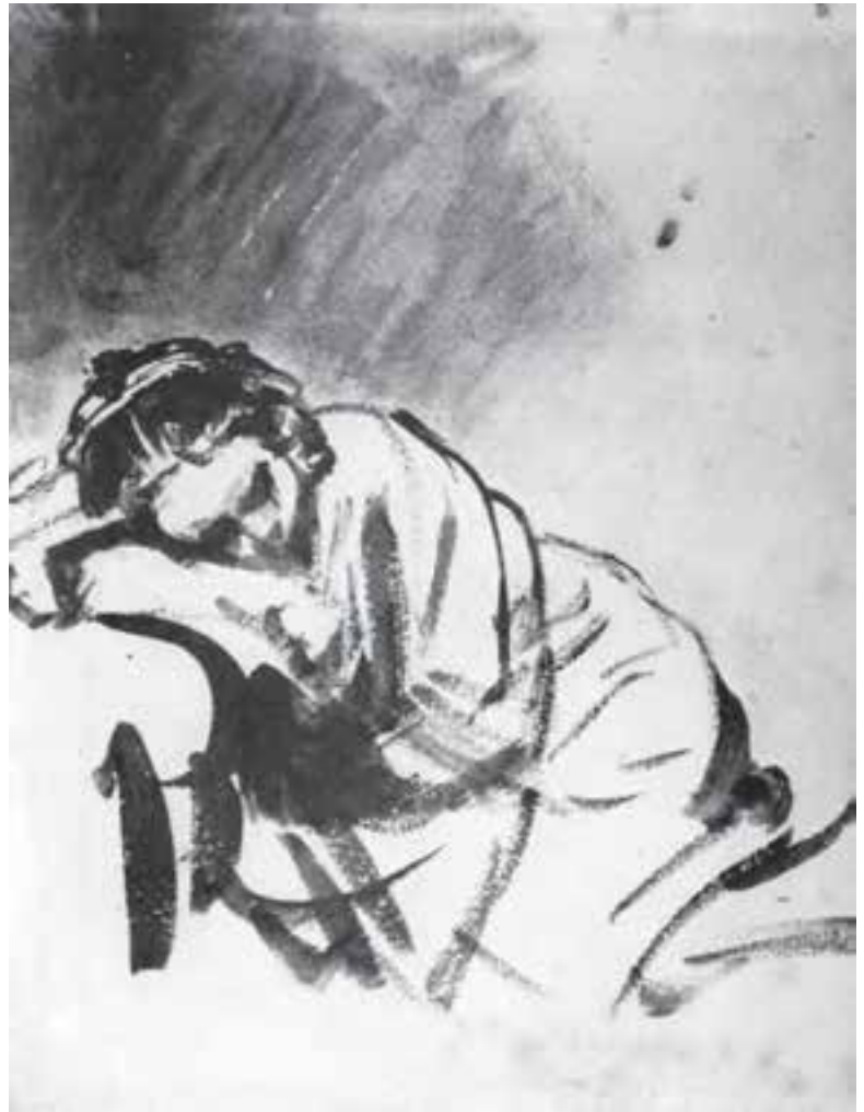
تصویر ۱۱- طراحی با آب‌مِ مرکب و قلم‌مو به شیوه خیس درخیس بر روی کاغذ خشک، دختر خفته، اثر رامبراند