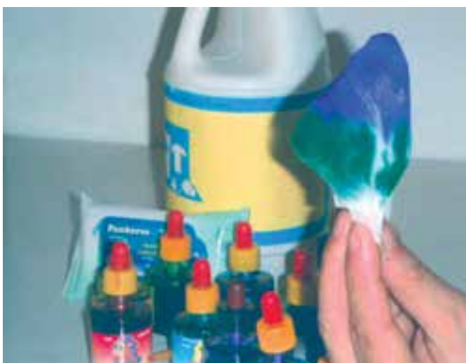
تصویر ۳- مرحله دوم رنگ آمیزی با آبرنگ مایع (جوهرهای رنگی) و پاک‌کننده را نشان می‌دهد.