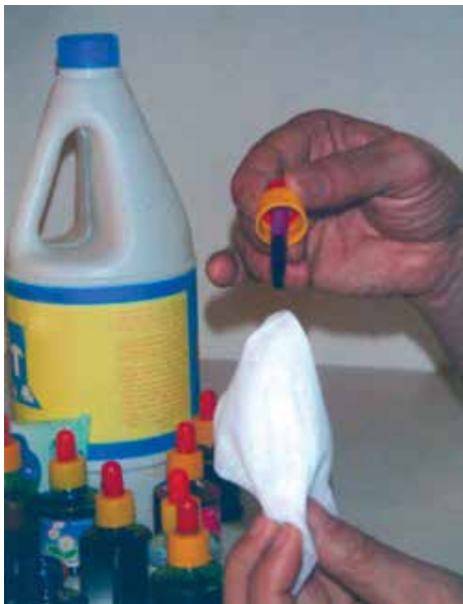
تصویر ۲- مرحله اول شیوه آبرنگ مایع (جوهرهای رنگی) و پاک‌کننده را، که با قطره‌چکان بر دستمال کاغذی مرطوب رنگ می‌چکانیم، نشان می‌دهد.

روش کار : در این شیوه، ابتدا دستمال کاغذی را با آب مرطوب می‌کنیم. سپس با استفاده از قطره چکان آبرنگ مایع، چند قطره از رنگ دلخواه و هماهنگ را، همان گونه که در تصویر مشاهده می‌کنید، بر روی دستمال کاغذی مرطوب که چند تا خورده است می‌چکانیم. با توجه به خیس بودن سطح دستمال، رنگ به راحتی و به صورت اتفاقی بر سطح دستمال پخش می‌شود. با همین شیوه رنگ‌های دیگر را به آن اضافه می‌کنیم. نتیجه حاصله رنگ‌هایی با شکل‌های غیرمنتظره و زیباست (تصاویر ۲ و ۳).