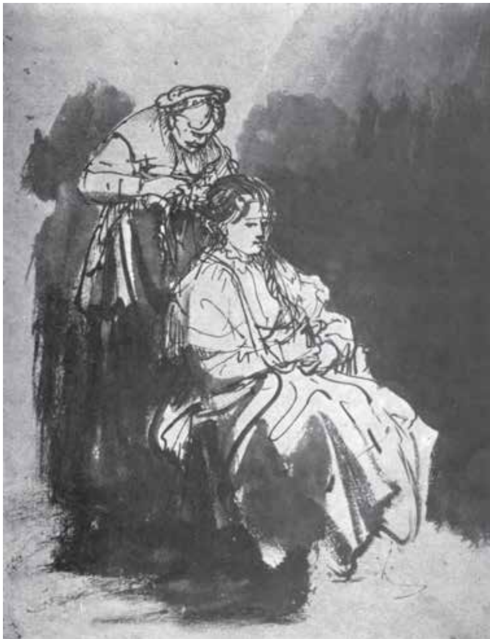
تصویر ۱۰ — طراحی با آب مرکب و قلم‌مو به شیوه خیس در خیس بر روی کاغذ خشک، اثر رامبراند

توصیه می‌شود برای کسب مهارت کافی ابتدا تمرین‌هایی را با استفاده از آب مرکب و قلم‌مو و یا تک‌رنگ با آبرنگ انجام دهید و پس از کسب مهارت با ترکیبات رنگی مختلف کار خود را آغاز کنید. هنرمندانی چون رامبراند از این شیوه، با استفاده از آب مرکب، آثار ارزشمندی از خود به یادگار گذاشته‌اند و بسیاری از پیش‌طرح‌ها و طرح‌های سریع برای تابلوهای نقاشی خود را به این روش طراحی کرده‌اند (البته هنرجویان عزیز با این روش در کلاس طراحی آشنا گردیده‌اند و تمرین‌های کافی انجام داده‌اند) (تصاویر ۱۰ تا ۱۲).