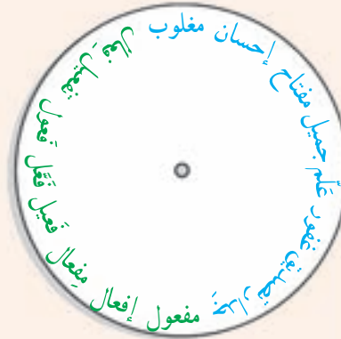
دایره ی اول

فعل و ضمیر را اگر خوب یاد بگیریم، بسیاری از مشکلات ما در فهم و ترجمه ی عبارت ها برطرف می شود!