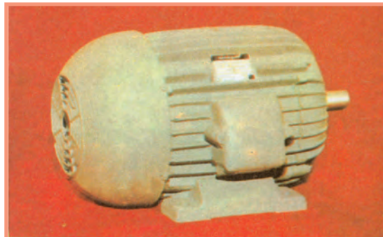
شکل ۱- ۴- الکتروموتور

الکتروموتورها دستگاه‌هایی هستند که انرژی الکتریکی را به انرژی مکانیکی تبدیل می‌کنند (شکل ۴-۱).