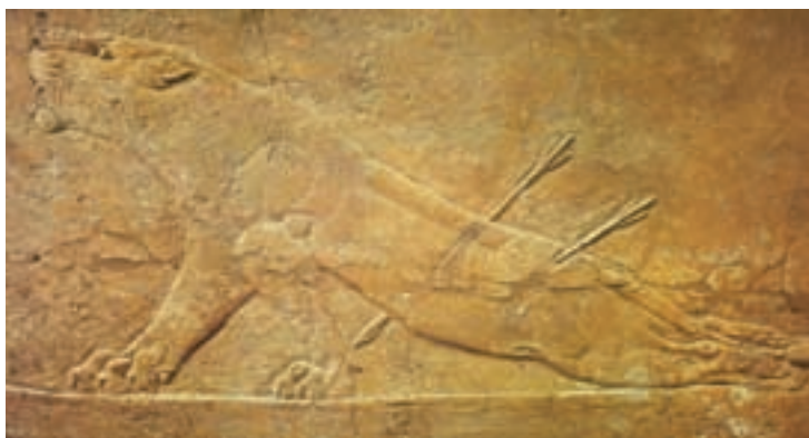
تصویر ۱۱- شیر زخمی در صحنه شکار، حجاری روی سنگ، کاخ آشور بانپال، نینوا، حدود ۶۵۰ قبل از میلاد، موزه بریتانیا

هنر آشوری پس از مدت‌ها اقتباس و تجربه از هنر بابلی و میتانی ۱ ‌های آسیای صغیر (ترکیه امروزی) که در نقش برجسته‌سازی توانا بودند، سبکی را بنیان گذاشت که منشأ موفقیتهای حجاران در دوره آشور جدید گردید و در زمان آشور نصیر پال دوم تبدیل به هماهنگی بین معماری و هنر تصویری شد. هنر آشوری در زمان آشور نصیر پال و آشور بانپال در معماری کاخ‌ها و نقش برجسته‌های دیواری تجلی یافت. نقش برجسته‌ها اغلب به صحنه‌های جنگ، شکار، محاصره شهرها و قلعه‌ها و مراسم مذهبی اختصاص داشت و شاه همچون قهرمان در همه جا حضور داشت. هنرمندان آشوری در نمایش حیوانات به خصوص صحنه‌های شکار بسیار توانا بودند و حالت‌های گریز و ستیز و مرگ حیوانات را طبیعی و دقیق مجسم می‌کردند (تصویر ۱۱). ولی تندیس‌های انسانی در نقش برجسته‌ها و نقاشی‌های دیواری خشک و رسمی هستند و غالباً سر و پا از دید جانبی و بدن از دید روبرو نشان داده شده است ۲ (تصاویر ۱۲ و ۱۳). در میان مجسمه‌های آشوری، شیران و گاوان بالدار با سر انسان، از همه جالب‌تر هستند. این