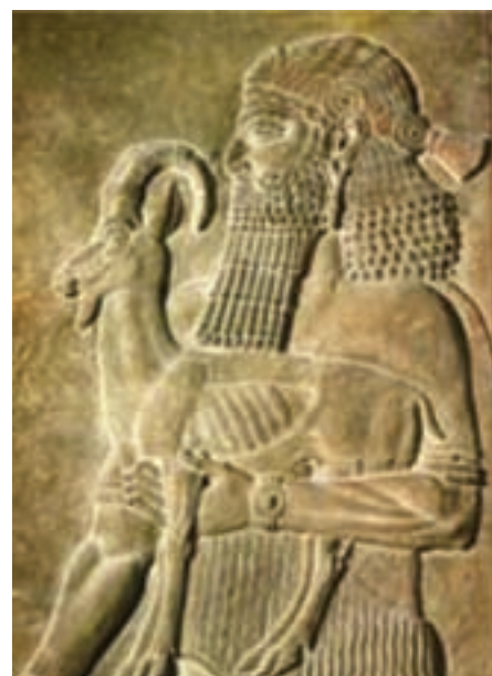
تصویر ۱۲- یکی از هدیه آورندگان، حجاری روی سنگ مرمر، کاخ سارگون دوم، شهر آشور (خورس آباد کنونی)، حدود ۷۲۰ قبل از میلاد، موزه لوور، پاریس