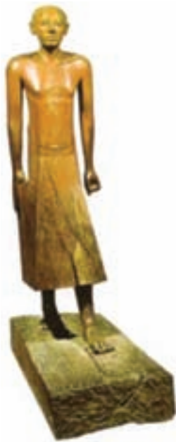
تصویر ۵- تندیس جویی، حدود ۱۹۵۰ ق.م، سلسله‌های قدیم