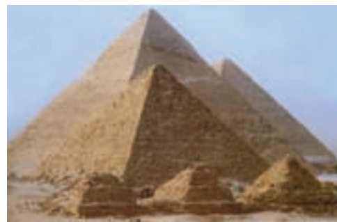
تصویر ۳- اهرام ثلاثه، جیزه، بین ۲۵۷۰ تا ۲۵۰۰ پیش از میلاد

نگهبان هرم‌ها با سر انسان و بدن (انسان - شیر)، در نزدیکی آن قرار دارد (تصویر ۴) و هرم سوم متعلق به موکرینوس ۱ است. بدنه این هرم‌ها با سنگ‌های صاف ساخته شده و اتاق تدفین در داخل آن قرار دارد.