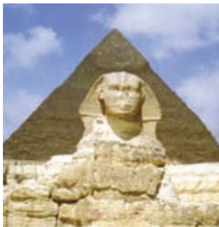
تصویر ۴- تندیس انسان - شیر (ابوالهول) و نمای هرم خنوپس در پشت، جیزه، مصر، حدود ۲۵۳۰ پیش از میلاد