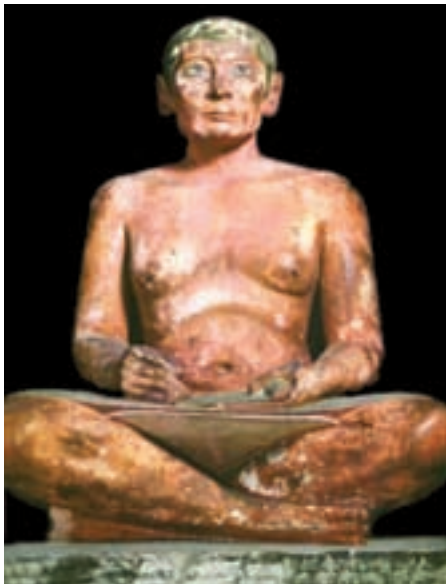
تصویر ۸- کاتب نشسته، سنگ آهک، بلندی ۵۳ سانتیمتر، دوره پادشاهی قدیم، حدود ۲۵۰۰ پیش از میلاد، موزه لوور، پاریس