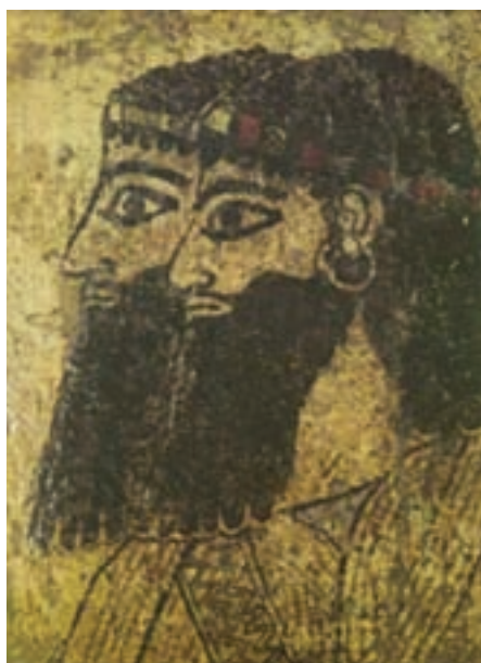
تصویر ۱۳- دو بزرگ زاده آشوری، بخشی از یک نقاشی دیواری، کاخی در سوریه، حدود ۸۰۰ تا ۸۵۰ قبل از میلاد موزه حلب، سوریه