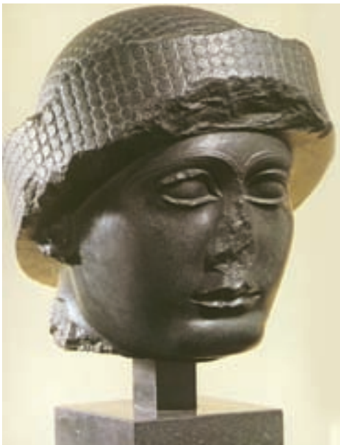
تصویر ۱۰- سر گودا، از سنگ دیوریت، از شهر لاگاش، حدود ۲۱۵۰ پیش از میلاد، موزه بغداد

در زمان تسلط بیگانگان بر بین النهرین یکی از دولت شهرهای سومری به نام لاگاش و به رهبری گودا ۲ استقلال خود را حفظ کرد. گودا حاکمی عمران کننده و مردم دوست بود و در زمان او هنر و معماری سومری تجدید حیات یافت. از گودا تعدادی تندیس سنگی نشسته و ایستاده باقی مانده است که برخی از آنها با ظرافت تمام ساخته شده و در آنها به کشش‌های عضلانی بدن توجه شده است. یکی از زیباترین آنها سردیسی است که هنرمند تلاش کرده، حالت روحانی وی را نشان دهد (تصویر ۱۰). تندیس‌های گودا، مظهر نیایشگری است که با خلوص در مقابل معبود خود قرار گرفته است.