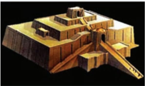
تصویر ۴- معبد (زیگورات) اور و ماکت آن، حدود ۲۰۳۰ سال پیش از میلاد، جنوب عراق

از دوره سومر آثار قابل توجهی مانند آثار معماری، پیکره، مٔهر و گِل نوشته باقی مانده است. معروفترین معابد این دوره معبد آنو ۱ (تصویر ۳) در شهر اوروک ۲ و معبد خدای ماه ۳ (تصویر ۴) در شهر اور است. معبد اوروک بر روی یک سکوی مصنوعی به ارتفاع ۱۳ متر ساخته شده و به دلیل داشتن اندود سفید، به معبد سفید نیز شهرت دارد. باستان شناسان در موقع کشف آن را زیگورات ۴ نامیدند. زیگورات در زبان بابلی به معنی کوه بلند و از نظر سومری‌ها سرچشمه زندگی بود، به همین خاطر سومری‌ها معابد خود را به شکل کوه می‌ساختند و بر این تصور بودند که با ساختن زیگورات‌های بلند ارتباط انسان با خدا آسان می‌شود. زیگورات به بنای بزرگ طبقه طبقه‌ای گفته می‌شود که ابعاد هر طبقه آن از طبقه پایین‌تر کمتر باشد. معبد اور برای خدای ماه ساخته شده و سالم‌ترین و بزرگترین زیگورات بجای مانده در میانرودان است. این معبد دارای سه طبقه بود که اتاق نیایش بر روی طبقه سوم ساخته شده بود و رسیدن به اتاق معبد از سه رشته پله مقدور بود.