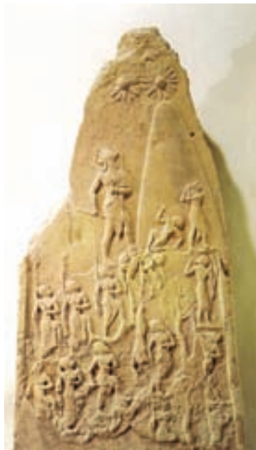
تصویر ۹- لوح پیروزی نارام سین، سنگ، حدود ۲۳۰۰-۲۲۰۰ قبل از میلاد، موزه لوور پاریس