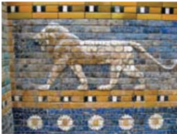
تصویر ۱۷ - آجر لعاب‌دار، کاخ نبوکدنصر، بابل، حدود ۵۷۵ قبل از میلاد. موزه باستان‌شناسی استانبول