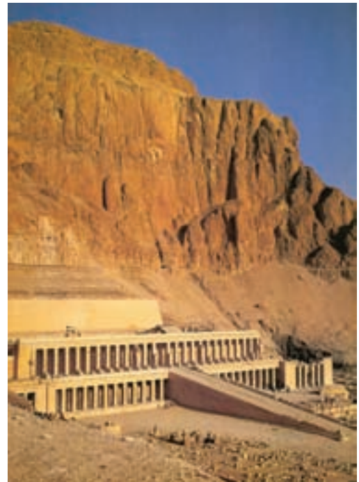
تصویر ۹- معبد حت شپ سوت در دیرالبحری، حدود ۱۴۸۰ پیش از میلاد

دو تن از حاکمان این دوره، اخناتون ۲ و توت عنخ آمون ۳ بسیار مشهور هستند. اخناتون تلاش می‌کرد از قیود سنتی بکاهد و در پی این تلاش، هنرمندان نیز از آزادی محدودی برخوردار شدند و آثاری را خلق کردند که در آن‌ها واقع‌گرایی و طبیعت‌گرایی به چشم می‌خورد که نمونه آن سر اخناتون است (تصویر ۱۰). اما شهرت توت عنخ آمون به دلیل مقبره اوست که دست نخورده کشف شد. در ماسک طلایی روی صورت او آزادی حرکت و حالت به چشم می‌خورد (تصویر ۱۱). از دیگر آثار سلسله‌های جدید، نقاشی‌های دیواری درون مقبره هاست. نقاشی‌های دیواری و نقوش روی کاغذ پاپیروس ۴ ، مراحل زندگی بعد از مرگ را نشان می‌دهند که به نام