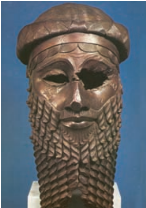
تصویر ۸- سر حاکم اکدی (احتمالاً سارگون)، مفرغ، از نینوا، حدود ۲۲۰۰ تا ۲۳۰۰ پیش از میلاد، موزه عراق

پادشاه را نیز به عهده گرفت، جالبترین اثر دوره اکدی یک سردیس مفرغی است که چهره پادشاهی قدرتمند را مجسم می‌کند که نگاهی اطمینان بخش و با ابهت دارد (تصویر ۸). از نارام سین ۱ نوه سارگون نیز یک لوح سنگی باقی مانده که در آن پیروزی نارام سین و سپاهش نقش شده است (تصویر ۹).