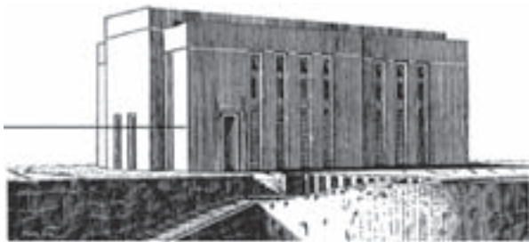
تصویر ۳- معبد آنو، شهر اوروک، حدود ۳۵۰۰-۳۰۰۰ قبل از میلاد، جنوب عراق