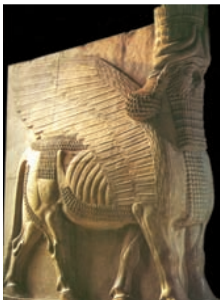
تصویر ۱۴- انسان - گاو (گاو مرد بالدار) سنگ مرمر، دروازه کاخ سارگون دوم آشوری در نینوا، ۷۲۱ - ۷۰۵ پیش از میلاد