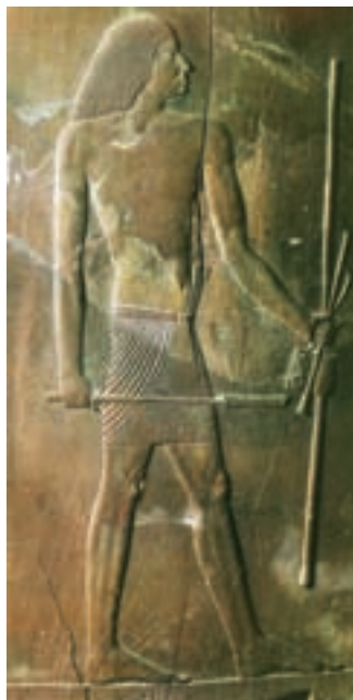
تصویر ۶- بزرگ زاده مصری، حدود ۲۷۵۰ پیش از میلاد، نقش برجسته روی چوب، بلندی ۱۱۴ سانتی‌متر، موزه مصر، قاهره

تندیس‌های این دوره در نگاه اول خشک و بی‌روح جلوه می‌کنند اما باید توجه داشت که در نظر مصریان زیبایی امری باطنی است. آن‌ها برخلاف یونانی‌ها به زیبایی ظاهری توجه نداشتند و هدف آن‌ها ایجاد نظم، استقامت و روح ابدی در مواد جامد و بی‌روح بود. در مصر، هنر تندیس‌سازی مانند دیگر هنرها جنبه مذهبی داشت. مصریان به زندگی ابدی در جهان بعد از مرگ باور داشتند و معتقد بودند که روح در موقع مرگ، بدن را ترک و در جهان دیگر مجدداً در جسم متوفی حلول می‌کند و چون جسم انسان فانی است، مصریان برای متوفی پیکره‌ای بدلی از جسمی سخت (معمولاً سنگ خارا) می‌ساختند تا روح که در نزد مصریان "کا" نام داشت در جسم بدلی حلول کند و در جهان دیگر به حیات خود ادامه دهد. هنرمندان مصری در ساخت تندیس‌ها شبیه‌سازی نمی‌کردند اما برای شناخت صاحب تندیس نام وی را می‌نوشتند. شکل کلی تندیس‌ها ترکیبی از نیم‌رخ و تمام رخ و اکثراً مکعبی و استوانه‌ای شکل‌اند. تندیس‌های ایستاده در حالت خبردار و پای چپ مردان همیشه در جلو پای راست قرار دارد (تصاویر ۵ و ۶) اما پاهای زنان به هم چسبیده و یا کمی از هم فاصله دارند و معمولاً بالاتنه دقیق‌تر ساخته می‌شد. هنرمندان مصری مانند میان‌رودانی‌ها در جانورنگاری از طبیعت‌گرایی پیروی می‌کردند که نمونه برجسته آن‌ها غایب‌های مدم ۲ است (تصویر ۷).