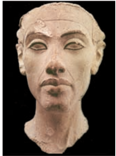
تصویر ۱۰- سر اخناتون، سلسله‌های جدید، ارتفاع ۲۶ سانتی متر، ۱۳۴۰ ق.م، برلین