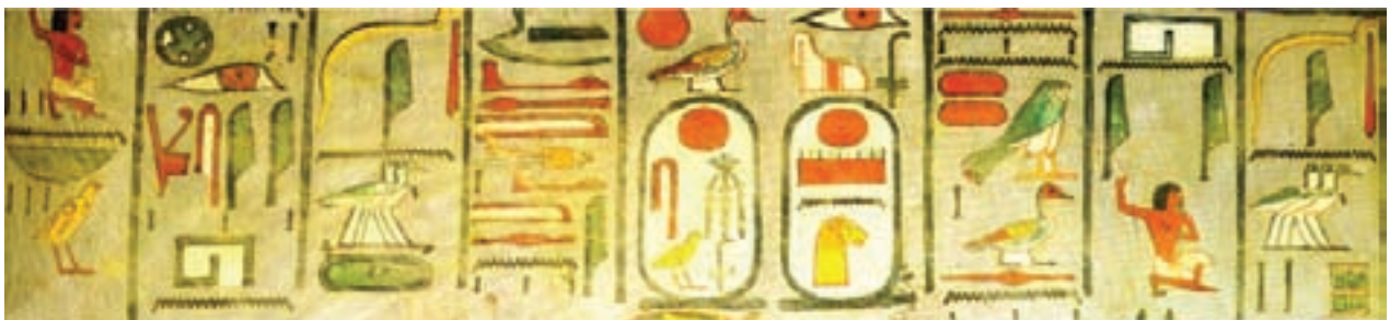
تصویر ۱- خط تصویری هیروگلیف، مقبره رامسس اول، ۱۲۹۰ پیش از میلاد، مصر

مصریان باستان میراث هنری ارزنده‌ای از خود به یادگار گذاشتند که با هنرهای دیگر تمدن‌های جهان تفاوت دارد، آن‌ها همیشه جلوه‌های خوب زندگی را در آثارشان منعکس می‌کردند و برای زنده‌نمایی پیکره‌ها از رنگ‌های قراردادی، قرمز، زرد، آبی، سبز، سیاه و سفید استفاده می‌کردند. نقاشی‌ها و نقوش برجسته آن‌ها دو بعدی و توصیفی است. طبق سنت آن‌ها باید شاخص‌ترین نمای هر چیز نمایش داده شود. از این رو در نقاشی‌های افراد مهم، سر با نمای نیم رخ، اما با چشم‌ها و شانه‌ها از روبرو، سینه‌ها از نیم رخ، کمر و کفل در نمای سه رخ، و پاها از نیم رخ و در حالتی آرام و با وقار نشان داده شده‌اند، ولی افراد فرودست پرتحرک و زنده هستند. هنر مصری هنر محافظه کار، ایستا و با دوامی است که در طول تاریخ خود یکسان مانده است. هنر مصری به خاطر استفاده آگاهانه از هندسه در معماری، شیوه تندیس‌سازی، خوشنویسی (خط هیروگلیف، تصویر ۱)، ساخت تالارهای ستون‌دار، سال شماری شمسی بر تمدن‌های یونان و روم و دیگر تمدن‌های خاورمیانه تأثیر گذار بوده است.