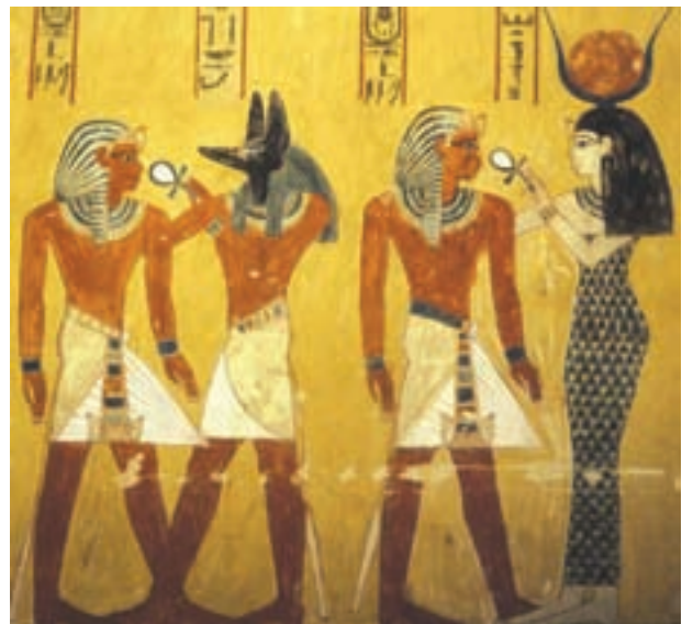
تصویر ۱۲- بخشی از کتاب مردگان، نقاشی دیواری داخل مقبره، ۱۳۹۰ پیش از تصویر ۱۳- ستون‌های معبد رامسس دوم، حدود ۱۲۶۰ ق.م میلاد، سلسله‌های جدید