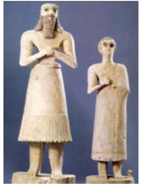
تصویر ۵- تندیس از جنس سنگ مرمر، ابو و همسرش، تل اسمر، حدود ۲۹۰۰ تا ۲۵۵۰ پیش از میلاد، موزه بغداد تصویر ۶- جنگ اور، مقابر سلاطین اور، حدود ۲۶۰۰ پیش از میلاد، موزه دانشگاه فیلادلفیا