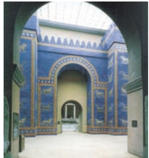
تصویر ۱۶ - بازسازی دروازه ایشتار، بابل، حدود ۵۷۵ پیش از میلاد، موزه دولتی برلین