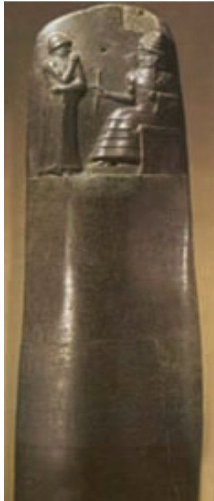
تصویر ۱۵ - قانون نامه حمورابی، لوح سنگی، ارتفاع ۲۱۵ سانتی‌متر، حدود ۲۷۵۰ قبل از میلاد، موزه لوور، پاریس

بابلی‌ها بر جنوب میانرودان مسلط بودند و پایتخت آن‌ها شهر بابل بود. بابلی‌ها دو بار به اوج قدرت رسیدند. نخستین شکوه هنر آن‌ها در دوره بابل قدیم و در زمان حمورابی است که قانون نامه وی که بر روی سنگی مخروطی شکل (لوح سنگی) نقش شده، بسیار مشهور است (تصویر ۱۵). بر روی این لوح حدود ۲۸۲ ماده قانون نوشته شده و در بالای لوح حمورابی در حال دریافت قوانین از خدای خورشید (شمس) است. دومین اوج هنر آن‌ها در دوره بابل جدید و در حدود ۶۰۰ پیش از میلاد است. در این دوره معبد ایشتار و دروازه مشهور آن و برج افسانه‌ای شهر بابل توسط نبوکدنصر ۱ (بخت النصر) ساخته شد. (تصاویر ۱۵ و ۱۶) بابلی‌ها وارث هنر و تمدن سومری‌ها و اکدی‌ها بودند. بابلی‌ها نیز مانند همه ملل قدیم میان هنر و صنعت تفاوتی قائل نبودند. اما هنرمندان از احترام زیادی برخوردار بودند و دولت‌های همسایه همواره خواستار حجاران، نجاران، بنایان و آهنگران بابلی بودند و از آن‌ها در کارهای ساختمانی استفاده می‌کردند. هنر بابلی همچون هنر سومری - اکدی در خدمت مذهب و حکومت بود و هنرمندان به ساخت و تزیین معابد، تجسم خدایان و بازنمایی حکام و کارگزاران حکومت می‌پرداختند. بابلی‌ها در ساخت آجرهای لعاب‌دار بسیار توانا بودند و نمونه کار برجسته آن‌ها آجرهای لعاب‌دار منقوش دروازه ایشتار است که از جمله شاهکارهای هنری جهان باستان محسوب می‌شود (تصویر ۱۷).