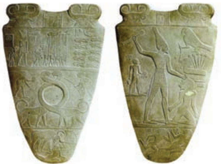
تصویر ۲- لوح سنگی (پشت و رو) منسوب به نارمر، حدود ۳۱۰۰ پیش از میلاد، بلندی ۶۲ سانتی متر، موزه مصر، قاهره

با شروع سلسله‌های اولیه، هنر حجاری، تندیس‌سازی و نقاشی شکوفا شده و در ساخت مصنوعات هنری، قواعدی پایه‌گذاری شد، بطور مثال در حجاری و تندیس‌سازی همیشه پای چپ جلوتر است. مهمترین اثر هنری این دوره که برای شناخت خصوصیات هنر مصر مناسب است یک لوح سنگی است که به شاه نارمر ۱ نسبت داده می‌شود. نقش‌کنده کاری شده در دو سوی این لوح به یک رویداد سیاسی اشاره دارد و گویای اتحاد مصر علیا و سفلی توسط نارمر است (تصویر ۲). در این دوره ساخت مقبره اهمیت یافت. مقبره‌ها را به صورت حفره‌های مستطیل شکل می‌ساختند و متوفی را داخل آن قرار داده و روی آن‌را با سقف چوبی پوشانده و درون آن هدایا و لوازم زندگی برای جهان بعد از مرگ قرار داده و سطوح داخلی آن‌را با نقاشی و حجاری تزیین می‌کردند.