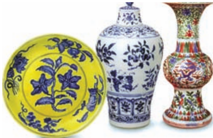
تصویر ۱۴- چینی‌های چند رنگ با نقوش گیاهی، سده ۱۵ و ۱۶ میلادی، موزه بیجینگ، چین