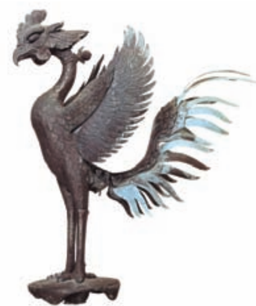
تصویر ۵- ققنوس مفرغی، سده ۱۱ میلادی، نماد معبد بیودو- این