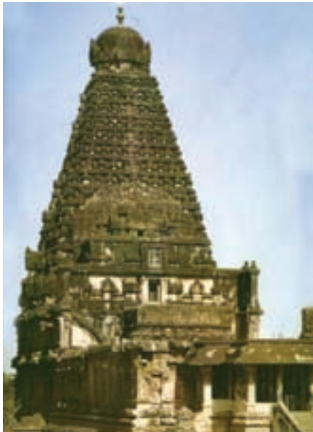
تصویر ۱۰- معبد بریهادس وارا در تانجور هند، حدود ۱۰۰۰ میلادی

علوم، ادبیات، نقاشی، مجسمه‌سازی، رقص و موسیقی به اوج کمال رسیدند. مهم‌ترین نمونه‌های هنری این دوره، دیوارنگاره‌های غارهای آجاتنا ۱ است که برخی از آن‌ها، بازتاب هنر نقاشی ایران دوره ساسانی هستند (تصویر ۹). این نقاشی‌ها داستان زندگی بودا و صحنه‌های زندگی روزمره را تجسم بخشیده‌اند. این نقاشی‌ها را باید در ردیف آثار بزرگ نقاشی جهان به‌شمار آورد. نقاشی بودیساتوا ۲ نمونه‌ای ارزشمند از این نقاشی‌ها است که در آن، اعضای صورت بودا بسیار ظریف نقاشی شده و نرمی حرکات و برجستگی جسمانی تندیس‌های دوره‌های گذشته را در خود دارد.