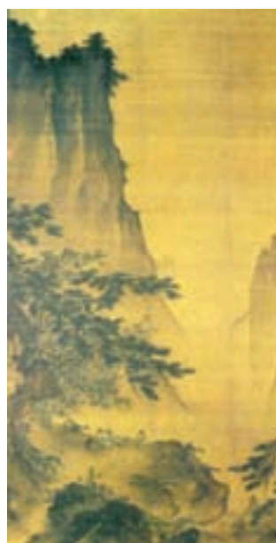
تصویر ۴- منظره در مهتاب اثر مایوان ۴ ، دوره سونگ، حدود ۱۲۰۰ میلادی، طومار آویختنی، جوهر و رنگ روی ابریشم، ۷/۱۴۹ در ۲/۷۸ سانتی متر، موزه کاخ ملی، تایوان