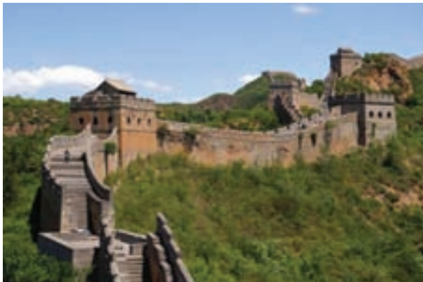
تصویر ۸- دیوار چین، بر روی کوه‌های شمالی چین برای جلوگیری از تهاجم بیگانگان، تاریخ ساخت از حدود ۲۵۰ پیش از میلاد تا سده ۱۵ میلادی