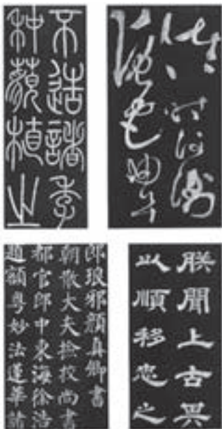
تصویر ۲- نمونه ای از خوشنویسی دوره تانگ

در نظر چینی‌ها انسان بر طبیعت مسلط نیست، بلکه بخشی از آن است. و نقاش کسی است که بتواند عظمت و زیبایی‌های طبیعت را بر انسان آشکار کند. نقاشی سنتی چین، به لحاظ سرزندگی و ریتم خط و ضرباهنگ قلم مو، تأثیر زیادی از خوشنویسی گرفته و در اغلب نقاشی‌های چینی از خط نوشته به شکل امضاء، شعر یا اظهار نظر هنرمند استفاده شده است. چینی‌ها عقیده داشتند که تمامی رنگ‌ها در مرکب، وجود دارد. نقاش چینی با مهارت بسیار، تنوعی از رنگ‌سایه‌ها را در ذهن خود به دست می‌آورد و پیش از نقاشی کردن، ساعت‌ها به تفکر می‌نشست و تصویر مورد نظر را در ذهن خویش کامل می‌کرد و در مرحله اجرا آن را بسیار سریع به انجام می‌رساند. پس از آن، هیچ‌گونه تصحیح یا تغییری در تصویر ممکن نبود. نقاش باید دستی خطا ناپذیر و تسلطی بی‌چون و چرا بر قلم موی خود می‌داشت. منظره نگاری همواره در نقاشی چینی اهمیت داشته است. منظره طبیعی از زمان‌های کهن مورد توجه بوده است. نقاشان چین علاقه‌ای به قواعد پرسپکتیو نداشتند. منظره سازی‌های توماری، از