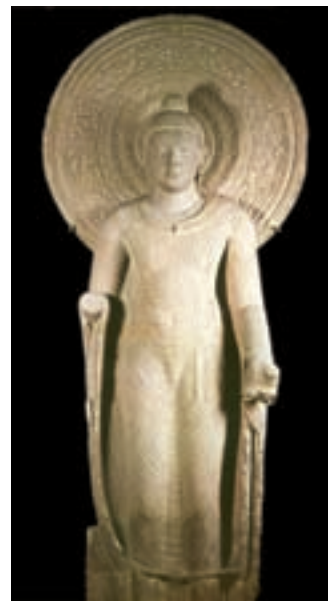
تصویر ۷- تندیس بودای ایستاده، سده پنجم میلادی، سنگ ماسه قرمز، ارتفاع ۲۲۱ سانتی متر، ماتهورا، موزه هند، کلکته

همزمان با آغاز عصر مسیحیت، کوشانی‌های ایرانی تبار در شمال غربی هند، قدرت را به دست گرفتند و عصر طلایی دیگری در هنر هند شکل گرفت و به‌طور همزمان در گاندهارا ۲ (قندهار) و ماتهورا ۳ نخستین شمایل‌های بودا به‌وجود آمدند. نفوذ هنری یونان، نقش مهمی در شکل‌گیری تمثال‌سازی برای بودا داشت، زیرا تا پیش از سدهٔ دو میلادی برای بودا تمثال ساخته نمی‌شد. سبک گاندهارا (قندهار) تلفیقی از سنت‌های هلنیستی، ایرانی و هندی بود. بودای ماتهورا شانه‌های پهن، کمر باریک، چهره لطیف و ردایی نازک به تن دارد و از سنت‌های بومی متأثر است (تصویر ۷)، در حالی که تندیس‌های گاندهارا بر خاصیت‌های عاطفی تأکید دارند و از ریزه‌کاری‌های هنر یونان دورهٔ هلنی و ایران دورهٔ اشکانی نظیر توجه به آرایش چهره و زیورآلات و چین لباس متأثر شده‌اند (تصویر ۸).