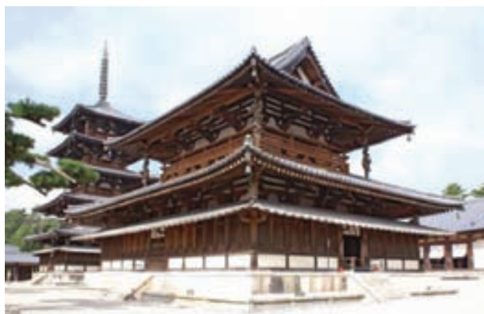
تصویر ۶- معبد هوریوجی ۴ ، سده ۸ میلادی، نارا