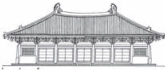
تصویر ۹- طرح خطی یک معبد بودایی در سده ۹ میلادی

در سال ۱۲۶۰ میلادی، سلسله سونگ توسط مغولان فرو پاشید و مغول‌ها سلسله یوان را تأسیس کردند. در این دوره نیز نقاشی دارای اهمیت ویژه بود و نقاشان آثار ارزشمندی خلق کردند.