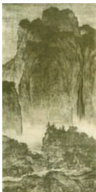
تصویر ۵- مسافران در میان کوه و آبراه‌ها، اثر فان کوان ۵ ، حدود ۹۹۰-۱۰۳۰ میلادی، مرکب بر روی ابریشم، دوره سونگ، کاخ-موزه ملی تای بی