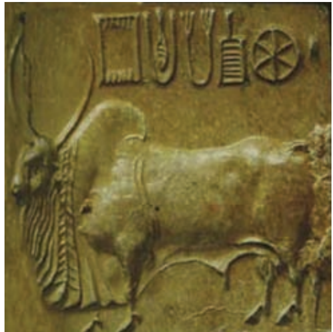
تصویر ۱- اثر مهر روی گنج با نقش گاو میش، حدود ۲۳۵۰ تا ۱۵۰۰ پیش از میلاد، موهنجو- دارو، پاکستان