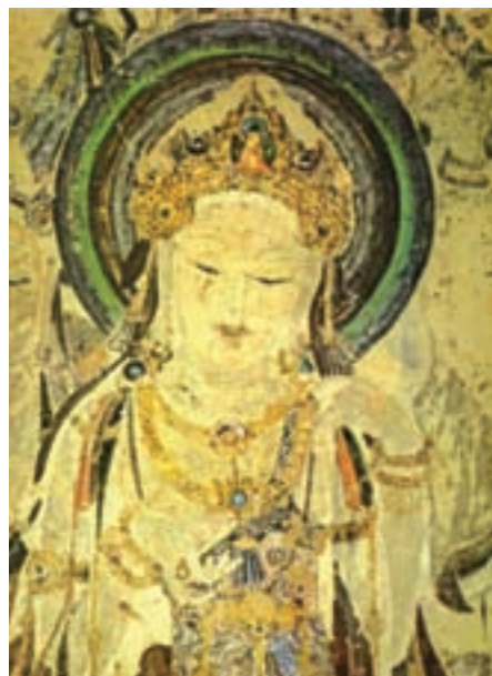
تصویر ۳- بودیساتوا ۲ ، نقاشی داخل غارهای دون‌هوانگ ۳ در شمال غربی چین، دوره تانگ

منظره‌سازی در دوره سونگ، به اوج خود رسید و هنرمندان سونگ تعریفی خاص از فضای تصویری به‌دست دادند که به‌عنوان سر مشقی تا سده بیستم ادامه یافت، نقاشان مکتب سونگ از تمام امکانات قلم و مرکب بهره می‌گرفتند و با حداقل وسایل، جوهر طبیعت را در آثار خود منعکس می‌کردند و طبیعت را چون جهانی بی‌انتها، پرشکوه تصویر می‌کرد و برای فضاهای پُر و خالی ارزشی برابر قائل بود (تصاویر ۴ تا ۶). در نقاشی چینی انواع مضمون‌های دینی و دنیوی مورد توجه بود. آیین بودایی نیز موضوع‌های جدیدی را در اختیار هنرمندان قرار داد و سبب رواج نقاشی دیواری گردید.