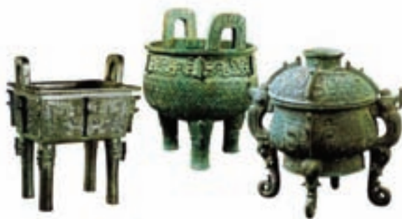
تصویر ۱۶- ظروف مراسمی حدود ۱۰۰۰ پیش از میلاد، دوره چو، موزه‌های چین

ساخت اشیای فلزی به خصوص اشیای مفرغی در چین بسیار پر رونق بود. هنرمندان بر روی ظروف منظره، نوشته، اژدها، انواع جانوران و موجودات خیالی را نقش می‌کردند و از آن‌ها در مراسم عروسی و عزا استفاده می‌کردند (تصاویر ۱۵ و ۱۶).