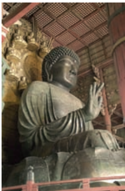
تصویر ۳- تندیس بزرگ بودای نشسته، معبد تودای-جی در نارا، مفرغ، ارتفاع حدود ۱۵ متر، ۷۵۲ میلادی

تا پیش از ورود آئین بودایی از طریق کره در سال ۵۵۲ میلادی، تندیس سازی در ژاپن به طور جدی مطرح نبود. صنعتگران کره‌ای همراه با مبلغان بودایی به ژاپن رفتند و طرز ساختن تندیس‌های بودایی را به ژاپنی‌ها یاد دادند. اولین تندیس‌های بودا که در سده‌های ۶ و ۷ میلادی ساخته شدند، برگرفته از هنر یونانی - بودایی سده‌های ۱ تا ۳ میلادی گندهارا (قندهار) هستند و سبکی واقع گرایانه دارند. برخی از آثار این دوره، در زمره نفیس‌ترین و اثرگذارترین تندیس‌های مذهبی جهان به‌شمار می‌آیند (تصاویر ۲ و ۳).