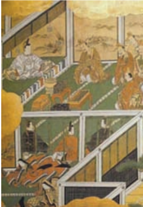
تصویر ۷- بخشی از پرده نگاره شش لته، سده ۱۸ میلادی

هنر نقاشی در ژاپن از زمانی متداول شد که راهبان بودایی و صنعتگران کره‌ای و چینی در آنجا اقامت کردند. در سده ۸ میلادی، نفوذ هنر عصر تانگ در شهر نارا تثبیت شد. نقاشی دیواری و طوماری با مضمون‌های بودایی که ریشه در هنر هند داشت، رواج یافت.