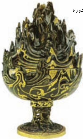
تصویر ۱۵- بخور سوز، با در پوشی به شکل کوه، دوره هان، حدود ۱۱۳ پیش از میلاد، موزه ایالتی هبی

چینی‌ها در ساخت سفال به ویژه سفال‌های لعابدار بسیار توانا بودند. نخستین ظروف سفالی منقوش که دارای نقش‌های هندسی هستند در هزاره پنجم پیش از میلاد (دوره نوسنگی) ظاهر می شوند. عالی ترین ظروف سفالی چین ظروف موسوم به چینی هستند. ساخت آن‌ها از ابتکارات سفالگران چین است که در عصر سلسله‌های تانگ، سونگ و مینگ به اوج خود رسید. در میان آن‌ها چینی‌های موسوم به آبی و سفید (تصویر ۱۴) مشهور هستند. این گونه ظروف، از دوره تانگ به این سو به بسیاری از نقاط جهان از جمله به ایران صادر می شد و سبب تحرک سفالگری دوره اسلامی ایران شد.