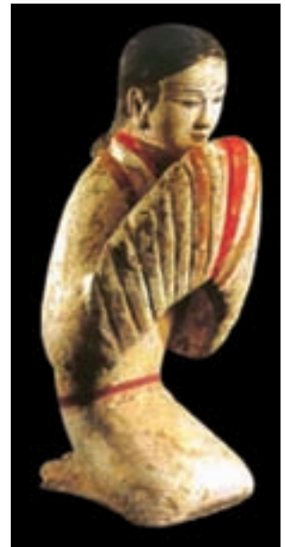
تصویر ۱۱- تندیس زن خدمتکار از گل پخته، دوره هان، موزه هانیان گلینگ ۱

کشف مقبره امپراتور سلسله چین در سال ۱۹۷۴ میلادی، توانایی چینی‌ها را در ساخت تندیس‌های بزرگ سفالی نشان می‌دهد. در این مقبره تندیس سربازان و اسب‌هایشان که نماینده سپاهیان امپراتور بودند، کشف شد (تصویر ۱۲).