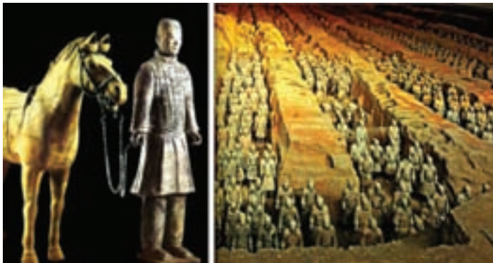
تصویر ۱۲- بخشی از سربازان محافظ مقبره امپراتور چین (شی هوانگدی ۲ ) و تندیس سرباز و اسب، سال ۲۱۰ پیش از میلاد، مکتشف در خیابان یان، از جنس گل پخته، اندازه طبیعی

این تندیس‌ها بسیار واقع‌گرا ساخته شده‌اند و در بازنمایی جزئیات و تجهیزات سربازان بسیار دقت شده است. ورود آیین بودا به چین، تندیس‌سازی را تحت تأثیر قرار داد. هنرمندان به تقلید از الگوهای هندی یا آسیای مرکزی، اصول زیبایی‌شناسی تازه‌ای به وجود آوردند. هنرمند