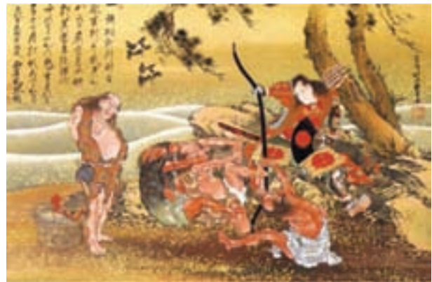
تصویر ۱۱ - طومار آویختنی، اثر هکوسای، مرکب بر روی ابریشم، ۳/۵۹ در ۹/۸۱ سانتی متر

ژاپنی معرّف زنده ترین هنر بومی و مردمی است ۲ که بر اساس موضوع های زندگی روزمره و جدید از اواخر سده هفدهم تا میانه سده نوزدهم میلادی در جهتی متفاوت از جریان های هنر خواص شکل گرفت. طراحی لباس و شخصیت سازی بازیگران و باسمه های رنگی تأثیری عمیق بر هنر اروپایی اواخر سده ۱۹ میلادی گذاشتند. هکوسای ۳ و اوتامارو ۴ با باسمه ها و طراحی هایشان از چشم انداز های ژاپنی، به عنوان استادان بزرگ تاریخ هنر شناخته شده اند (تصاویر ۱۱ و ۱۲). ژاپن در سده ۱۹ میلادی دروازه های خود را بر روی جهان غرب باز کرد و آماده پذیرش فرهنگ غرب شد و به تدریج از شیوه های سنتی دور شد و مکاتب نقاشی غرب مورد توجه قرار گرفت. بعد از جنگ جهانی دوم، برخی از نقاشان