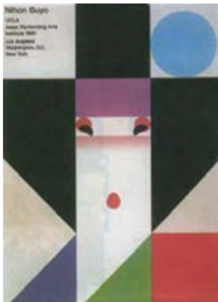
تصویر ۱۳- پوستر برای مدرسه هنرهای نمایشی آسیایی، سال ۱۹۸۱

با بهره‌گیری از سنت‌های گذشته و تلفیق آن با شیوه‌های هنر غرب به نتایج تازه دست یافتند. از نیمه دوم سده بیستم نقاشان و تصویرگران ژاپنی با نوآوری‌های فنی و سادگی صوری و ظرافت بیان و حفظ هویت فرهنگی، جایگاه مهمی را در هنرهای بصری جهان به دست آورده‌اند (تصویر ۱۳).