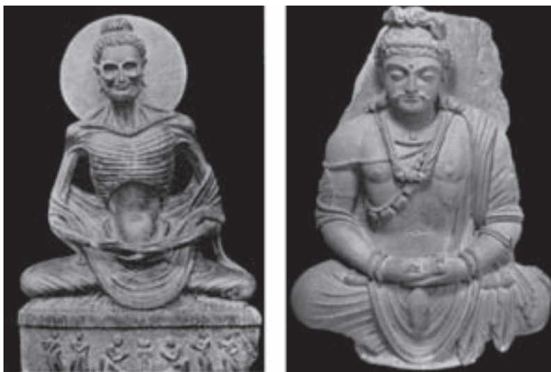
تصویر ۸- بودای نشسته و بودای روزه‌گیر، سده سوم میلادی، سنگ، گاندهارا، پاکستان