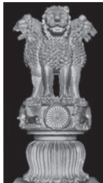
تصویر ۳- سر ستون، پاتنا، هند، ماسه سنگ صیقل خورده، حدود ۲۶۱ تا ۲۳۲ پیش از میلاد

آشوکا دین بودایی را پذیرفت و آن‌را رواج داد و در زمان او هنر بودایی هند شکل گرفت. آشوکا در شهرهای مختلف هند پرستش‌گاه‌هایی بنا نهاد که الگوی معماری هند شد. این پرستش‌گاه که استوپا ۴ ( یادگار بودا) نام داشت، شامل یک گنبد بر پایه‌ای گرد یا چهارگوش و یک فضای مربع شکل بر قله آن و یک دکل بلند برافراشته در وسط آن بود. استوپا را می‌توان نموداری کیهانی به‌شمار آورد که دروازه‌هایش چهار نقطه اصلی کوه جهانی را می‌نمایانند. در این پرستش‌گاه‌ها تندیس بودا وجود