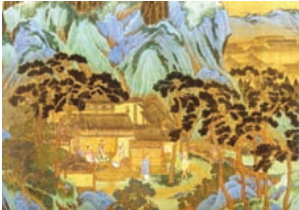
تصویر ۷- بخشی از یک منظره به سبک آبی و سبز، اثر چین ینگ، دوره مینگ، گالری هنر فریر در واشنگتن آمریکا