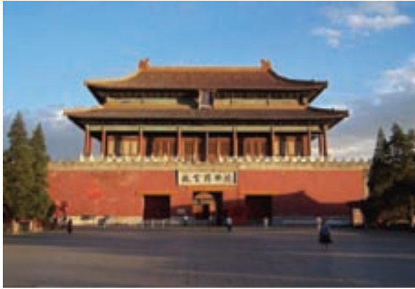
تصویر ۱۰- نمایی از بناهای شهر ممنوعه در پکن، دوره مینگ