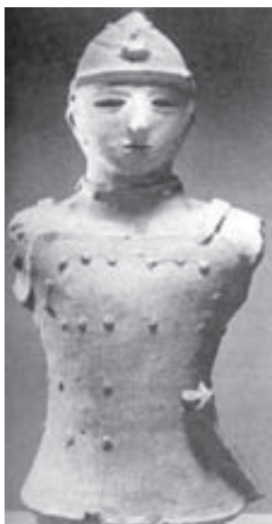
تصویر ۱- جنگاور جوشن پوش، گل مجسمه سازی، سده ۳ تا ۶ میلادی، مجموعه نگیشی، سایناما

جزایر ژاپن به دلیل آتشفشانی بودن آن‌ها، سنگ مناسب برای حجاری و کنده کاری ندارند، لذا برای تندیس سازی، از گل رُس و چوب و فلز استفاده می‌کردند. نخستین تندیس‌های سفالی مربوط به هزارهٔ چهارم پیش از میلاد، مربوط به دوران نوسنگی، غالباً طرحی حصیرگونه و درهم بافته دارند. فن مفرغ کاری در سده اول میلادی از چین به ژاپن رسید. بر روی زنگوله‌های مفرغین مربوط به این دوره خطوط و تصاویر ساده حک شده و یا نقوش کم برجسته دیده می‌شود. سپس در سده‌های ۴ تا ۷ میلادی، تندیس‌های مقبره‌ای موسوم به هانیوا ۱ شکل گرفتند، این مقبره‌ها به شکل استوانه‌های گلینی بودند که در بالای آن‌ها تندیس‌های انسانی و جانوری و یا پرند قرار می‌گرفت (تصویر ۱).