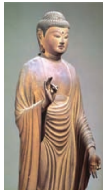
تصویر ۲- تندیس بودا، معبد تودای-جی در نارا، چوب، ارتفاع ۹۸/۷ سانتی‌متر، سده ۸ میلادی