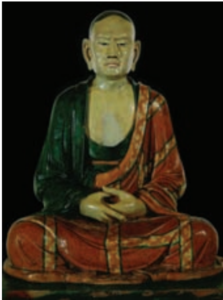
تصویر ۱۳- بودای نشستہ، سفال لعاب دار، دوره سونگ، موزه بریتانیا

چینی الگوی هندی را در طول بیش از یک سده دستخوش تغییرات ساخت. این تغییرات را می توان در معابد غار مانند بودائیان در شمال غربی چین (دون هوانگ) که در دل کوه‌ها تراشیده یا نقاشی می شد، مشاهده کرد. تندیس‌ها و نقاشی‌های موجود در این غارها به لحاظ اندازه و بیان مفهوم، از مهمترین آثار سترگ و مذهبی در جهان به شمار می آیند. هزاران تندیس، نقش برجسته و نقاشی دیواری موجود در این غارها، ترکیبی از حرکت در تندیس سازی هندی و خصلت خطی موزون و آرام در هنر چینی را به نمایش می گذارد. در دوره تانگ موج تازه‌ای از هنر هندی عصر گوپتای هند به چین رسید و سبب نوعی شکل سازی کامل و پراحساس در تندیس‌ها شد. در دوره سونگ ساخت تندیس‌های سفالی و چوبی خدایان بودایی مورد توجه قرار گرفت. فضای متفکرانه عصر سونگ بر روی تندیس سازی مؤثر بود و سبب شد پیکره‌ها ظریف تر، متفکرتر و آرام تر ساخته می شوند (تصویر ۱۳).