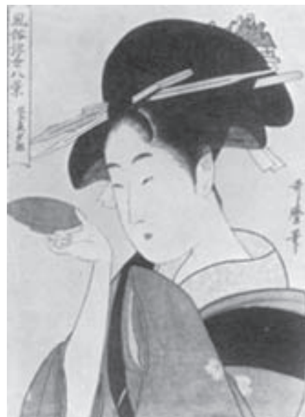
تصویر ۱۲- نیم تنه بانوی زیبا، اثر اوتامارو، باسمه رنگی، سده نوزدهم، موزه هنر کلیولند