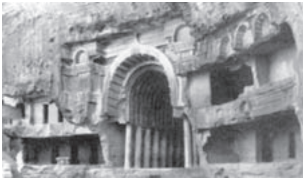
تصویر ۴ - ورودی معبد چایتیا در بهاجا، سده اول پیش از میلاد

شونگا است و از ماسه سنگ زرین محلی ساخته شده است. این استوپا نیم گنبدی است که بر روی صفا ای مدور با حفاظی مرکب از زرده‌های سنگی قرار دارد و در پیرامون این توده مدور حصار سنگی دیگری دارای چهار دروازه است که در دوره آندرا به بنا