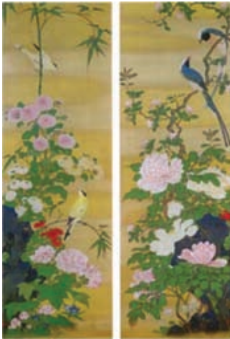
تصویر ۱۰ - گل و پرند، نقاشی آبرنگ روی کاغذ، سده ۱۹ میلادی