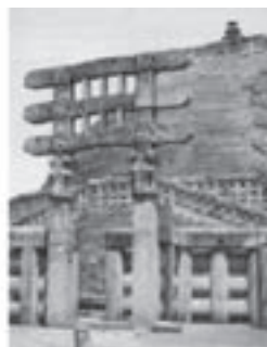
تصویر ۶ - دروازه و معبد بزرگ بودا، دهکده سانچی، سده اول پیش از میلاد تا سده اول میلادی