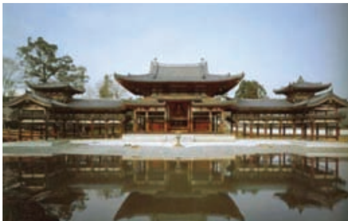
تصویر ۴- معبد بیودو- این، سده ۱۱ میلادی در اوچی، کیوتو ۲

معابد چند طبقه آن‌ها نیز به تقلید معابد چینی ساخته شده‌اند (تصویر ۶).