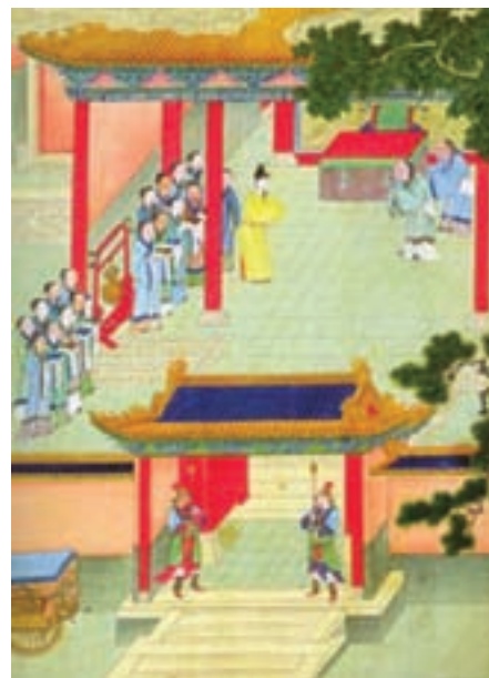
تصویر ۱- نقاشی خیالی، از مراسم معرفی در کاخ امپراتور در دوره هان، سده ۱۷ میلادی

در دوره‌های شانگ و چو ساخت اشیای مفرغی شکوفا شد. در دوره سلسله چین، که نام خود را به این سرزمین داده است، وحدت سیاسی و فرهنگی پدید آمد. در دوره هان، ارتباط چین با جهان غرب (ایران و روم)، گسترش یافت و جاده ابریشم گشوده شد (تصویر ۱).