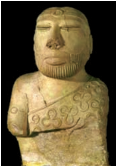
تصویر ۲- نیم تنه مرد روحانی، سنگ صابون، موهنجودارو، ۲۰۰۰ تا ۱۷۵۰ پیش از میلاد، ارتفاع ۱۷/۵ سانتی‌متر، موزه ملی پاکستان، کراچی

نقوش این مهرها بازتابی از تأثیرات هنر ایران و میانرودان و نشان‌دهنده ارتباط مردم دره سند با این سرزمین‌ها است. تندیسک‌های مکشوفه دره سند دارای شکل‌های نرم و خم‌دار و اندام گرد و برجسته هستند و این شیوه باز نمایی در تندیس‌سازی‌های آینده هند استمرار یافت. یکی از قابل توجه‌ترین آن‌ها نیم تنه مردی است که از موهنجودارو کشف شده است (تصویر ۲).