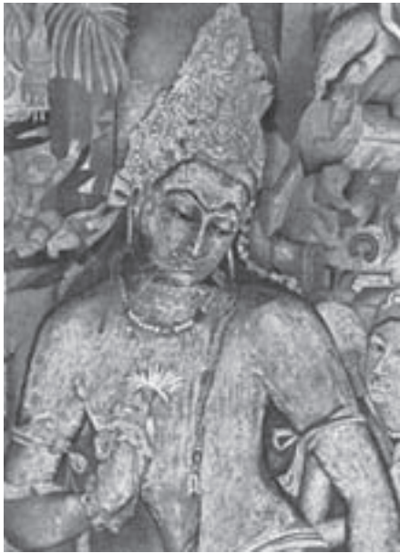
تصویر ۹- دیوارنگاره بودیساتوا، غار شماره یک آجاتنا، حدود ۶۰۰ تا ۶۴۲ میلادی