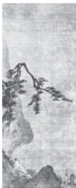
تصویر ۶- دانشور غرقه ماه، اثر مایوان، طومار آویختنی، مرکب و رنگ روی ابریشم، دوره سونگ، موزه هنر موآ، آتامی ۶