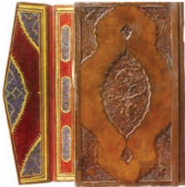
تصویر ۱۶- جلد ضربی. ایران، جلد کتاب مهر و مشتری، ساخته شده در سال ۸۸۷ هجری. موزه توپ‌کاپی، استانبول

تأکید قرآن بر خواندن و نوشتن سبب توجه مردم به کتاب و کتاب آرابی شد. در نزد مسلمانان، کتاب تنها وسیله انتقال اندیشه نبود، بلکه نشر کتاب سبب شکل‌گیری هنر جلد‌سازی، کاغذسازی، تذهیب، خوشنویسی، نگارگری و آرایش صفحات شد (تصویر ۱۵). بسیاری از کتاب‌ها دارای سرلوح، جدول، نقش‌های رنگین و زرین، و تزینات گوناگون بودند. جلدسازان نیز برای کتاب‌ها جلد‌های نفیسی چون ضربی (تصویر ۱۶)، سوخت و روغنی (لاکی) می‌ساختند. در دوره تیموری هنر کتاب‌سازی و کتاب آرابی به اوج خود رسید و نفیس‌ترین کتاب‌ها نوشته و آراسته شد. در سده نهم هجری (پانزدهم میلادی) جلد‌های ایرانی به اروپا رسید و جلد‌سازی اروپا را تحت تأثیر قرار داد و جلد‌هایی با نقش‌های ایرانی ساخته شد.