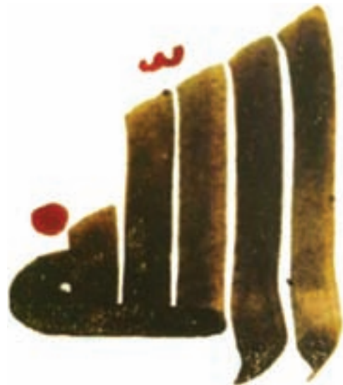
تصویر ۱۰- کلمه الله، خط کوفی، مصر، سده ۱۳ هجری

خوشنویسی ممتازترین و شریف‌ترین هنر اسلامی است. قرآن کریم نقش اول را در تعالی آن به عهده داشت، زیرا قرآن باید با خطی نوشته می‌شد که شایسته آن باشد (تصاویر ۱۰ و ۱۱)، کاتبان وحی با سعی و تلاش خط عربی را به هنر درجه اول تبدیل کردند. یکی از ویژگی هنرهای اسلامی استفاده از خط در همه دست ساخته‌ها است. هنرمندان عبارات مذهبی و غیر مذهبی را با زیبایی هرچه تمامتر روی آثار مختلف می‌نوشتند. یکی از جذابیت‌های خوشنویسی مسلمانان تنوع خطوط آن‌ها است. خط‌های کوفی، نسخ، ثلث و نستعلیق بیشترین رواج را داشت و خوشنویسان ایرانی در طراحی و تنوع خطوط سهم بیشتری داشتند (تصاویر ۱۰ تا ۱۴).