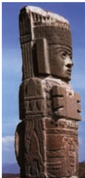
تصویر ۵- تندیس ایستاده، تولتک، مکزیکوسیتی

در پایان سده هشتم میلادی توتوتی و آکان به نابودی کشیده شد و در اوایل سده دهم میلادی جای خود را در دره مکزیک به موج‌های مهاجم قبایل تولتک داد. هنر تولتک هندسی و خشک است. جنگ داخلی و تهاجمات دیگر قبایل، باعث فروپاشی دولت تولتک شد (تصویر ۵).