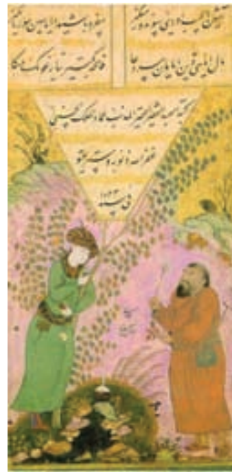
تصویر ۲۳- مکتب اصفهان، صفحه پایان مخزن الاسرار، اثر رضا عباسی و میرعماد در ۱۰۲۲ هجری