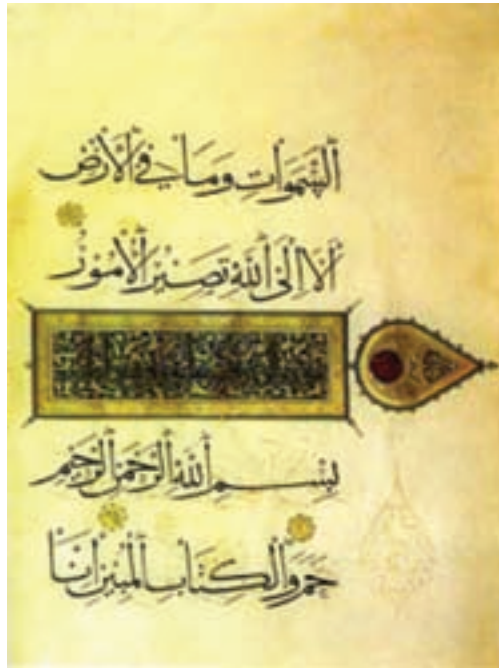
تصویر ۱۲- یک صفحه قرآن به خط ثلث، خط احمد بن سهروردی، اوایل سده هشتم هجری (دوره ایلخانی)، موزه ملی ایران