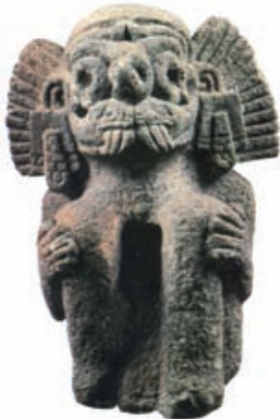
تصویر ۶- تندیس سنگی تالوک، خدای باران آزتک، سده‌های ۱۴-۱۵ میلادی، ارتفاع ۴۰ سانتی‌متر، موزه مردم‌شناسی، برلین

اینکاها از اقوام آمریکای جنوبی بودند که در سده‌های ۱۵ و ۱۶ میلادی حکومت قدرتمندی در پرو و اکوادور به وجود آوردند که توسط اسپانیایی‌ها به نابودی کشیده شد. آن‌ها به لحاظ مهارت در مهندسی ساختمان و شیوه معماری خشک (بدون ملات) شهرت دارند. معماری شکوهمند اینکا در مراکز عمده‌ای چون کوزکو ۴ و ماچوپیکچو ۵ مشهور است. معابد هرمی شکل و مرتفع آن‌ها از پاره‌ای جهات به اهرام مصر و زیگورات‌های بین‌النهرین شباهت دارند. در سده‌های ۱۹ و ۲۰ میلادی، آشنایی هنرمندان معاصر با هنر و تمدن گذشته اینکاها سبب گردید که هنر این قوم مورد تقدیس و ستایش قرار گیرد.