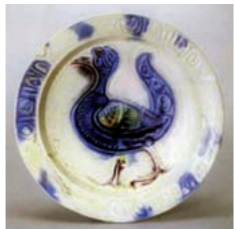
تصویر ۲۷- بشقاب با نقش پرند، سوریه یا مصر، سده هفتم هجری، موزه ارمیتاز

با شروع دوره اسلامی، هنر سفالگری، به ویژه ساخت سفالینه های لعاب دار رونق گرفت. شهرهای مصر، سوریه، عراق و ایران به مراکز تولید ظروف سفالی تبدیل شدند. تحریم استفاده از ظروف طلا و نقره و ورود ظروف چینی ساخت کشور چین به سرزمین های اسلامی نیز سبب تحرک این هنر شد و سفال سازان برای بهبود کار خویش بسیار تلاش کردند و ظروفی را با لعاب ها و نقش های بسزیا خلق کردند که تا امروز همتا ندارد. سفالینه های لعابی، مینایی و زرین فام شهرهای نیشابور، کاشان، ری و ... بی رقیب بود (تصاویر ۲۷ تا ۲۹).