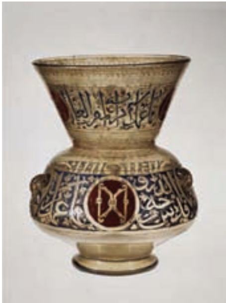
تصویر ۳۳ - قندیل (چراغ سقفی)، سده ۸ هجری، دوره مملوک، موزه هنر متروپولیتن نیویورک

شیشه‌گری نیز از فنون و هنرهای دوره اسلامی است که به‌ویژه در دوره سلجوقی با الگوبرداری از شیشه‌گری دوره ساسانی و مراکز شیشه‌گری در سوریه و سایر کشورهای حوزه مدیترانه شرقی شکوفا بوده است. ظروف شیشه‌ای در اشکال و با تزئینات گوناگون و رنگ‌های متنوع ساخته می‌شد و مراکزی چون گرگان، نیشابور، ری و بندر سیراف در استان هرمزگان در ایران و برخی شهرها در کشورهای میانرودان (عراق امروزی)، سوریه و مصر از مراکز مهم و عمده شیشه‌گری کشورهای اسلامی بودند (تصاویر ۳۲ و ۳۳).