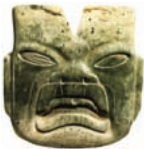
تصویر ۱- چهره انسان، اولمک

اولمک‌ها در جنوب شرق مکزیک زندگی می‌کردند و نخستین اقوامی بودند که در حدود ۱۲۰۰ پیش از میلاد وارد تمدن شهری شدند و در ۴۰۰ میلادی به پایان کار خود رسیدند. آن‌ها آثاری با مشخصات پیشاکلمبی آفریدند. به همین علت، ایشان را حاملان «فرهنگ مادر» آن منطقه نامیده‌اند. اولمک‌ها در ساخت بناهای مذهبی و پیکره‌های بزرگ یادمانی به‌ویژه سردیس‌ها توانا بودند (تصویر ۱). از آثار مکشوف در زیستگاه‌های مختلف آن‌ها چنین استنباط می‌شود که اولمک‌ها در دانش نجوم بسیار پیشرفته و تقویم‌های دقیقی داشته‌اند.