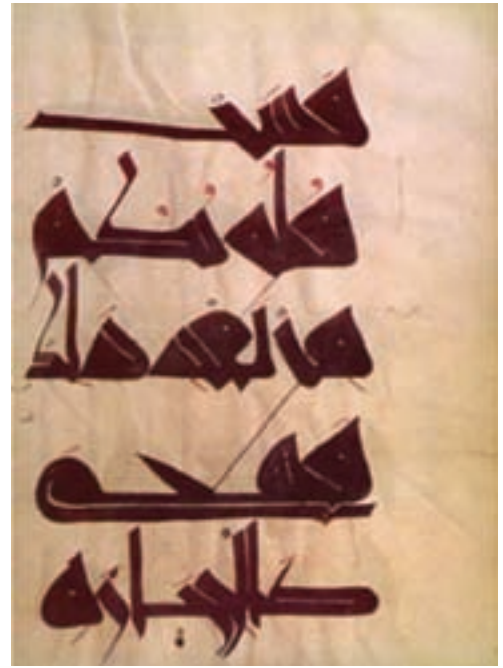
تصویر ۱۱- یک صفحه قرآن به خط کوفی مغربی (مراکشی)، روی پوست، سوره بقره، آیه ۷۴، خط علی بن وزاق در ۴۱۰ هجری، موزه قیروان، تونس