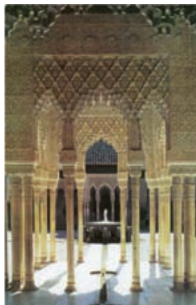
تصویر ۵- حیاط شیران، کاخ الحمرا، گرانادا، اسپانیا، ۱۳۷۷ میلادی

در سال ۸۰ هجری مسلمانان شمال آفریقا به رهبری فردی از خاندان اموی وارد اسپانیا شدند و تا سده هشتم هجری بر بخش بزرگی از این سرزمین حکومت کردند و بر افتخارات هنر اسلامی افزودند و علم و هنر اسلامی را در اروپای قرون وسطی رواج دادند. مسجد جامع قرطبه و کاخ الحمرا یادگار باشکوه آن‌ها است (تصویر ۵). در اوایل سده نهم هجری بابر از نوادگان تیمور که در دوره تیموری در ایران