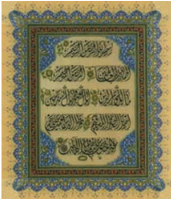
تصویر ۱۴- سوره فاتحه، خط دیوانی، عثمانی، موزه توپ کاپی