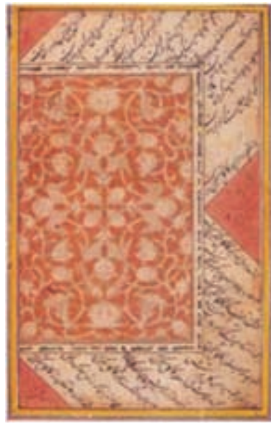
تصویر ۱۵- صفحه آرابی کتاب، یزد، ۸۳۵ هجری