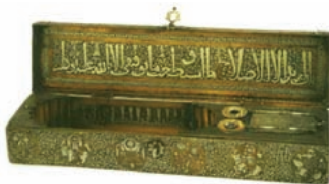
تصویر ۳۰ - قلمدان برنجی، ساخت موصل، سده هفتم هجری. موزه ارمیتاژ