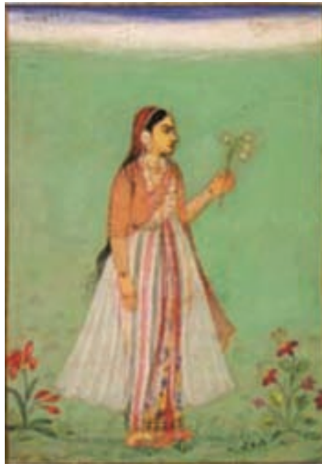
تصویر ۲۵- مکتب مغولی هند، دختری با شاخه گل، از یک مرقع، اندازه ۱۴/۴ در ۹/۷ سانتی متر، ۱۰۴۰ هجری، مجموعه خلیلی، لندن