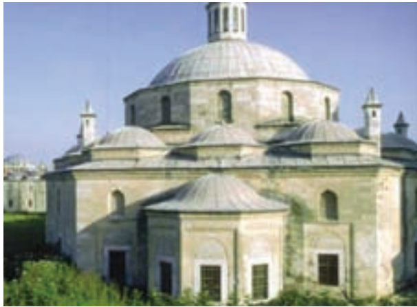
تصویر ۹- مدرسه سلطان بایزید دوم، سده ۹ هجری، آدرنه، ترکیه

در ایران به دلیل سنت‌های معماری ایران پیش از اسلام و شرایط اقلیمی، شبستان‌ها گنبددار شدند و علاوه بر رواق‌ها در پیرامون حیاط، چهار ایوان بزرگ نیز در چهار سمت حیاط ایجاد شد. اینگونه مساجد به مساجد چهار ایوانی شهرت دارند. زیبایی مساجد اغلب در تزئینات آن جلوه گر شده است. خوشنویسی، کاشیکاری، آجرکاری و گچبری با نقش مایه‌های گیاهی و هندسی از مهمترین آرایه‌های مساجد هستند. دومین گروه از بناهای اسلامی مقابر هستند که برای بزرگان دین، علم و سیاست ساخته شده‌اند که اغلب گنبددار و از نظر تزئینات بسیار غنی هستند. طرح مدارس همانند مساجد هستند، اما اغلب آن‌ها فاقد گنبد و شبستان هستند. سایر بناها تابع شرایط اقلیمی، سنت‌های قومی و محلی هستند.