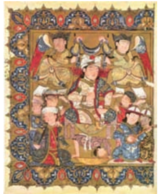
تصویر ۱۷- نقاشی عرب، مقامات حریری، احتمالاً مصر، ۱۹۲ در ۱۷۵ میلی‌متر، ۷۳۴ هجری