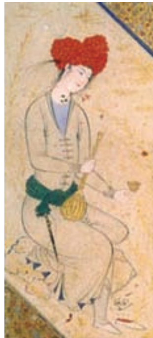
تصویر ۲۴- مکتب اصفهان، یک قطعه نقاشی، جوان نشسته، اثر آقا رضا

در اواخر دوره صفوی، محمد زمان با الهام از آثار اروپایی نقاشی سه بعدی را تجربه کرد و آثاری را به شیوه اروپایی آفرید. در دوره زندیه، در شیراز نقاشی گل و مرغ رونق یافت و کم کم نقاشی