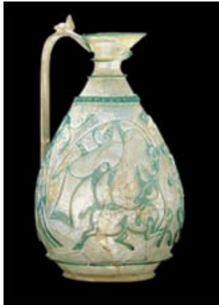
تصویر ۳۲- تنگ شیشه‌ای، ایران، نیشابور، سده ۶ هجری