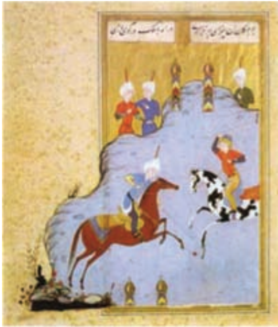
تصویر ۲۲- بازی گوی و چوگان، مکتب تبریز، کتاب گوی و چوگان، منسوب به مظفر علی، اوایل سده دهم هجری

به مکتب هرات است. پیکرهای انسانی با قامت‌های رعنا، زیبا و پوشاک فاخر ظاهر می‌شوند و حتی در جزئیات نقوش پارچه‌ها دقت می‌شود. تنوع رنگ‌ها و ریزه‌کاری آن‌ها قابل توجه هستند. از دیگر ویژگی‌های نقاشی‌های این مکتب تغییری است که در شکل عمامه‌های افراد دیده می‌شود. عمامه‌ها به دور کلاه‌ی پیچیده شده و از بالای آن میله قرمز رنگی بیرون آمده است (تصویر ۲۲).