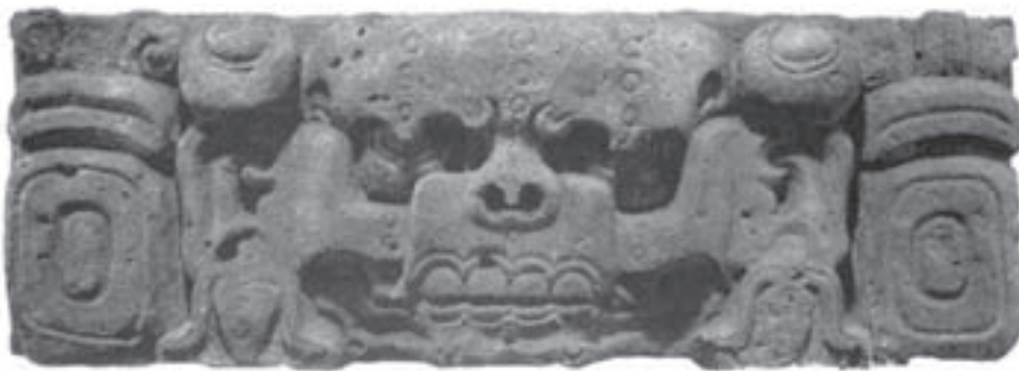
تصویر ۲- سرخدای مرگ، بخشی از سنگ محراب، کویان، هندوراس، حدود سال‌های ۵۰۰ تا ۶۰۰ میلادی، ۳۷ در ۱۰۴ سانتی‌متر، موزه مردم‌شناسی، لندن

صورت‌های شبه انسان و حیوان و شکل مکعب گونه آن‌ها است. معمولاً پیکره‌ها با لباس مذهبی یا آئینی در میان علائم یا حروف رمزی نمایش داده می‌شوند (تصویر ۲). در حدود ۹۰۰ میلادی بسیاری از شهرهای مایا متروک شد و آن‌ها به همراه قوم تولتک پایتخت خود را به یوکاتان ۱ (شرق مکزیک) انتقال دادند و در این محل سنت‌های هنری آن‌ها درهم آمیخت و در حدود سده ۱۱ میلادی، معبد بزرگ هرمی شکلی را در چیچن ایتسا برپا کردند که امروزه جزء یکی از عجایب هفتگانه جهان است (تصویر ۳).