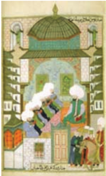
تصویر ۲۶- مکتب عثمانی، اثر محمد امیر شاه، کلاس درس در مدرسه غضنفر آقا در استانبول، سده یازدهم هجری

رنگ و روغن مورد توجه قرار گرفت. دوره قاجار نقطه عطفی در تاریخ نقاشی ایران است و نقاشی اروپایی مورد اقبال بیشتری قرار گرفت نقاشی به سمت شیوه طبیعت گرایی و واقع گرایی حرکت کرد. در دوره عثمانی و مغولان هند مصور سازی کتاب به تقلید کتاب های مصور ایرانی مورد توجه قرار گرفت و آثار با ارزشی در زمینه های مختلف مصور شد. هنرمندان دوره صفوی در شکل گیری مکتب نگارگری عثمانی و مغولی هند، نقش مهمی داشتند (تصاویر ۲۵ و ۲۶).