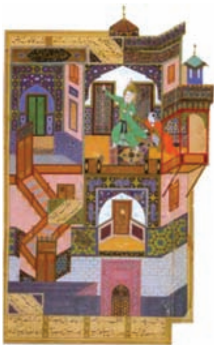
تصویر ۲۱- فرار یوسف از نزد زلیخا، مکتب هرات، بوستان سعدی، اثر بهزاد، سده ۹ هجری

از ویژگی های نگارگری مکتب هرات، دقت در نمایش جزئیات، تقارن عناصر، هماهنگی خط و نقاشی، استخوان بندی محکم، استفاده علمی از رنگ، نظیر رنگ آبی برای آسمان و قرمز و نارنجی برای زمینه، استفاده از عناصر معماری، تنوع در طراحی و شکل پیکرها، طبیعت گرایی در طراحی حیوانات و درختان و توجه به زندگی روزمره مردم است. از آثار مهم این مکتب، نگاره های کلیله و دمنه و بوستان سعدی است (تصاویر ۲۰ و ۲۱).