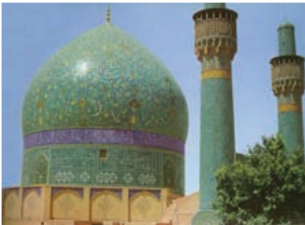
تصویر ۴- مسجد امام، دوره صفوی، اصفهان

در نظام فکری مسلمانان، همه دست ساخته‌ها و مشاغل، شکلی از هنر هستند و به‌ساخته‌ای خاص و یا به‌کار مشخصی هنر گفته نمی‌شود. در نگاه اسلام زیبایی تجلی حقیقت کلی و جهانی است و هر دست ساخته‌ای به‌میزانی که صفتی از صفات الهی را آشکار سازد، از کمال و زیبایی برخوردار می‌شود. از دیگر ویژگی‌های هنر اسلامی مردم‌واری، خودبسندگی، پرهیز از بیهودگی، تقارن، استفاده گسترده از نقوش هندسی و گیاهی در تزیینات، پرهیز از طبیعت‌پردازی و واقع‌گرایی است.