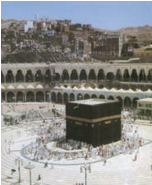
تصویر ۲- خانه خدا (کعبه)، قبله‌گاه مسلمین جهان، مکه معظمه

هنر اسلامی پدیده‌ای است که از بطن اسلام متولد شده و تنها با درک دیانت اسلام قابل شناخت است. هنر اسلامی هنری مذهبی و در خدمت نیازهای جامعه و چشم‌گیرترین جلوه آن هماهنگی اجزای سازنده آن در جزء و کل است. هنر اسلامی با تمام قلمرو وسیع خود پیوسته با روح اسلام سازگاری داشته و بیش از همه در معماری مکان‌های مقدس جلوه‌گر شده است (تصاویر ۲-۴).