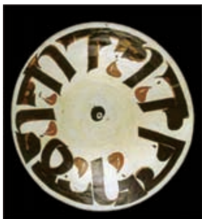
تصویر ۲۸ - بشقاب سفالی، نقش پرند (راست) خط نوشته کوفی (چپ) ایران، نیشاپور، سده ۳ یا ۴ هجری