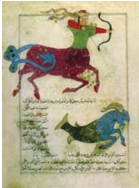
تصویر ۱۸- صورت فلکی قنطورس، کتاب عجایب المخلوقات قزوینی، مکتب بغداد، سده هشتم هجری

کتاب‌های علمی در پایتخت‌های جهان اسلام (قاهره، بغداد، دمشق، تبریز، شیراز، هرات و ...) است. از آثار با ارزش این دوره کتاب‌های منافع الحيوان، عجایب المخلوقات و ماتریا مدیکا (مواد طبی) است (تصاویر ۱۷ و ۱۸).