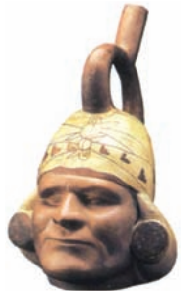
تصویر ۴- ظرف سفالی به شکل مرد تک چشم، پرو، حدود سال‌های ۲۵۰ تا ۵۵۰ میلادی، ارتفاع ۲۹ سانتی‌متر، موزه هنر نیپاگو

همزمان با تمدن مایا، در شمال شهر مکزیکو، تمدن دیگری به نام تئوتی و آکان شکل گرفت. هنر این قوم در سایه رهبری روحانیان، محتوایی شدیداً مذهبی داشت. سازندگان معابد مردمی کشاورز بودند که سبک هنری مشخصی در نخستین سده‌های عصر مسیحیت آفریدند. اینان خدایانی که مظاهر طبیعت بودند، را می‌پرستیدند و پیکره‌های ریزنقش بیشماری با چهره انسانی از آن‌ها می‌ساختند (تصویر ۴).