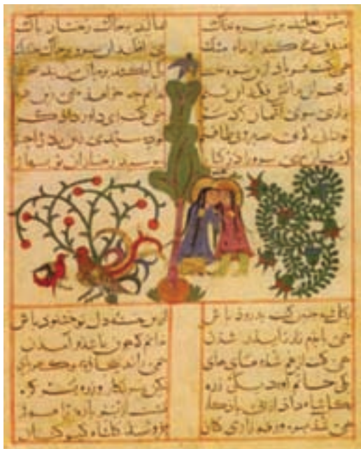
تصویر ۱۹- منظومه ورقه و گلشاه، مکتب سلجوقی، اوایل سده هفتم هجری، موزه توپ‌کاپی، استانبول

از اواخر دوره سلجوقی به بعد، تصویر سازی کتاب (نگارگری) در ایران مورد اقبال بیشتری قرار گرفت. ادبیات ایران به دلیل جذابیت‌های داستانی، نقش مهمی در رواج نگارگری داشت و کم‌کم مصور سازی کتاب‌های ادبی مورد توجه قرار گرفت. کتاب‌های شاهنامه فردوسی، پنج گنج نظامی، بوستان و گلستان سعدی، کلیله و دمنه و بعضی از کتاب‌های تاریخی، علمی و مذهبی به زمینه هنر نمایی نگارگران تبدیل شد و در پی این علاقمندی مکاتب نگارگری سلجوقی، ایلخانی (مکتب اول تبریز و شیراز)، تیموری (هرات، شیراز)، صفوی (مکتب دوم تبریز، قزوین، اصفهان) و زند و قاجار به وجود آمد. نگاره‌های عهد سلجوقی کوچک اندازه و تزئینی بودند و در وسط صفحه‌ها نقش می‌شدند (تصویر ۱۹).