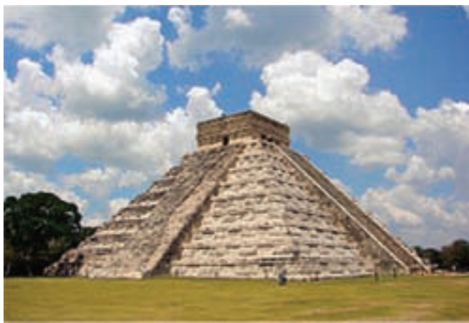
تصویر ۳- معبد چیچن ایتسا، یوکاتان، سده ۱۱ میلادی

صورت‌های شبه انسان و حیوان و شکل مکعب گونه آن‌ها است. معمولاً پیکره‌ها با لباس مذهبی یا آئینی در میان علائم یا حروف رمزی نمایش داده می‌شوند (تصویر ۲). در حدود ۹۰۰ میلادی بسیاری از شهرهای مایا متروک شد و آن‌ها به همراه قوم تولتک پایتخت خود را به یوکاتان ۱ (شرق مکزیک) انتقال دادند و در این محل سنت‌های هنری آن‌ها درهم آمیخت و در حدود سده ۱۱ میلادی، معبد بزرگ هرمی شکلی را در چیچن ایتسا برپا کردند که امروزه جزء یکی از عجایب هفتگانه جهان است (تصویر ۳).