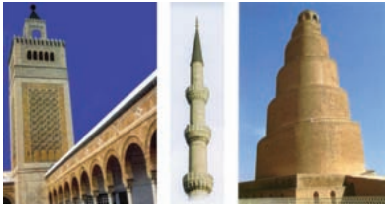
تصویر ۸- سمت راست منار مسجد سامرا، سال ۲۳۸-۲۳۴ هجری، عراق. میانی، مناره در مساجد عثمانی. سمت چپ، مناره مسجد زیتونیه، ۷۳۲ هجری، در تونس