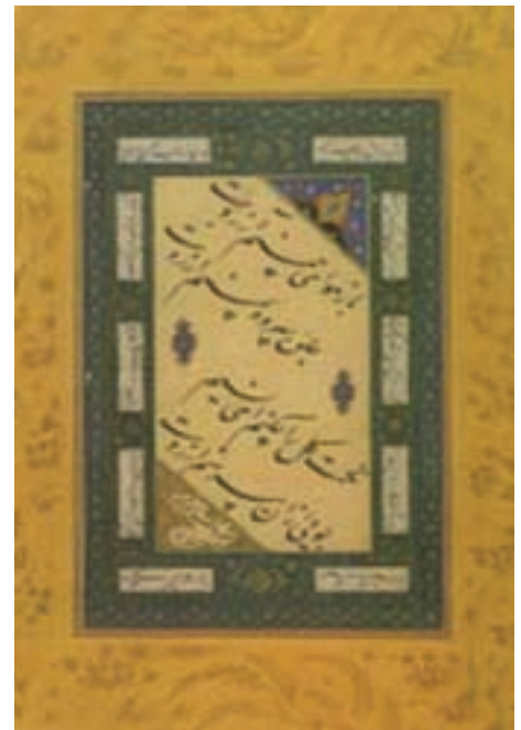
تصویر ۱۳- یک قطعه خط نستعلیق، خط مالک دیلمی، دوره صفوی