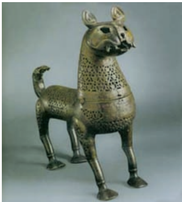
تصویر ۳۱ - بخور سوز مفرغی، ایران. سده پنجم هجری، موزه ارمیتاژ

تولید اشیای فلزی در اغلب شهرهای جهان اسلام رواج داشت. دست آفریده‌های فلزی شهرهای ایران، مصر، سوریه و ترکیه از شهرت زیادی برخوردار هستند. هنرمندان مسلمان توجه خاصی به تنوع شکل و تزئین اشیاء داشتند. در میان اشیای فلزی، ساخت ظروف و لوازم خانگی از جایگاه ویژه‌ای برخوردار بودند. به دلیل تحریم استفاده از طلا و نقره، آثار فلزی اغلب با مفرغ، برنج و مس ساخته می‌شدند. زیبایی اشیای فلزی تنها در تنوع شکل آن‌ها نیست بلکه تزئینات آن‌ها چشمگیر است. فلزکاران انواع نقش‌های هندسی، گیاهی، برج‌های دوازده‌گانه، صحنه‌های رزم، بزم و شکار را به روش قلمزنی ایجاد می‌کردند. علاوه بر این گاهی با نوشته، سیاه قلمکاری، میناکاری، ترصیع و زراندود زیبایی آن‌ها را صد چندان می‌کردند (تصاویر ۳۰ و ۳۱).