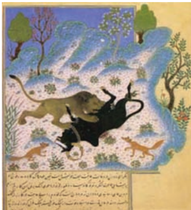
تصویر ۲۰- کلیله و دمنه، مکتب هرات، سده نهم هجری، موزه توپکاپی، استانبول

شاه اسماعیل صفوی تبریز را به پایتختی ایران، انتخاب و نقاشان مکتب هرات از جمله بهزاد را به تبریز دعوت کرد. با این اقدام سبک جدیدی در نگارگری ایران شکل گرفت و هنر نگارگری ایران در زمان حکومت شاه طهماسب به بالاترین درجه ترقی خود رسید. مکتب تبریز ادامه و تداوم سبک هرات است اما در آن نوآوری و همخوانی با فرهنگ و سنت های ایرانی بیشتر دیده می شود و تأکید بر مصور سازی شاهکارهای ادب فارسی دارد. نقاشی های این مکتب دارای ترکیب بندی آزادتر نسبت