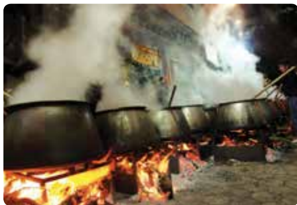
شکل ۳-۹- حسینیه جویستان - محل برگزاری تعزیه در طالقان