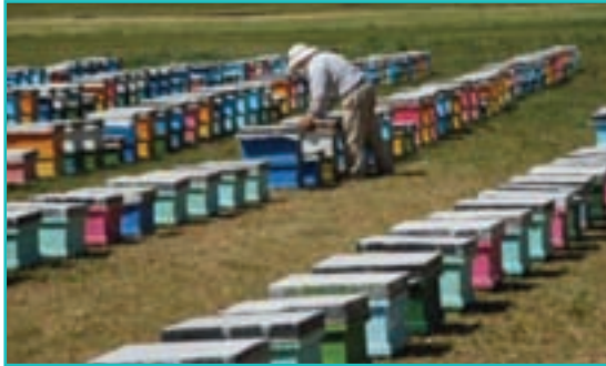
شکل ۴۶-۵- پرورش زنبورعسل