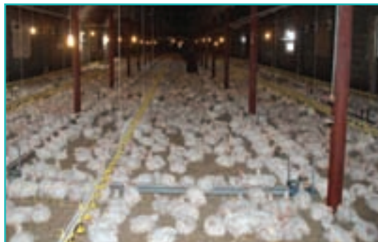
شکل ۴۸-۵- مرغداری صنعتی