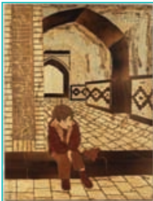
شکل ۶۱-۵- معرق چوب

۴- معرق چوب : این هنر ۴۰ سال پیش به شهرستان ارومیه راه پیدا کرد و با منبت تلفیق شد و رشته جدیدی به نام معرق - منبت یا معرق برجسته بوجود آمد.