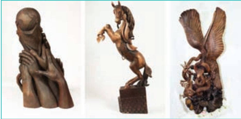
شکل ۶۰-۵- بیکره تراشی

۳- بیکره تراشی : این هنر به طور گسترده در شهرستان ارومیه کار می‌شود. ماده اصلی بیکره‌ها چوب گردو است.