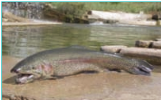
شکل ۴۹-۵- پرورش ماهی