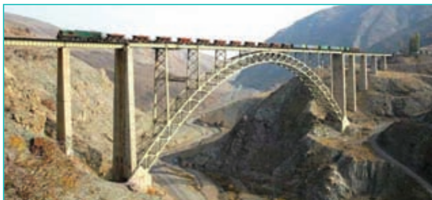
شکل ۶۴-۵- پل هوایی قطور- خوی