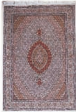
نام طرح: ماهی نام نقشه: شکارگاه ابعاد: ۱.۵×۲ ۲×۳ ۱×۱.۵ ۲.۵×۳.۵ ۲.۵×۵ ۶×۴ بافت: ارومیه - خوی - سلماس - ماکو - جالدران - بلدشت