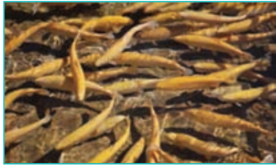
شکل ۴۵-۵- پرورش ماهی