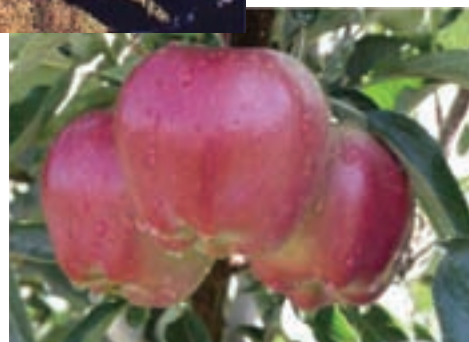
شکل ۴۱-۵- توانمندی‌های کشاورزی استان