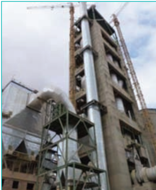
شکل ۵۱-۵- کارخانه سیمان

صنایع تولید مواد غذایی و آشامیدنی پس از صنایع فرآوری و تبدیلی معدنی دومین تخصص صنعتی استان در سال ۱۳۸۵ بود و ۲۱/۶ درصد از کل صنایع استان را شامل می‌شد.