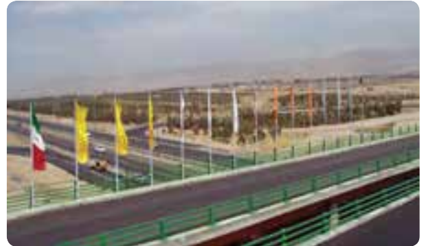
شکل ۷-۱۴- راه‌های استان