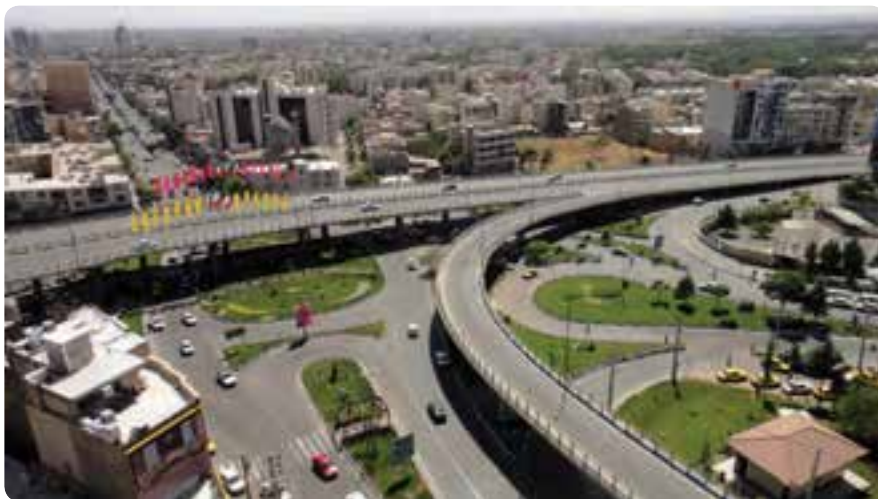
شکل ۴-۱۴- بل‌های روگذر آزادگان نمونه‌ای از فعالیت‌های عمرانی استان

فعالیت‌های عمرانی استان به سه بخش تقسیم می‌شوند: ۱- عمران شهری ۲- عمران روستایی ۳- راه و ترابری و حمل و نقل. ۱- عمران شهری: فعالیت‌ها و دستاوردهای عمرانی بسیاری (در زمینه تهیه طرح‌های تفضیلی و هادی، خدمات شهری، افزایش و اصلاح راه‌های ارتباط درون شهری و سایر تأسیسات زیربنایی) موجب پیشرفت و توسعه شهرهای استان شده است.