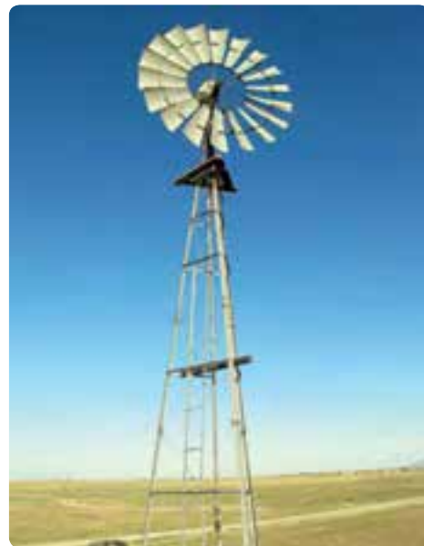
شکل ۱۸-۱۴ استفاده از انرژی‌های نو