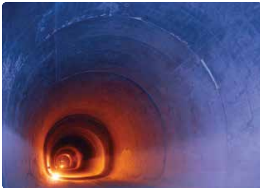
شکل ۲-۱۵ - توسعه مترو راه حلی برای ترافیک و حمل و نقل عمومی

برای کنترل و ساماندهی مهاجرت به استان و افزایش اشتغال، چه اقداماتی می‌توان انجام داد؟