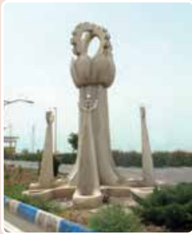
شکل ۳-۱۴- ورودی شهرک صنعتی اشتهارد

شهرک صنعتی اشتهارد: این شهرک به علت دسترسی به راه‌های ارتباطی و زمین‌های بایر و وسیع در مسیر جاده اشتهارد- بومین زهرا مکان‌یابی شد و در حال حاضر با داشتن ۵۲۵ واحد صنعتی فعال (فلزی - غذایی - شیمیایی و...) از اصلی‌ترین مناطق صنعتی کشور محسوب می‌شود.