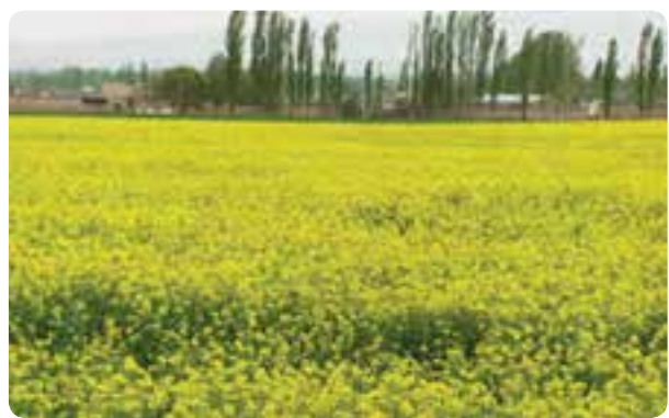
شکل ۱۴-۱- تغییر شیوه‌های سنتی و تبدیل آن به کشت‌های جدید