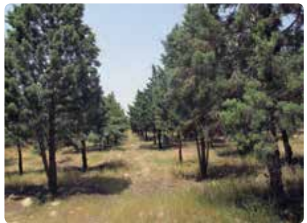
شکل ۱۹-۱۴ مهار آب‌های سطحی و جنگل‌های دست کاشت