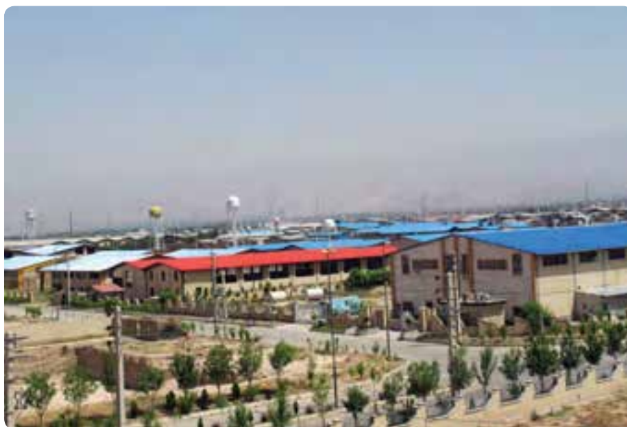
شکل ۲-۱۴- شهر صنعتی نظرآباد

در سال‌های اخیر به دنبال ممنوعیت تأسیس کارگاه‌های صنعتی در تهران، بخش‌هایی از استان برای احداث شهرک‌های صنعتی مورد توجه قرار گرفت که بسیاری از آن‌ها به مرحله بهره‌برداری رسیده است و تعدادی دیگر در حال تکمیل است. اشتغال‌زایی و افزایش تولیدات داخلی از نتایج ایجاد این شهرک‌های صنعتی می‌باشد.