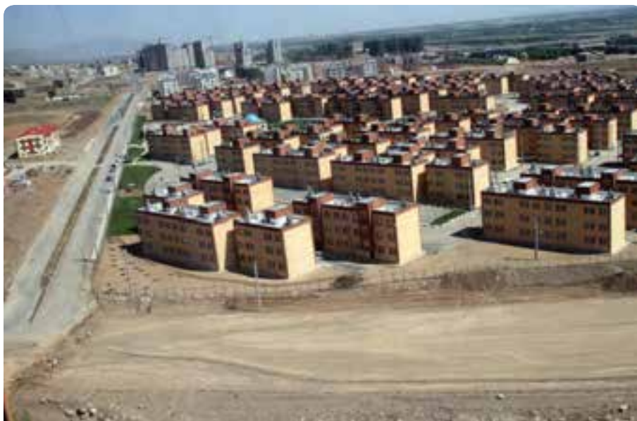
شکل ۱- ۱۵- مسکن مهر