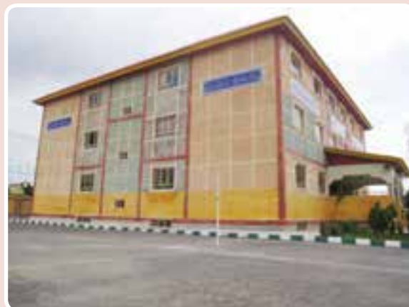
شکل ۱۲-۱۴- مدارس

جدول ۱۳-۱۴- تعداد دانش‌آموزان و کارکنان آموزشی کلیه مقاطع تحصیلی ۸۸-۱۳۸۷