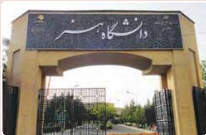
شکل ۱۴-۱۴- دانشگاه هنر - کرج