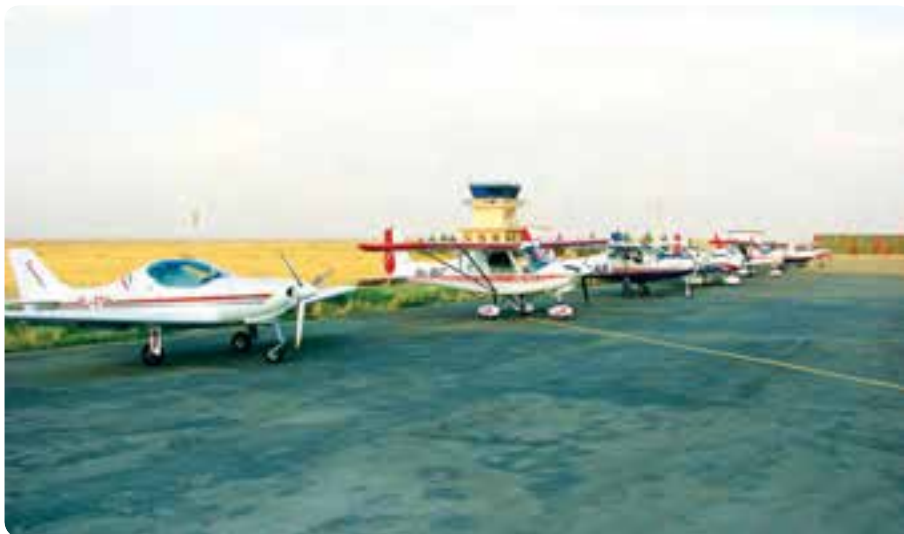
شکل ۱۱-۱۴- فرودگاه آزادی - نظرآباد

✳️ فرودگاه آزادی: این مجتمع فرودگاهی سال ۱۳۷۹ در شرق روستای صالحیه شهرستان نظرآباد افتتاح شد. مهم‌ترین اهداف احداث این فرودگاه تربیت نیروی انسانی در زمینه طراحی و ساخت هواپیماهای کوچک و آموزش هوانوردی است.