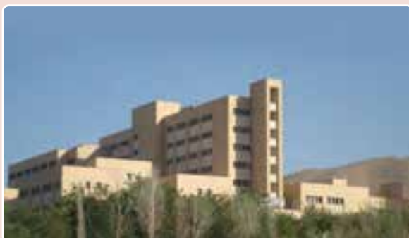
شکل ۱۶-۱۴- بیمارستان تخصصی البرز