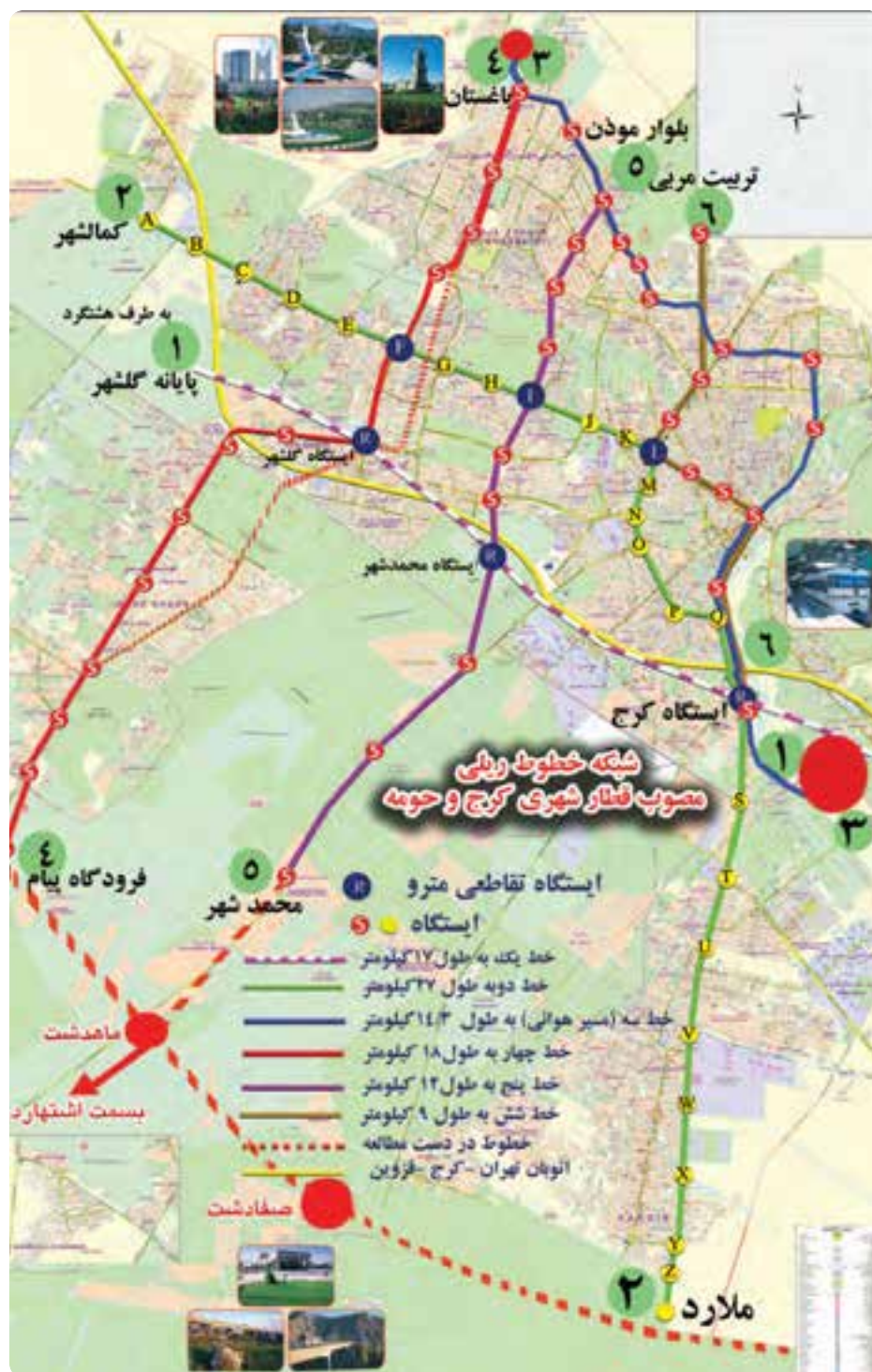
شکل ۹-۱۴ نقشه خطوط مترو کرج و حومه