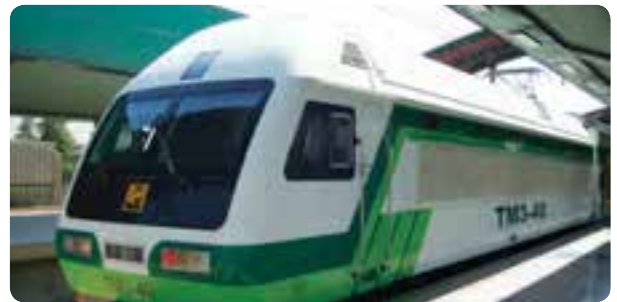
شکل ۸-۱۴- نمونه‌هایی از فعالیت‌های ساخت و ساز در مترو