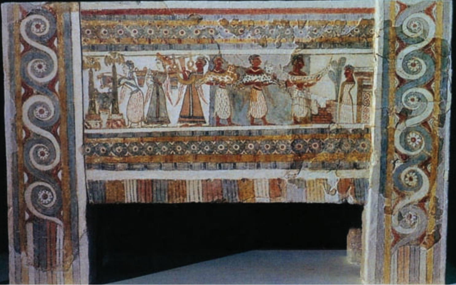
۱-۵. گور سنگی، کرت، یونان، حدود ۱۴۰۰-۱۴۵۰ ق.م، سنگ آهک نقاشی شده