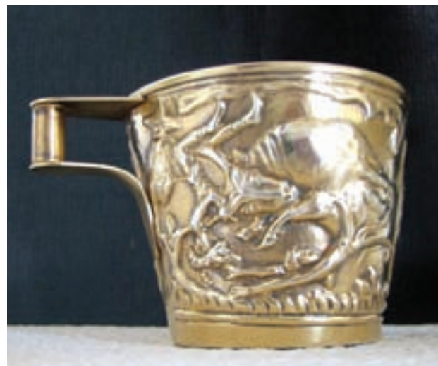
۱۱-۱. جام واقیو، میسن، یونان، حدود ۱۵۰۰ ق. م، طلا با نقوش برجسته