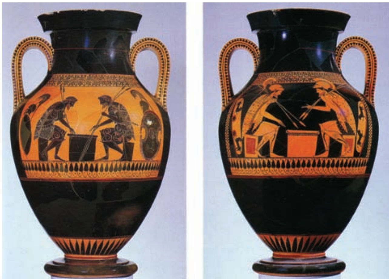
۱۶-۱. دو ظرف نقاشی شده سرخگون و سیاهگون ، آندوکیدس ، اورویتو ، ایتالیا ، حدود ۵۲۰ - ۵۲۵ ق . م

(بدنه کوزه) نقوش هندسی متشکل از خطوط وسطوح راست ، مورب و منحنی دیده می شوند. گرچه مبانی هندسی نقشها کاملاً آشکار است لیکن آزادی ، نوآوری و ایجاد تضاد میان سطوح تیره و روشن ، خطوط مستقیم و نقوش موج ، حرکت‌های افقی و عمودی همگی به کمک هم طرحی را پدید آورده‌اند که درعین هندسی بودن از یک نواختی دور است و جذابیت بصری دارد . اگر به طیف آثار متنوع در شکلها و طرحهای مختلف نظر کنیم به سبکهای فردی بر می‌خوریم، که ناشی از اهمیت " فرد " در تمدن یونان است . در هیچ تمدن دیگری این چنین تأکید جدی بر " فردیت هنرمند " دیده نمی‌شود. فردیت به حدی در تمدن یونانی اهمیت داشته که ما امضای هنرمندان را نه تنها در زیر مجسمه ها و آثار معماری ، بلکه بر روی کوزه‌ها، گلدانها و دیگر ظروف سفالین هم می‌بینیم.