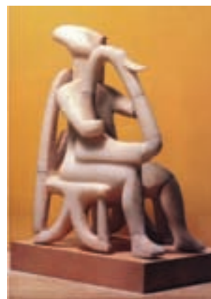
۱-۲. نوازنده چنگ، کروس (سیکلادی)، یونان (دریای اژه)، حدود ۲۵۰۰ - ۲۷۰۰ ق.م

دوره مینوسی میانه با ایجاد کاخهای کهن در حدود ۲۰۰۰ ق.م شناخته می شود که ظاهراً بر اثر زلزله از بین رفته اند. این کاخها ویژه پادشاهان بدون توجه به مقابر یا دژ ساخته شده و شهرهای پادشاهی گرداگرد آنها ساخته می شدند. از پیشرفت های فنی در این دوره تحول سفالگری در منطقه و کاربرد چرخ سفالگری است. این سفالینه ها با سبکی تزیینی و چند رنگ ساخته می شوند که بازتاب زندگی طبیعی آنان بوده که نقش عمده آنها طرح جانوارن دریایی است (شکل ۱-۳).