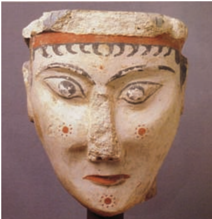
۱-۷. سردیس بت (ابوالهول)، میسن، یونان، حدود ۱۲۵۰-۱۳۰۰ ق.م، گچ نقاشی شده