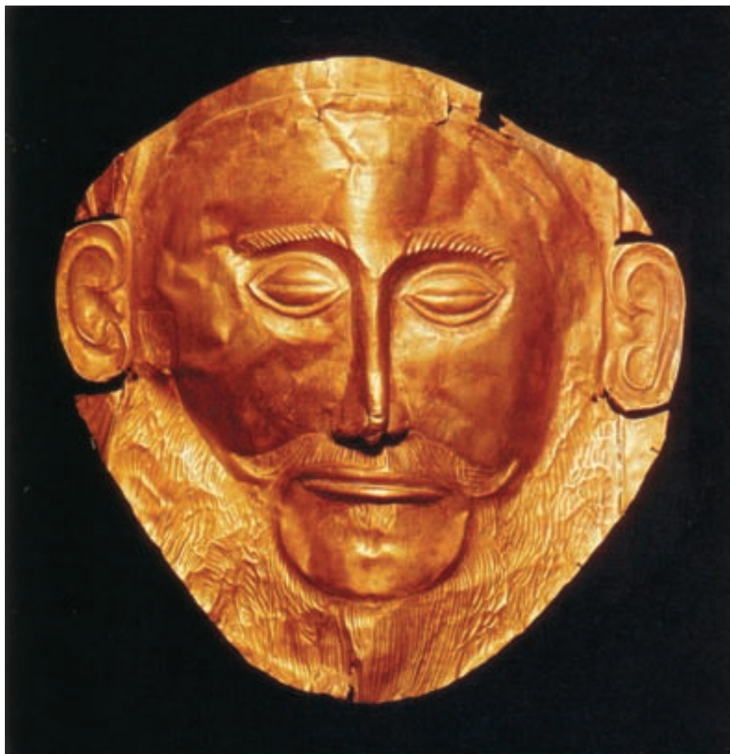
۱-۱۰. نقاب متوفی، میسن، یونان، حدود ۱۵۰۰-۱۶۰۰ ق.م، طلا

اما سرانجام در سال ۱۲۰۰ ق.م تمدن میسنی به دست دوری‌ها (دوریسی‌ها) که دارای سلاحهای آهنی بودند سقوط کرد و دوران "عصر ظلمت" چند صد ساله‌ای در پی انهدام فرهنگ اژه‌ای آغاز شد.