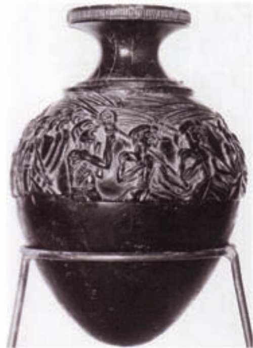
۱-۶. کوزه نقش برجسته، کرت، یونان، حدود ۱۵۰۰ ق.م