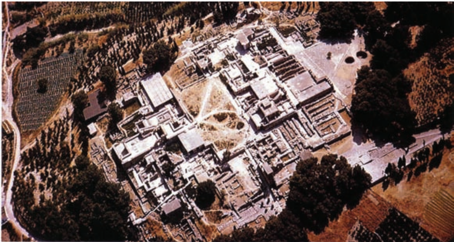
۱-۴. چشم انداز هوایی کاخ کنوسوس (کرت)، یونان، حدود ۱۴۰۰-۱۷۰۰ ق.م

در این کاخ نیز شاهد نقاشی های دیواری زیبایی بر زمینه گچی با موضوعاتی از زندگی روزمره کرتی (مسابقات گاو بازی، مراسم مذهبی و...) مظاهر طبیعت (پرندگان، چهارپایان، گلها) و جلوه های دریایی (دلفینها و جانداران دریایی و...) به تصویر کشیده شده اند (شکل ۵-۱). در این دوره هنر سفالگری نیز تحول یافت و با موضوعات سرزنده طبیعت همانند نقاشیهای دیواری تولید می شدند (شکل ۶-۱). از نمونه های بارز پیکر تراشی وجود پیکره های کوچک و سردیس هایی است که به نظر می رسد بازتاب عدم دین نظام مند و رسمی در منطقه باشد به چشم می خورد (شکل ۷-۱).