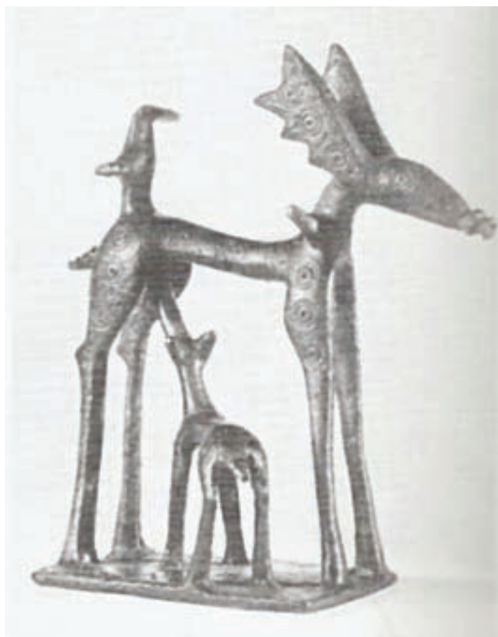
۱-۱۴ . پیکره مفرغی با طرح جانوری ، یونان ، حدود سده ۹ یا ۸ ق . م

در اینجا لازم است بدانیم که اکثر کوزه های بزرگ از این گونه ، کاربرد مذهبی داشته و در مراسم تدفین بکار می رفته است . کف کوزه در ناحیه پایه دارای سوراخهای متعددی است و در این ظروف روغن یا شربت می ریختند و آن را بر روی قبر متوفی قرار می دادند تا درجهان مرگ از آن تغذیه کند . منطقه آتیکا ۱۰ به لحاظ ساخت بهترین کوزه ها و زیبا ترین نقوش شهرت دارد . از نمونه های تندیس سازی این دوران وجود تندیسهای کوچک و غالباً از جنس مفرغ و گل هستند که جانورانی همچون گاو ، اسب و انسان را به صورتهای نمادین و اسطوره ای مجسم کرده اند . این آثار به معابد ، پرستشگاهها و گورستانها پیش کش می شدند (شکل ۱۴-۱).