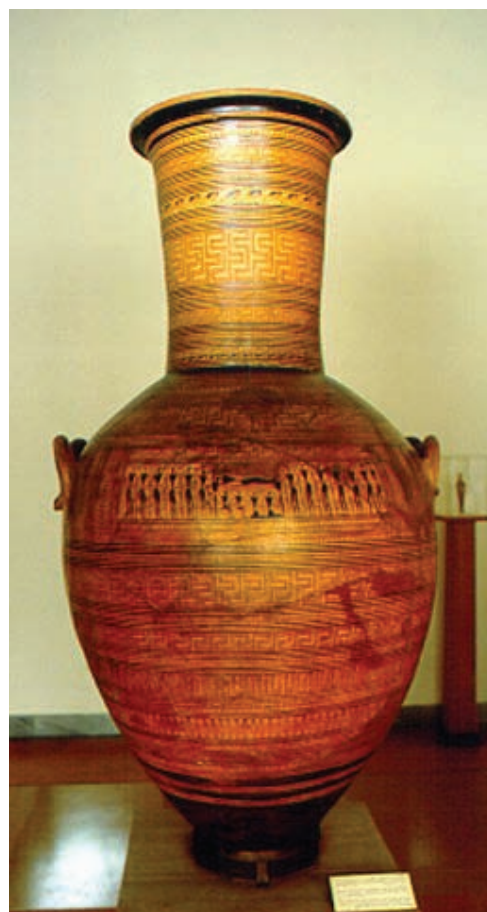
۱-۱۳ . کوزه دیپلون ، آتن ، یونان ، ۷۵۰ ق . م