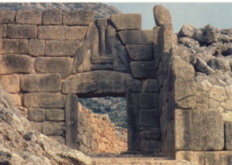
۹-۱ دروازه شیران، میسن، یونان، حدود ۱۲۵۰-۱۳۰۰ ق.م