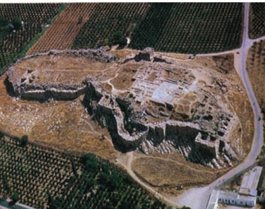
۸-۱ چشم انداز هوایی دژ تیرینس، یونان، حدود ۱۲۰۰-۱۴۰۰ ق.م

سرچشمه هنر میسنی احتمالاً با مهاجرت اقوام اولیه یونانی در اوایل هزاره دوم ق.م در جزایر اژه و مدیترانه و همزمان با تمدن جزیره کرت باشد. این تمدن به تمدن سرشار از طلا به نقل هومر شهرت یافت و دلیل آنرا علاقه میسنی‌ها به طلا و وجود گنجینه‌ها می دانستند. با نابود شدن تمدن کرت، میسنی‌ها برتری یافتند اما دیری نپائید که با مهاجرت دوریسی‌ها تمدن میسنی نیز از بین رفت و این مهاجرین جدید تمدن یونان را بنا نهادند هر چند از میراث هنر کرت و میسنی نیز برخوردار بودند. تحولات این دوران را می توان در نخستین منظومه‌های حماسی اروپا یعنی ایلیاد و اودیسه اثر هومر دید. میسنی‌ها توجه خاصی به دژ و پناهگاه‌های نظامی داشتند از اینرو آثار باشکوهی را ساختند که می توان به دژ میسنی (شکل ۸-۱) اشاره کرد که به ارک تیرینس شهرت دارد. این کاخ و دژ برخلاف کاخ کرت بر مبنای نقشه حساب شده‌ای ساخته شده است. از مشهورترین نمونه‌های کنده‌کاری این دوران دروازه شیران (شکل ۹-۱) است. مقابر میسنی‌ها حالتی لانه زنبوری داشته که در آنها مقادیر زیادی خنجر مفرغی مرصع شده با طلا و نقره کشف شده است.