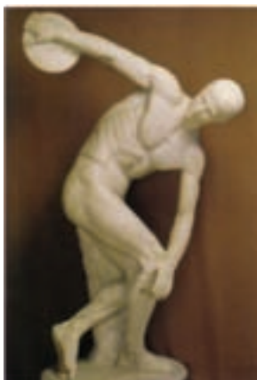
۱-۱. دیسک پرن نسخه برداری مرمین از یک اصل یونانی ۴۵۰ ق.م.موزه ترمه - رم

ظاهر آثار هنری یونان نیز، همان گونه که خواهیم دید، آشناتر، ملموس تر و قابل درک تر از آثار به جای مانده از تمدن های دیگر چون مصر، هند، شرق دور و... می نماید. لذا جا دارد از خود بپرسیم که چگونه ممکن است که درک آثار هنری یکی از تمدنهای کهن نسبت به آثار دیگر تمدنها آسان تر باشد؟! چرا برای یک ایرانی که قریب به ۸۰۰ سال تاریخ مشترک با هندوستان دارد، فهم و درک هنر اسطوره‌ای هند دشوارتر است و در عوض یک اثر یونانی مثل مجسمه دیسک پرن (شکل ۱-۱) پدیده‌ای آشناتر و قابل فهم تر می نماید؟!