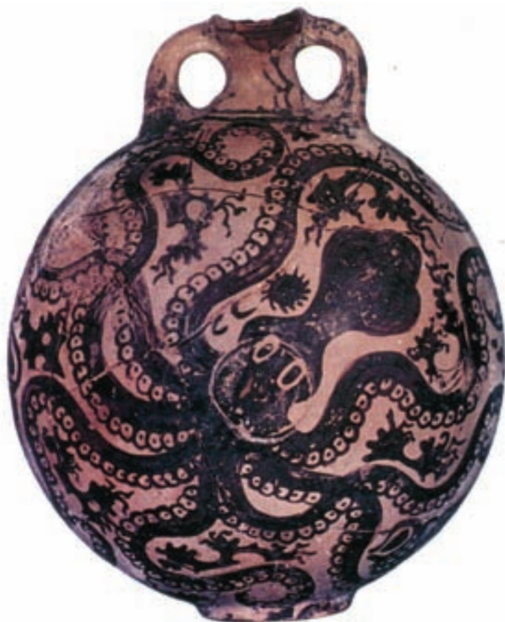
۱-۳. کوزه با طرح هشت پا، کرت، یونان، حدود ۱۵۰۰ ق.م