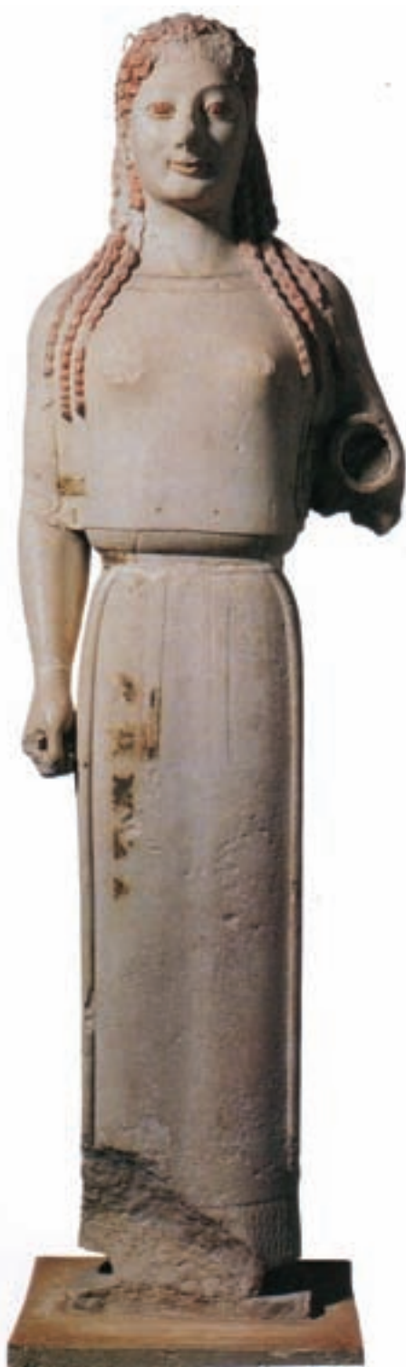
۱۵-۱ دختر جوان پهلوس، آکروپولیس، آتن، یونان، حدود ۵۳۰ ق.م

در شکل ۱۷-۱ کوزه تک دست زیبایی را که به اواخر سده هشتم یا اوایل سده هفتم قبل از میلاد مربوط است می بینیم. سر و گردن کوزه جانوری افسانه ای مرکب از شیر و عقاب ۱۱ را نشان می دهد. درگردن کوزه از عناصر تزئینی هندسی استفاده شده لیکن با خط منحنی عمودی - که حاشیه یال جانور را مشخص کرده - به پدیده ای زنده و متحرک تبدیل شده است. در بخش کره ای