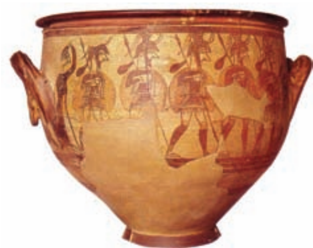
۱۲-۱. ظرف جنگاوران ، میسن ، حدود ۱۲۰۰ ق. م.