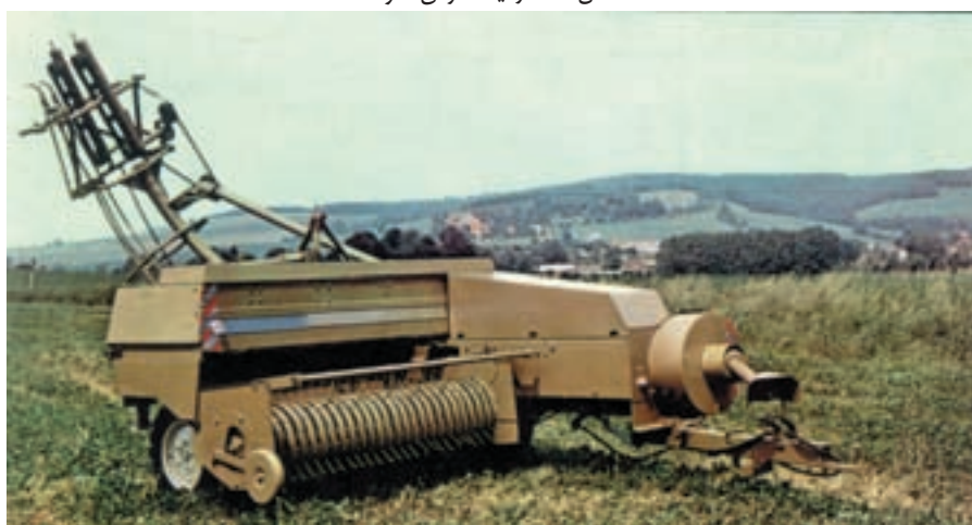
شکل ۵-۷ بسته بند