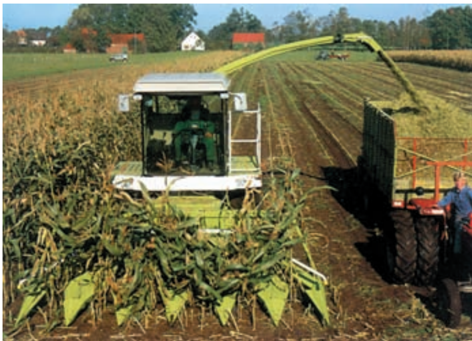
شکل ۷-۷ چارپا ذرت علوفه‌ای