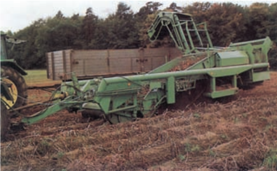
شکل ۷-۸ دستگاه برداشت سیب زمینی

کمباین سیب زمینی، دارای واحدهای عامل است که سیب زمینی‌ها را از خاک بالا آورده و آن‌ها بر روی نقاله غربالی لرزان منتقل می‌نماید تا خاکشان زدوده شود. سپس سیب زمینی‌ها درون تریلی یا مخزن کمباین ریخته می‌شود در روش نیمه مکانیزه سیب زمینی‌کننده شده توسط سیب زمینی‌کن به ردیف روی سطح زمین در مسیر حرکت تراکتور ریخته می‌شود تا با دست جمع‌آوری شوند (شکل ۷-۸).