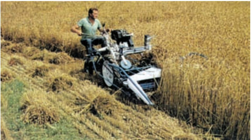
شکل ۷-۲- دروگر دسته بند ۱