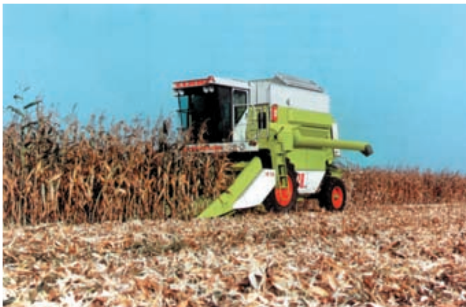
شکل ۶-۷ کمباین برداشت ذرت دانه‌ای

در صورتی که ذرت برای تولید دانه کشت شده باشد پس از خاتمه دوره رشد و نمو و زمانی که دانه‌ها سفت و رنگ برگ‌ها زرد شدند، میوه یا بلال ذرت را با ماشین بلال‌کن برداشت سپس با ماشین پوست‌گیر پوشش آن را جدا کرده آنگاه با ماشین دانه‌کن دانه‌ها را از چوب بلال جدا می‌کنند. در کمباین ذرت همه این اعمال یکجا صورت می‌گیرد. سپس دانه‌ها جهت رسیدن به رطوبت مطلوب در دستگاه‌های خشک‌کن قرار می‌گیرند.