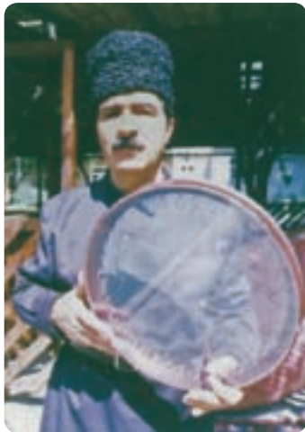
قوال در موسیقی عاشیقی

تکنیک‌های اجرایی قوال: قوال در مقایسه با سایر سازهای هم‌خانواده‌اش در نواحی ایران تکنیک‌های اجرایی متنوع و پیچیده‌تری دارد. پلنگ، اشاره، انواع ریز، استفاده از هر سه منطقه مرکزی، میانه و کناره از مهم‌ترین تکنیک‌های اجرایی دست راست هستند و استفاده از منطقه میانی و کناره، انواع ریز با همراهی دست راست، اشاره و ... از عمده‌ترین تکنیک‌های دست چپ به شمار می‌روند.