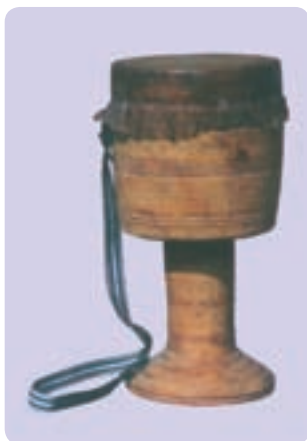
تمبک هرمزگان (میناب)

متداول در نواحی ایران یا چوبی هستند و یا فلزی. در بعضی مناطق فقط تمبک چوبی متداول است و در برخی دیگر فقط از تمبک فلزی استفاده می‌کنند. در بعضی مناطق نیز هر دو نوع متداول‌اند. تمبک‌های چوبی صرف‌نظر از اندازه آنها ویژگی‌های مشترک ساختاری با تمبک کلاسیک ایران دارند. تمبک فلزی معمولاً از ورق فلزی سیاه ساخته می‌شود و قسمت‌های مختلف آن با میخ و پَرچ به هم متصل شده‌اند. همه تمبک‌ها اعم از چوبی یا فلزی یک استوانه طینی دارند که روی دهانه آن پوست چسبانده شده است.