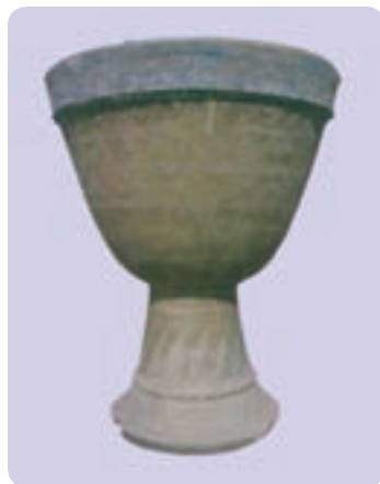
تمبک زورخانه (نمونه قدیم)