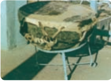
طبل تخم مرغی