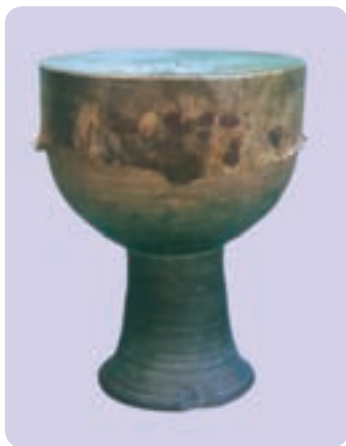
تمبک زورخانه (نمونه جدید)

زورخانه محل انجام ورزش باستانی ایران و ساختمانی سرپوشیده است که در وسط آن یک گود چندضلعی و در بالای گود سقف بلندی با نورگیر قرار دارد و در اطراف گود نیز جایگاه‌هایی برای تعویض لباس، گذاشتن اسباب‌های ورزش زورخانه، نشستن تماشاچی‌ها و سکوی سردم (محل نشستن مرشد) وجود دارد. هدایت مراسم ورزشی زورخانه امروزه برعهده فردی است که مرشد نامیده می‌شود. مرشدها ورزشکاران قدیمی هستند که از صدای خوش و ذوق موسیقی و شعر بهره‌مندند و وظیفه نواختن تمبک زورخانه، خواندن آواز و تعلیم و تربیت ورزشکاران جوان را برعهده دارند. تنها سازی که در زورخانه مورد استفاده قرار می‌گیرد - به جز زنگ - تمبک مخصوص زورخانه است. ۱ ویژگی‌های ظاهری و ساختاری تمبک زورخانه: تمبک زورخانه بزرگ‌ترین پوست صدای یک طرفه (یک طرف باز) از لحاظ اندازه در ایران است که با دست نواخته می‌شود. این ساز از جنس سفال یا بدنه‌ای یکپارچه است و پوست را با سریش بر دهانه آن می‌چسبانند. بدنه تمبک زورخانه از سه قسمت متصل به هم شامل محفظه و استوانه صوتی، گلوبی و دهانه شیپوری انتهایی تشکیل شده است. گلوبی، لوله‌ای نسبتاً استوانه‌ای است که به تدریج به سمت دهانه شیپوری گشاد می‌شود و انتهای آن به این دهانه وصل می‌شود.