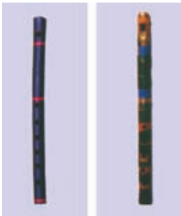
نی لبک گلستان (منطقه کنول)

نی لبک‌ها گروهی از هواصداها هستند که از گروه نی‌ها مشتق شده‌اند و در موسیقی غربی به ریکوردورها شهرت دارند. نی لبک‌ها در مقایسه با نی‌ها امکانات اجرایی محدودتری دارند اما نواختن و به‌صدا درآوردن آنها به خاطر ساختاری که دارند آسان‌تر از نی‌هاست. به همین دلیل است که جز نوازندگان حرفه‌ای، افراد دیگری نیز آنها را می‌نوازند. سازهای خانواده نی لبک در بعضی نواحی ایران متداول‌اند و با نام‌های مختلفی چون نی لبک، لبک، سیکاتک، شمشاد، توتک، سوتک، شوتک و ... شناخته می‌شوند.