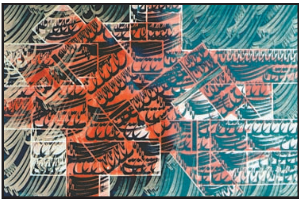
تصویر ۸-۲۶- نقاشی‌خط - ترکیب‌بندی (کشیده‌ها و گِردیها) - فرامرز پیل آرام (معاصر)