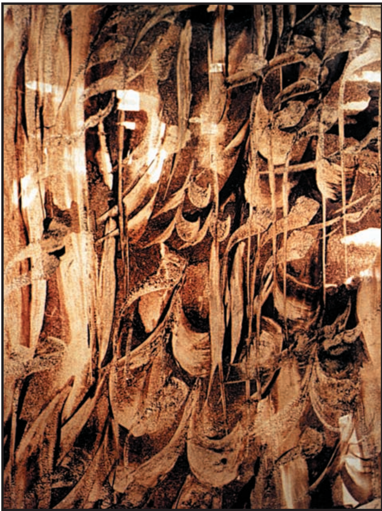
تصویر ۶-۲۴- نقاشیخظ (بخشی از اثر) اسماعیل رشوند (معاصر) - مرکب و قلم - ۴۰×۶۰cm