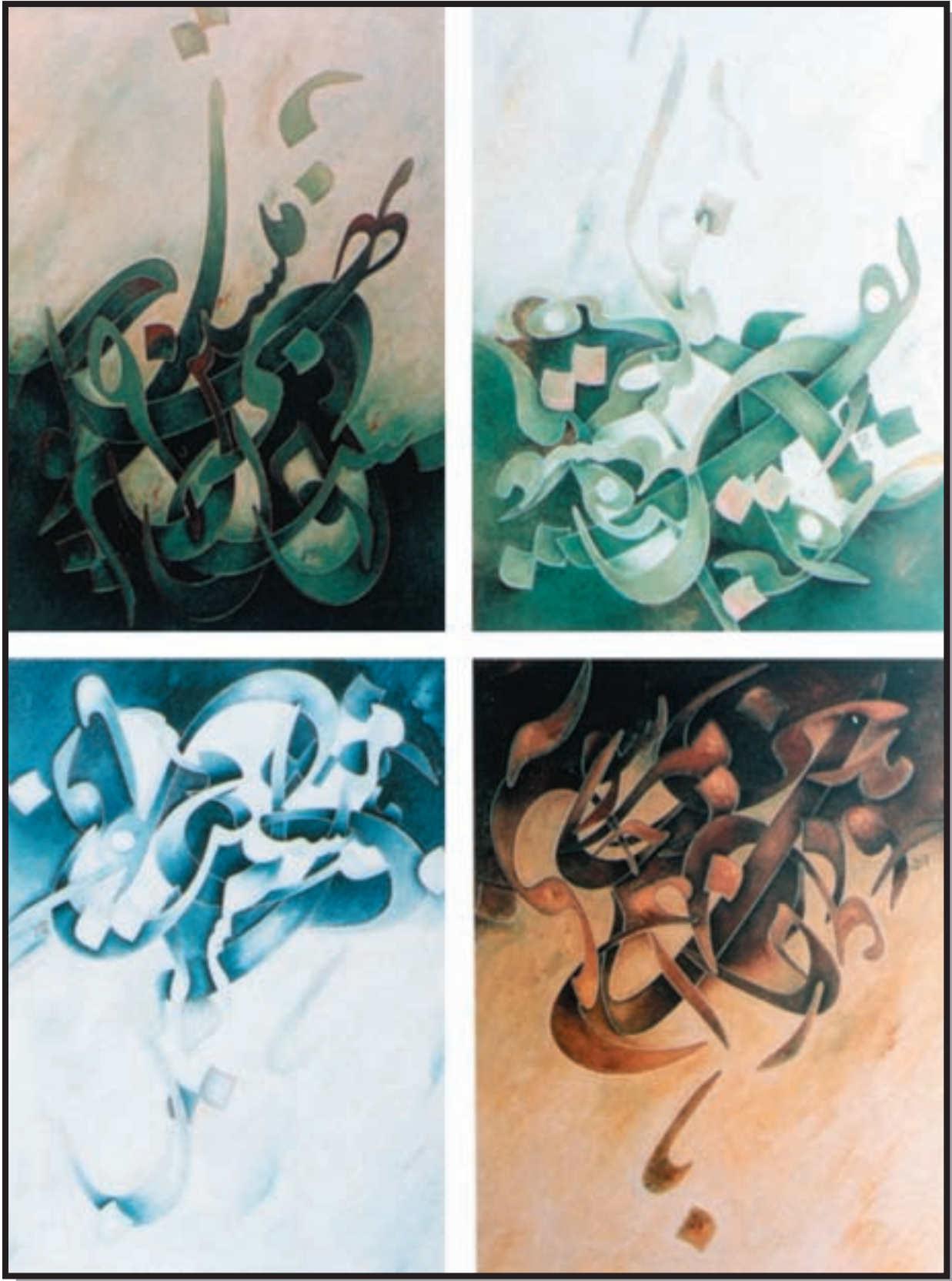
تصویر ۳-۲۴- چهار فصل - جلیل رسولی (معاصر) - رنگ روغن - ۶۴×۶۱