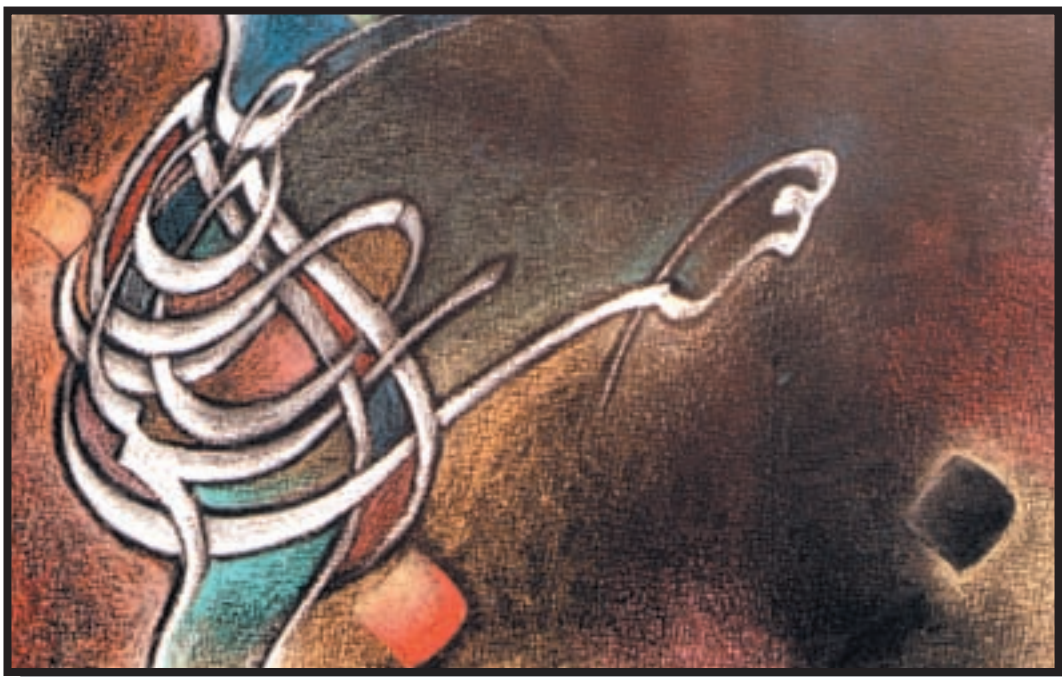
تصویر ۵-۲۴- نقاشیخط - بابک رشوند (معاصر) - پاستل - ۴۰×۶۰ cm