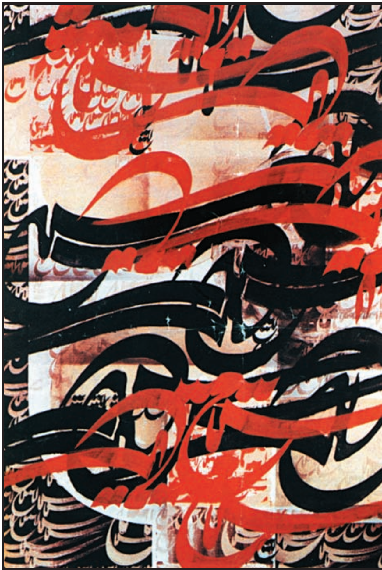
تصویر ۱-۲۴- نقاشیخط- فرامرز پیل آرام (معاصر)- رنگ روغن