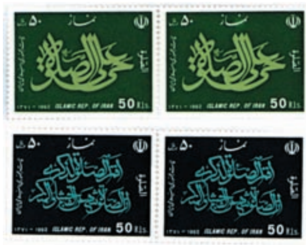
تصویر ۹-۲۶- استفاده از خوشنویسی در طراحی تمبر - صداقت جباری (معاصر)