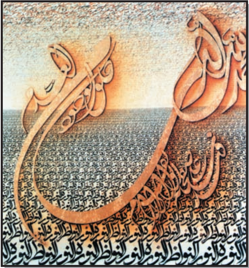
تصویر ۷-۲۴- نقاشیخط - نصرالله افجه‌ای - ۱۲۵×۱۲۵ cm