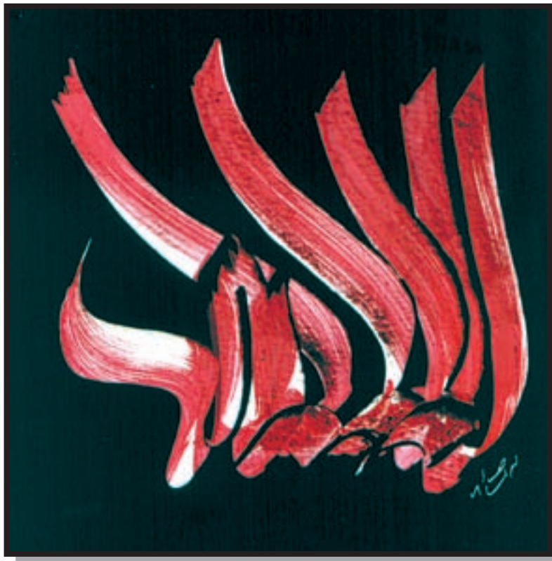
تصویر ۱-۲۶- نقاشیخط - محمد احصایی (معاصر)

بنابر ضرورتها فقط برای زیبایی متن و به منظور ایجاد رغبت بیشتر در خوانندگان و مطالعه کنندگان آن اجرا شده و می‌شود. مانند بسیاری از کتابهای شعر و پیامهای تبلیغاتی و غیره که بنا بر مقتضیات خوشنویسی شده و می‌شوند. علاوه بر آنچه گفته شد از عناصر خوشنویسی در هنرهای همچون حجم، نقش برجسته، معماری، صنایع دستی، و غیره می‌توان در جهت آفرینش آثار هنری استفاده کرد؛ همچنانکه در گذشته، هنرمندان خلاق ایرانی در بناها و دست ساخته‌های خود به طرق مختلف از خوشنویسی و امکانات تجسمی آن بهره می‌گرفته‌اند، امروزه نیز زمینه‌های متعددی وجود دارد که می‌توان با بکارگیری عناصر خوشنویسی در آنها هم بردامنه و موارد کاربری خوشنویسی افزود و هم جنبه‌های فرهنگی و هنری برخی کالاها را ارتقا داد و هویت ملی را در این نوع کالاها و تولیدات به خوبی نمایاند. برای مثال می‌توان صنایع پوشاک، پارچه، کاشی و سرامیک، را به عنوان زمینه‌های مناسبی که می‌توان از عناصر خط و خوشنویسی در آنها استفاده کرد نام برد. همچنین در زیباسازی شهرها و تزیینات داخلی اماکن عمومی و غیره، امکانات بالقوه‌ای برای حضور فراگیر هنر خوشنویسی به صورت حجم و نقش برجسته وجود دارد که به نظر می‌رسد از این طریق می‌توان هنر خوشنویسی را از حصار تنگ صفحات کاغذی و نمایشگاهها و مجموعه‌های خصوصی به درون جامعه برد و این هنر شریف و نماد فرهنگی و میراث ارزشمند را از انزوایی که بعد از دوران قاجار به آن دچار گشته خارج ساخت.