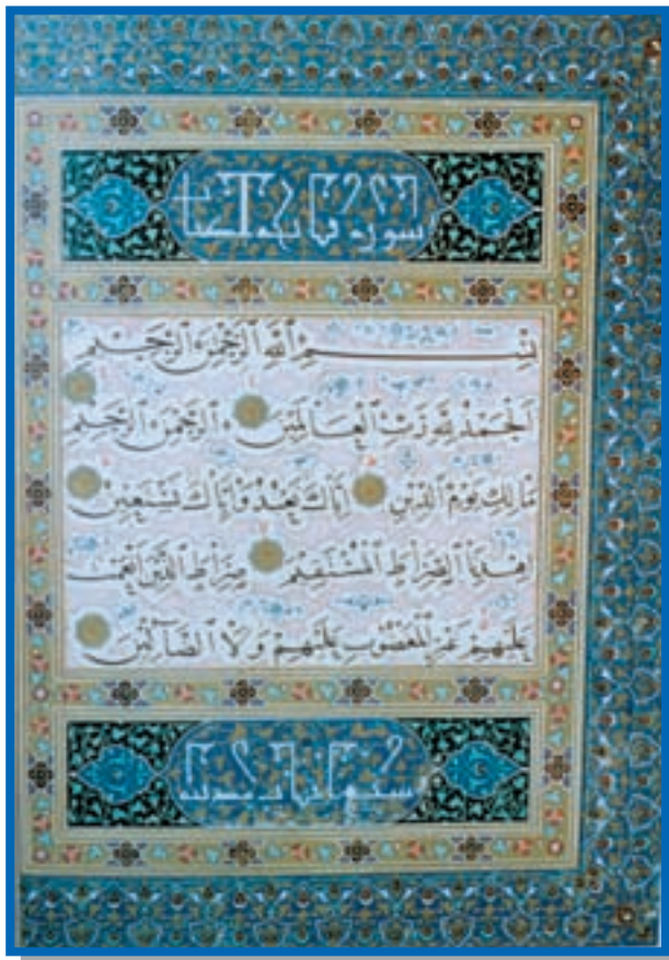
تصویر ۳-۲۵ - خط نسخ - شمس‌الدین بایسنقری - ۲۵×۳۵ cm - (قرن ۹) - هرات

نسخ: نمادی از قرآن کریم است و دارای خصوصیتی چون سادگی، صراحت، قدرت، جدیت، قداست، معنویت، پایداری، اعتماد و دانش است.