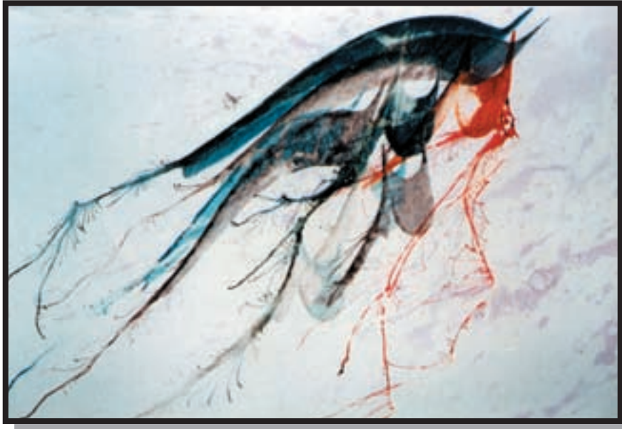
تصویر ۵-۲۶ - نقاشی خط - یونس پولاد (معاصر) - مرکب و قلم - ۵۸×۷۸ cm