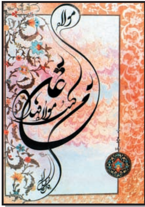
تصویر ۶-۲۶ - استفاده از حرکت‌های نرم و آزاد - غلامعلی فرضی (معاصر) - ۴۸/۵×۶۹ cm