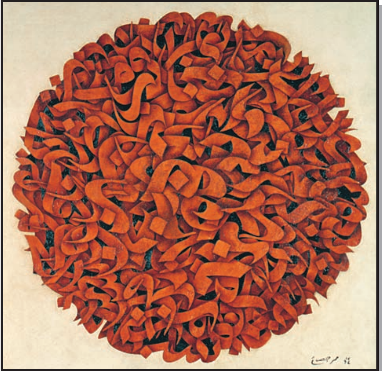
تصویر ۸-۲۴ - نقاشیخط - محمد احصایی (معاصر) - رنگ و روغن