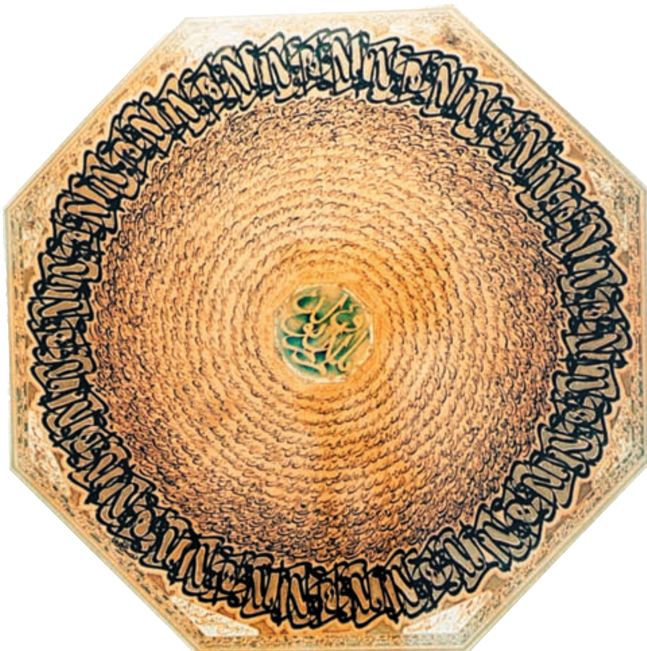
تصویر ۲-۲۶- نقاشیخط - نصرالله افجه‌ای (معاصر)