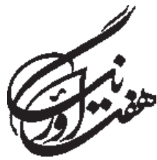
تصویر ۱۱-۲۶- طراحی آرم با استفاده از خوشنویسی - مرتضی ممیز (معاصر)