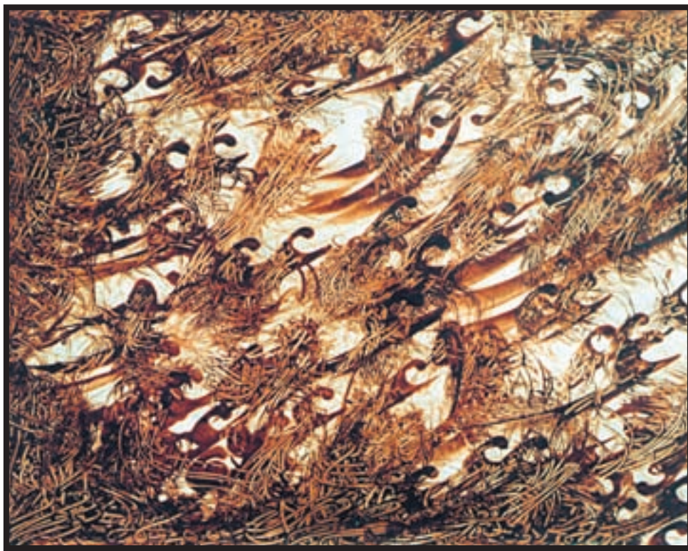
تصویر ۳-۲۶- نقاشیخط - اسماعیل رشوند (معاصر) - مرکب و قلم - حرکت‌های آزاد و سریع قلم - ۳۰×۴۵cm