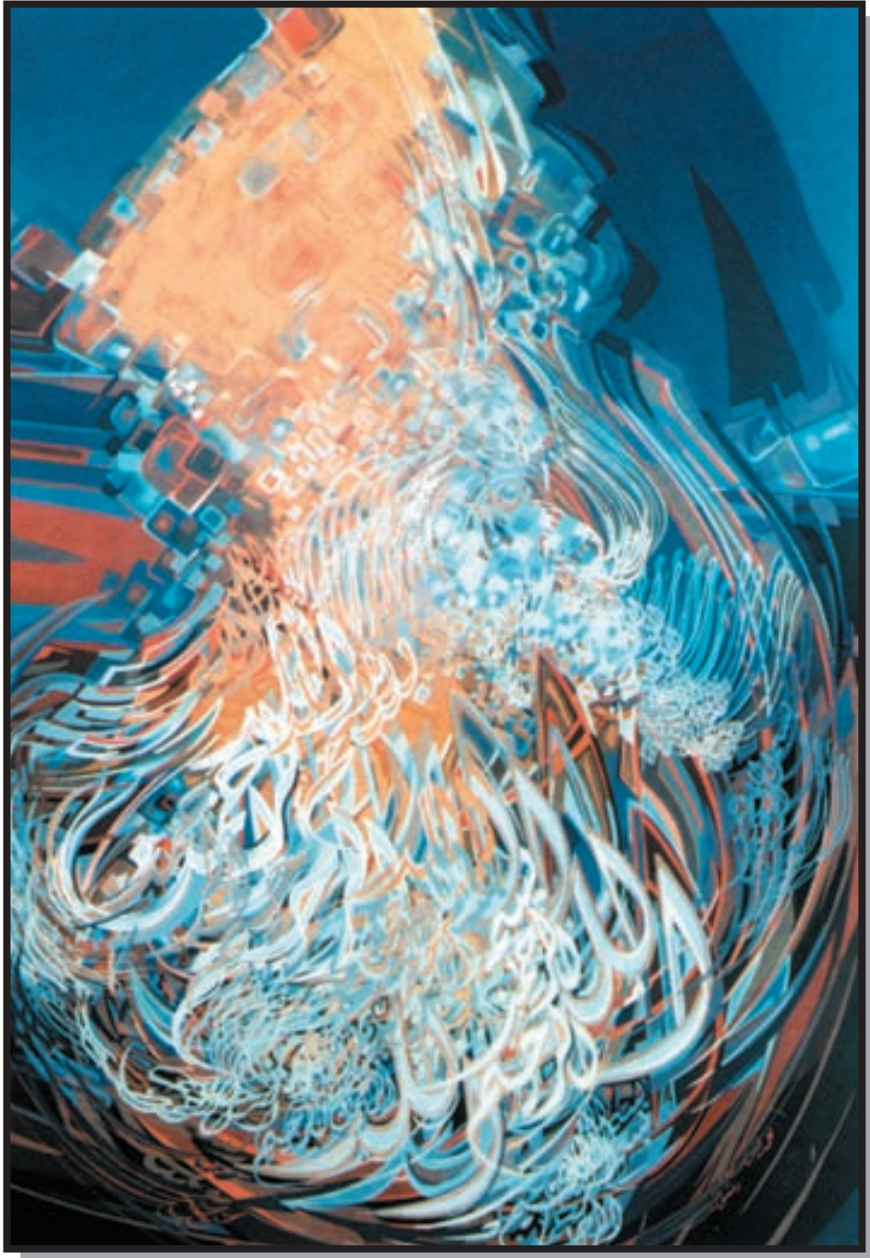
تصویر ۲-۲۴- محمد غنوم (سوریته) (معاصر) - رنگ روغن - ۷۰×۱۰۰cm