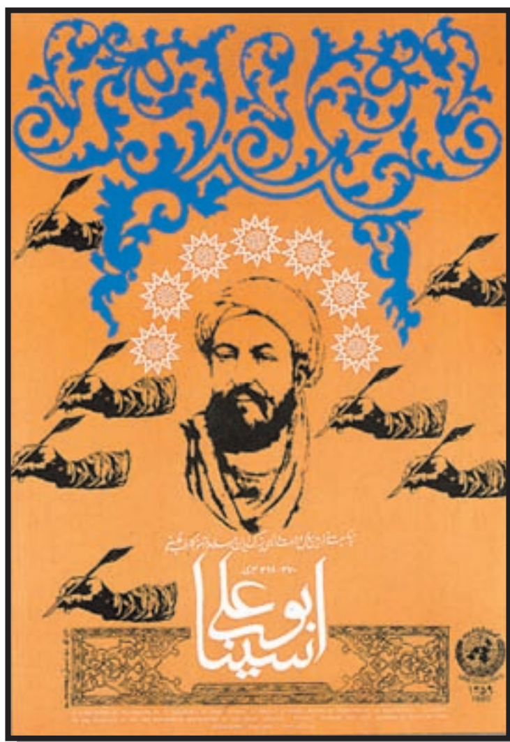
تصویر ۶-۲۵- پوستر فیلم - مرتضی ممیز (معاصر)

۴- چه نوع خوشنویسی برای استفاده در طراحی پوستری برای «جشنواره شعر نو» مناسب است؟