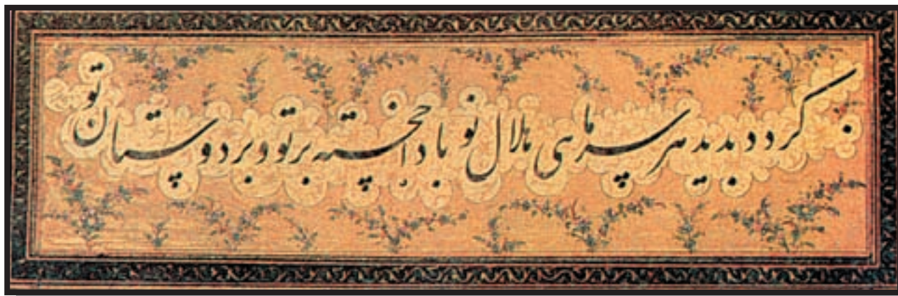
تصویر ۴-۲۵ - نستعلیق - میرزا غلامرضا اصفهانی - (قرن ۱۳ هـ)

نستعلیق: سادگی، زیبایی، تناسب، اصالت، نرمی، شادی، عذوفت، آرامش، انعطاف‌پذیری، دوستی، عرفان، صداقت، باکی، عشق و اعتماد را به بیننده القا می‌کند و نماد فرهنگ ایرانی و خط فارسی است.