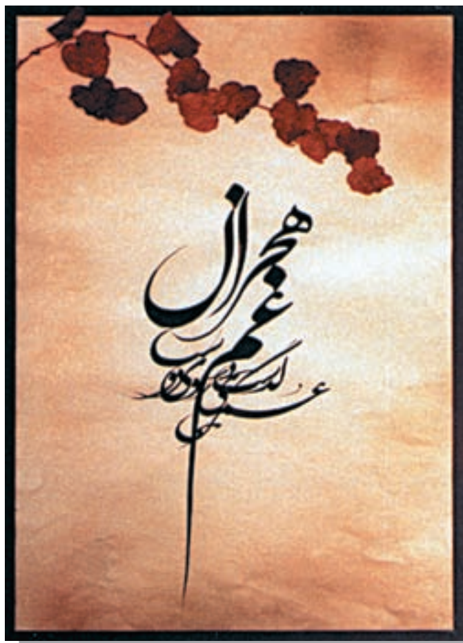
تصویر ۷-۲۶- استفاده از حرکت‌های نرم و آزاد - اسماعیل رشوند (معاصر) - ۲۵×۳۵ cm