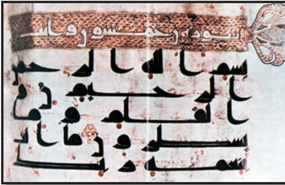
تصویر ۱-۲۵- کوفی - (منسوب به حضرت علی ع) موزه ایران باستان

کوفی: القا کننده اصالت، قداست، قدمت، معنویت، امامت، عصمت و تداعی کننده عصر پیامبر گرامی اسلام (ص) و ائمه اطهار (ع) می باشد.