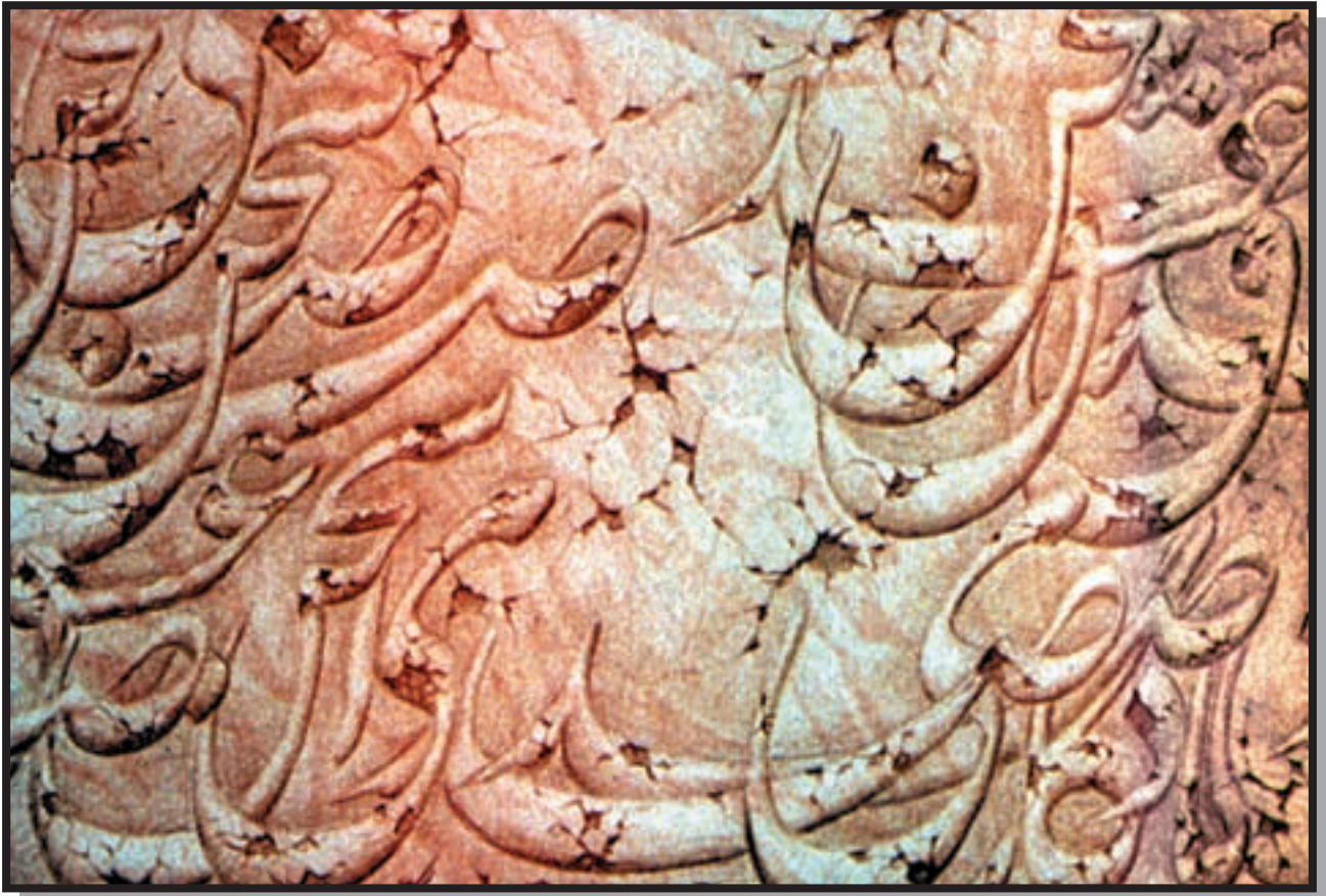
تصویر ۴-۲۴- یادگار - اسماعیل رشوند (معاصر) - مداد رنگی - ۳۵×۵۰ cm