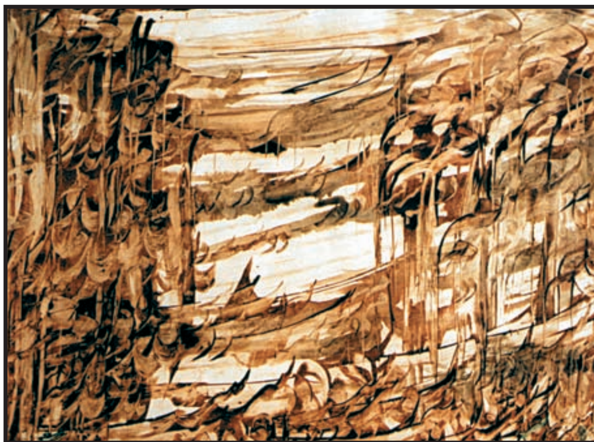
تصویر ۴-۲۶- نقاشیخط - اسماعیل رشوند (معاصر) - (بداهه‌سازی با حرکت‌های سریع قلم) - مرکب و قلم خوشنویسی - ۵۰×۷۰cm