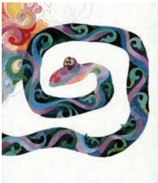
ب- اثر نورالدین زرین کلک، کتاب آ، اول الفباست، هنرمند در این اثر با استفاده از رنگ‌های سرد و گرم ترکیب‌بندی رنگی مناسبی به‌وجود آورده است.

در این مورد نمی‌توان قانون صادر کرد و یا شیوه‌ای خاص ارائه کرد. باید به این نکته توجه کرد که هنرمند از تأثیرات محیط نیز نمی‌تواند خود را رها کند و تأثیرگذاری فرهنگ‌های بومی و قومی همواره با تصویرگر همراه و همگام است (تصویر ۳- الف تا د).