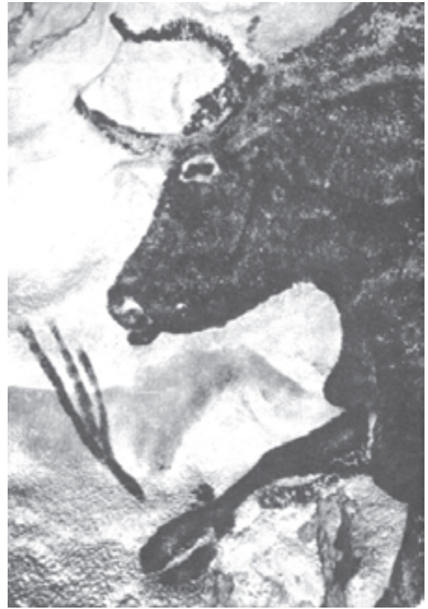
تصویر ۱۵- الف- گاو نر سیاه، جزئی از نقاشی درون غار لاسکو- فرانسه- حدود ۱۰۰۰۰ تا ۱۵۰۰۰ سال قبل از میلاد

عصر حاضر و هنر نوین را وادار به تفکر و اندیشه در مورد آثار هنرمندان عهد کهن نموده است (تصویر ۱۵- الف و ب) و هنرمندان معاصری چون پُل کلی (تصویر ۱۶) و خوان میرو (تصویر ۱۷) همواره سعی نموده‌اند تا توسط اشکال ساده بتوانند به خلق آثار خود بپردازند.