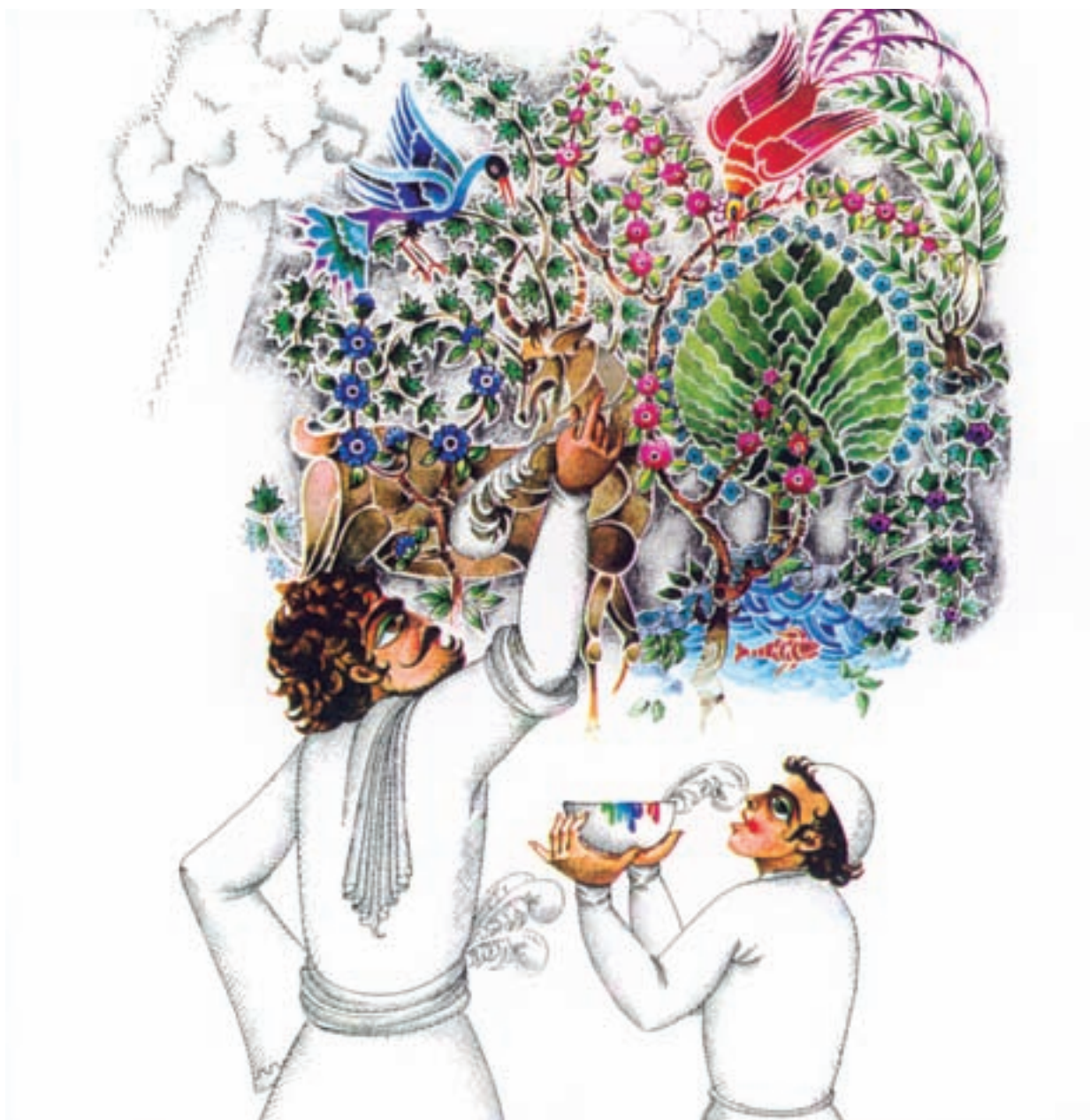
تصویر ۱- اثر علی اکبر صادقی، قصه‌ی آب - آفتاب و کاشی، نمونه‌ای از تأثیرپذیری هنرمند با توجه به فرهنگ بومی اسلامی - ایرانی

تصویرسازی کودکان و نوجوانان همواره این سؤال مطرح است که «رنگ مناسب» برای کودکان و نوجوانان کدام دسته از رنگ‌ها مناسب می‌باشند؟ این مسأله بیش‌تر بستگی به نظر شخصی هنرمند دارد و اوست که دریافت واحدی نسبت به داستان دارد و رنگ‌ها و تعبیری که برای بیان فکر و احساساتش به کار می‌گیرد، کار او را از دیگران متمایز می‌سازد. بعضی از هنرمندان از رنگ‌های درخشان و شاد استفاده می‌کنند (تصویر ۲).