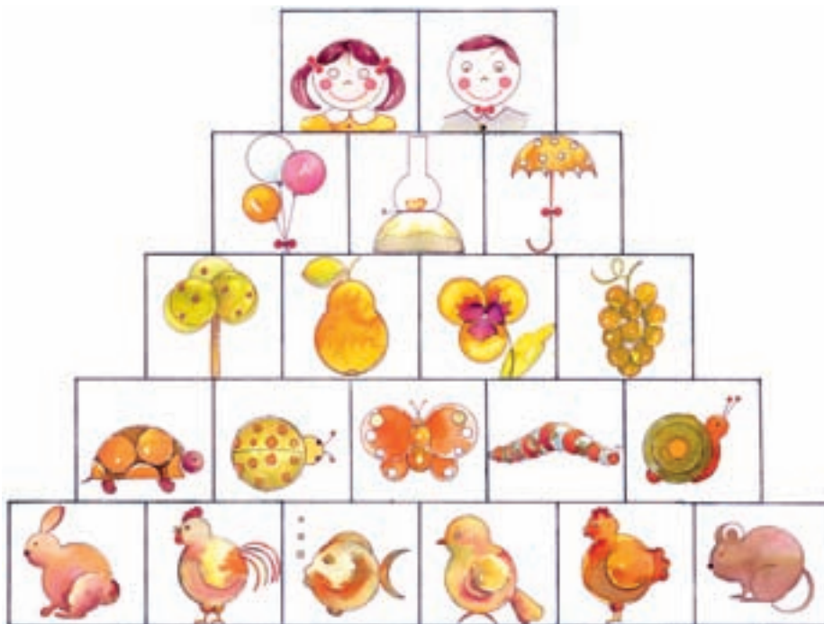
تصویر ۱۹ - تصویرسازی با شکل‌های اصلی - اکولین - اثر اعظم کریمی

به روش‌های ساده‌سازی طبیعت در تصویر شماره ۱۹ دقت نمائید.