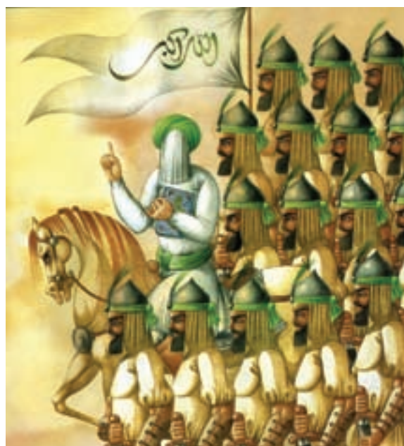
الف- اثر علی‌اکبر صادقی، کتاب پیروزی، هنرمند با استفاده از رنگ‌های گرم و با الهام از نقاشی قهوه‌خانه‌ای به شیوه‌ای نو و جدید دست یافته است.

اهمیت رنگ و به‌کارگیری آن در خلق تصویر نزد تمامی تصویرگران از ویژگی خاصی برخوردار است. اولویت بخشیدن به رنگ در تصاویر کتاب کودکان به این معنی نیست که رنگ را مهم‌تر از سایر عناصر نظیر خط و طرح بدانیم. چون به‌طور قاطع