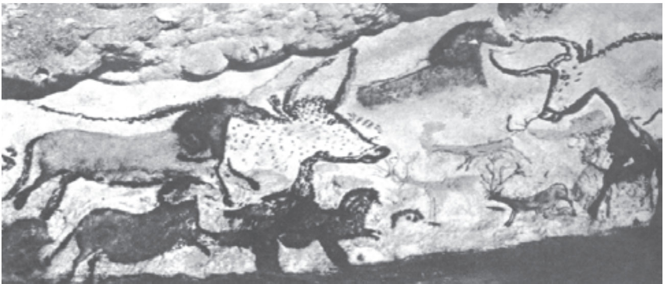
تصویر ۱۵- ب- نقاشی‌های درون غار لاسکو- فرانسه- حدود ۱۰۰۰۰ تا ۱۵۰۰۰ سال قبل از میلاد