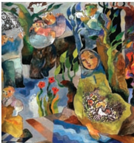
د- اثر محمدعلی بنی‌اسدی، هنرمند با استفاده از رنگ‌های تیره و ترکیبی به شیوه‌ای فردی در تصویرسازی دست یافته است.

اهمیت رنگ و به‌کارگیری آن در خلق تصویر نزد تمامی تصویرگران از ویژگی خاصی برخوردار است. اولویت بخشیدن به رنگ در تصاویر کتاب کودکان به این معنی نیست که رنگ را مهم‌تر از سایر عناصر نظیر خط و طرح بدانیم. چون به‌طور قاطع