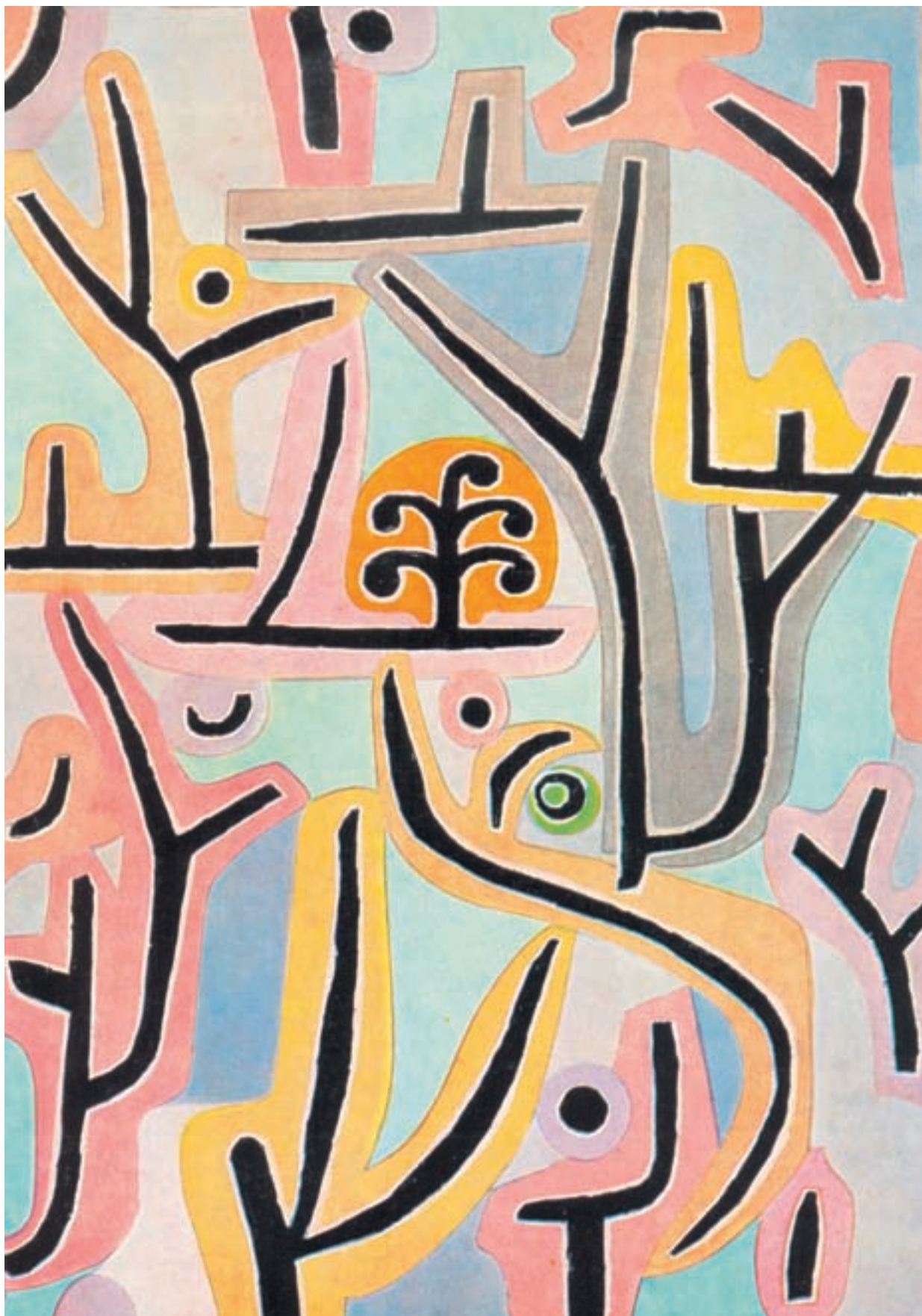
تصویر ۱۶- باغ نزدیک لوسرن - ۱۹۳۸ - رنگ روغن - اثر پل کلی