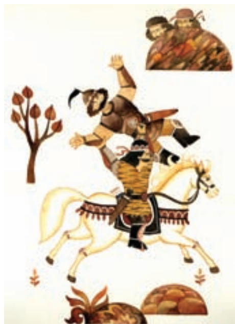
ج- اثر محسن حسن‌پور، هنرمند در این اثر با استفاده از رنگ‌های هم‌خانواده توانسته است فضای اسطوره‌ای را تداعی کند.