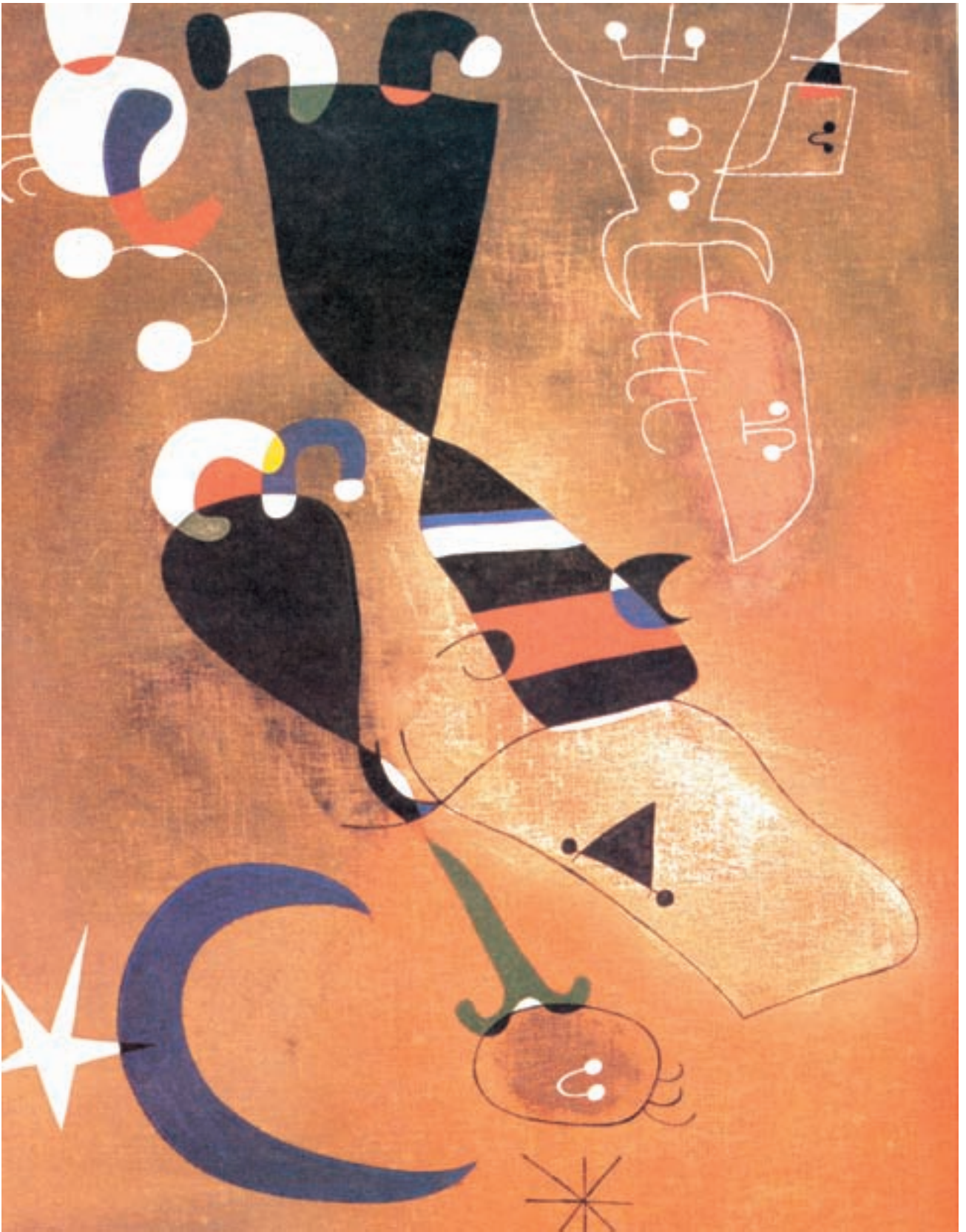
تصویر ۱۷- زن، پرنده و مهتاب - ۱۹۴۹ - رنگ روغن - اثر خوان میرو