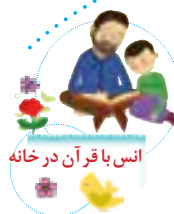
انس با قرآن در خانه

با اعضای خانواده‌ات مشورت کن و بگو این تصویر با کدام یک از پیام‌های قرآنی این درس ارتباط دارد.