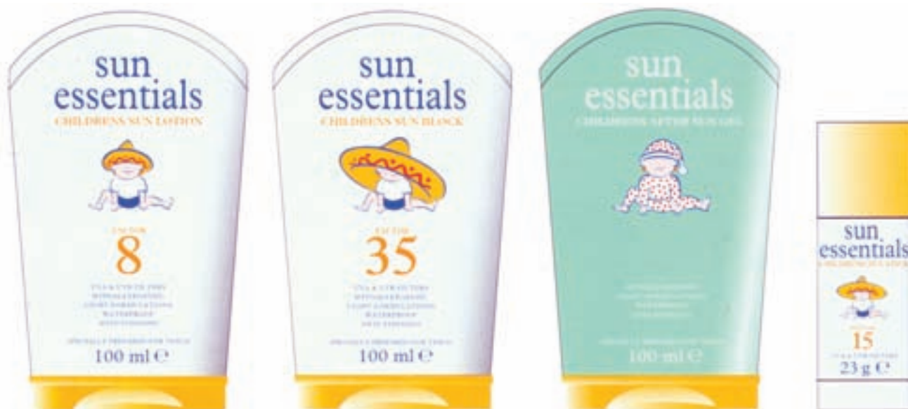
شکل ۳۹ - ۴ - طراحی برجسته کرم ضد آفتاب کودک (کاربرد رنگ در بسته بندی و رابطی آن با روحیه مخاطبین)