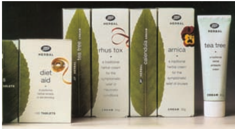
شکل ۳۲ - ۴ - به کارگیری ترندهایی خلاق و ابتکاری در طراحی جعبه به صورتی که در چیدمان انبوه جلوه‌ای جدید و نو ایجاد نمایند.