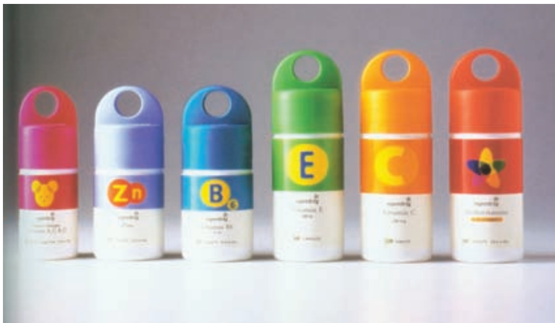
شکل ۳۸ - ۴ - به کارگیری تنوع رنگی در بسته بندی داروهایی که از طعم ها و مزه های متنوعی برخوردارند.