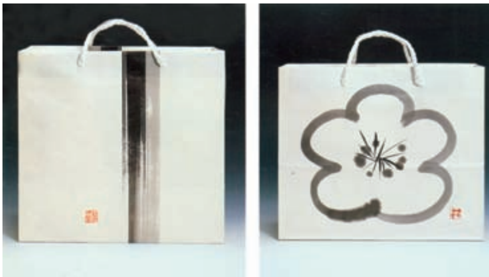
شکل ۴۸ - ۴ - طراحی ساک خرید