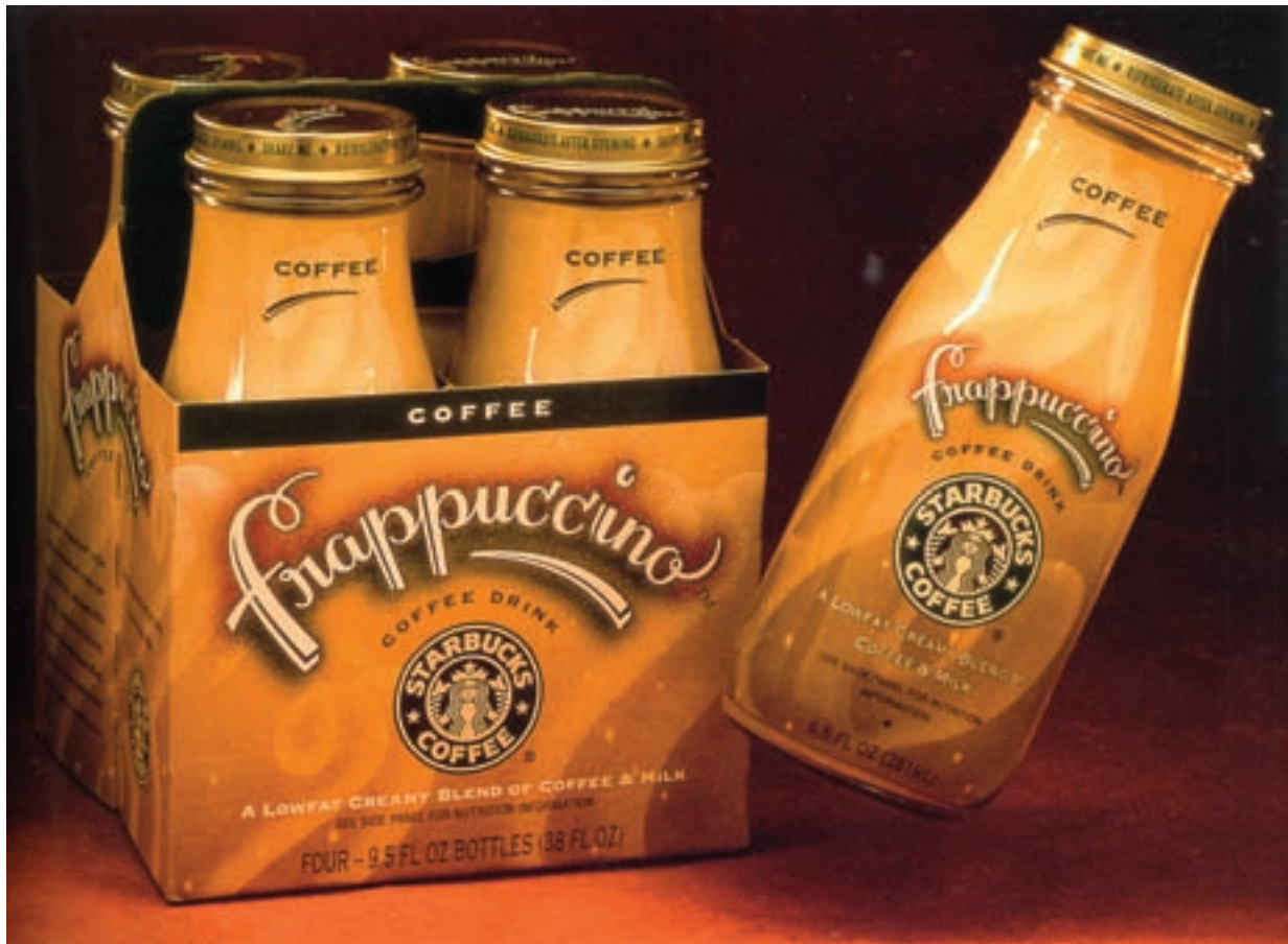
شکل ۲۶ - ۴ - به کارگیری ترکیب بندی مناسب عناصری مانند لوگو تایپ و نشانه و تلفیق آن‌ها برای رسیدن به طراحی موفق در «بسته بندی» ۲۰۹