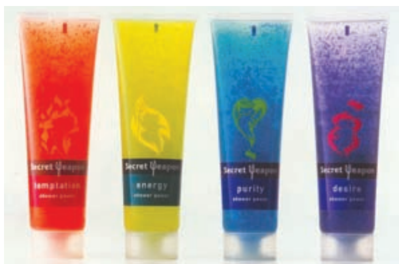
شکل ۴۶ - ۴ - تنوع رنگ در چاپ روی مواد پلاستیکی