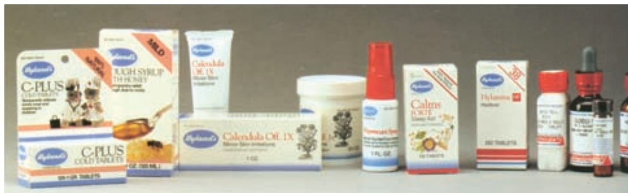
شکل ۳۵ - ۴ - طراحی بسته‌بندی داروهای کودکان