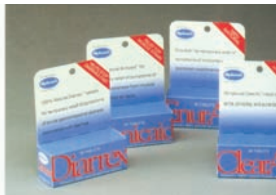
شکل ۳۶ - ۴ - طراحی بسته‌بندی داروهای بزرگسالان