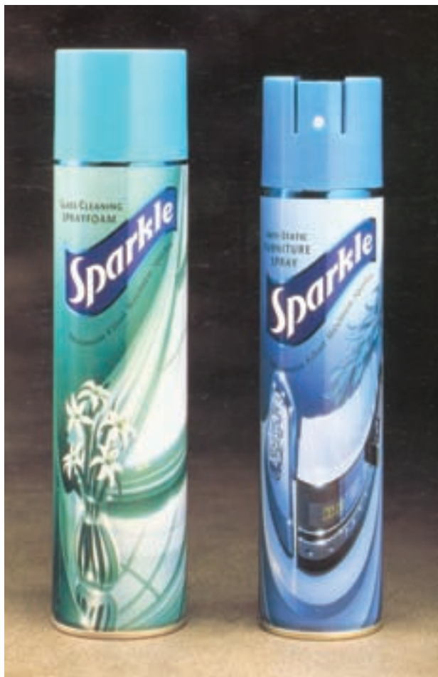
شکل ۴۴ – ۴ – چاپ روی فلز