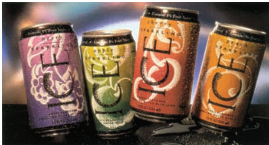
شکل ۳-۴ - عکاسی هنری از چیدمان محصول و جلوه‌های بصری بسته‌بندی آن