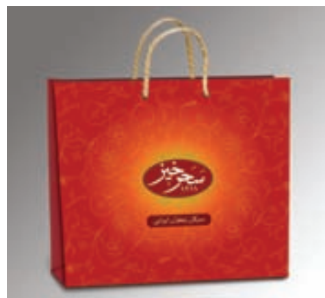
شکل ۴۹ - ۴ - طراحی ساک خرید و استفاده از تصویر در عطف ساک خرید (چند نمونه از طراحی ساک های خرید)