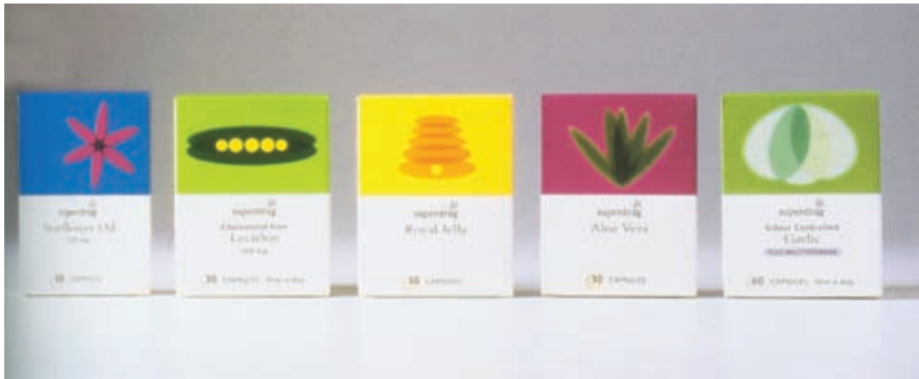
شکل ۳۷ — ۴ — کاربرد رنگ در بسته‌بندی داروها با توجه به طعم‌دهنده‌ها و اسانس‌ها

مخاطبان عام یا مخاطبان خاص از قبیل (بزرگسالان، کودکان، صنعتگران، بانوان، ...)