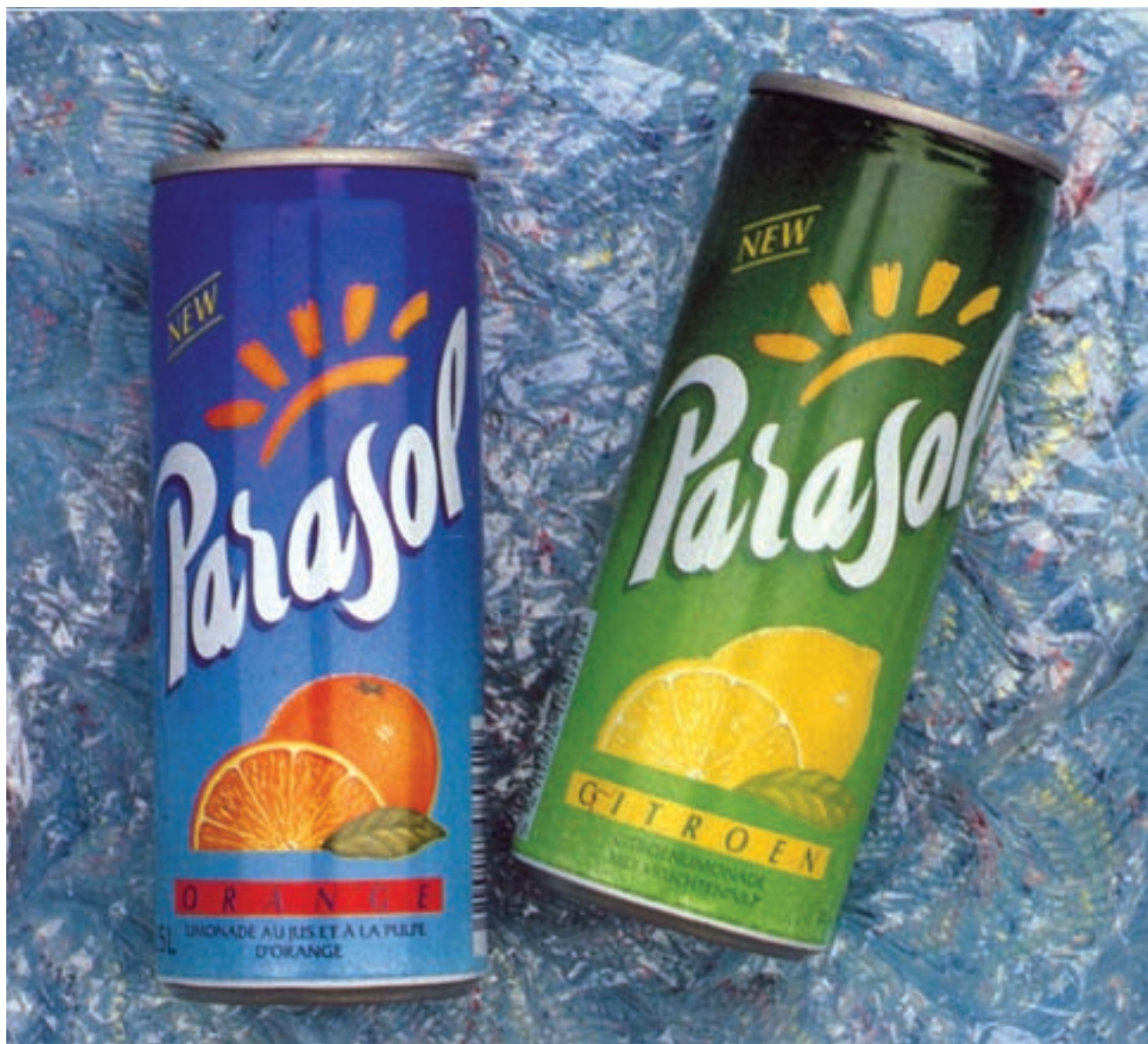
شکل ۴۵-۴- چاپ روی فلز