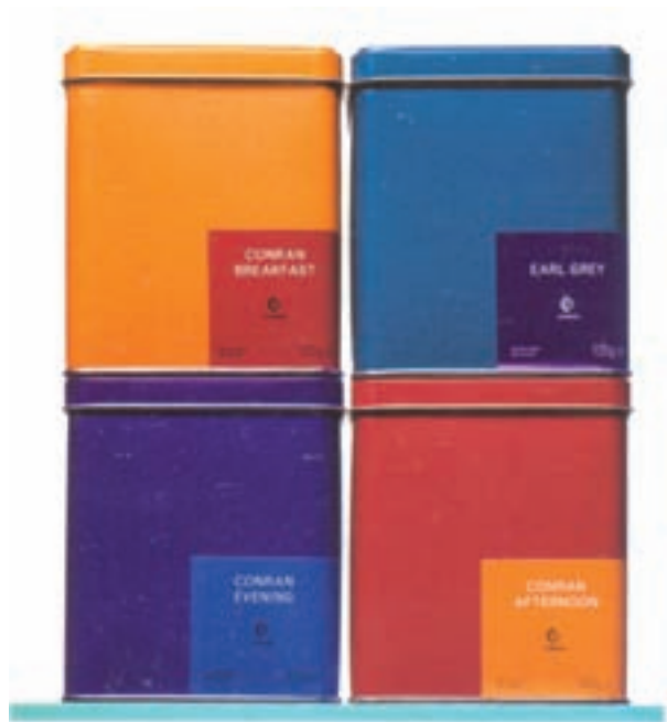
شکل ۴۳ – ۴ – طراحی بسته بندی روی قوطی فلزی برای مواد غذایی با طرحی ساده و رنگ های تخت و یکنواخت.