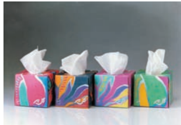
شکل ۲۷ - ۴ - عکاسی از محصول «گل‌پر» (دستمال کاغذی گل‌پر)

در طراحی بسته‌بندی، یکی از نکات مهم، رعایت سلیقه و روحیات مخاطبان است، مانند علائق مصرف‌کننده، محیط، اقلیم، سن، جنسیت و ... به‌طور مثال در طراحی بسته‌هایی که مورد مصرف کودکان است استفاده از رنگ‌های جذاب و شاد و تنوع فرم‌ها و نوع خاصی از تایپوگرافی عنوان و نام محصول مفیدتر به نظر می‌رسد، در حالی که این موارد ممکن است در مورد بسته‌بندی محصولاتی که مخاطبان عام دارد خیلی مناسب نباشد. همچنین است روحیه‌ی مصرف‌کننده و ارتباط آن با نوع کالای مصرفی، چنانچه در مورد طراحی و بسته‌بندی مواد غذایی کاربرد عناصر بصری کاملاً متفاوت است با مواد بهداشتی و آرایشی. در این زمینه مثال‌های متعددی را می‌توان ذکر نمود تا هنرجویان به کاربرد عناصر بصری با دقت و حوصله‌ی بیشتر توجه کرده و در اتودهای