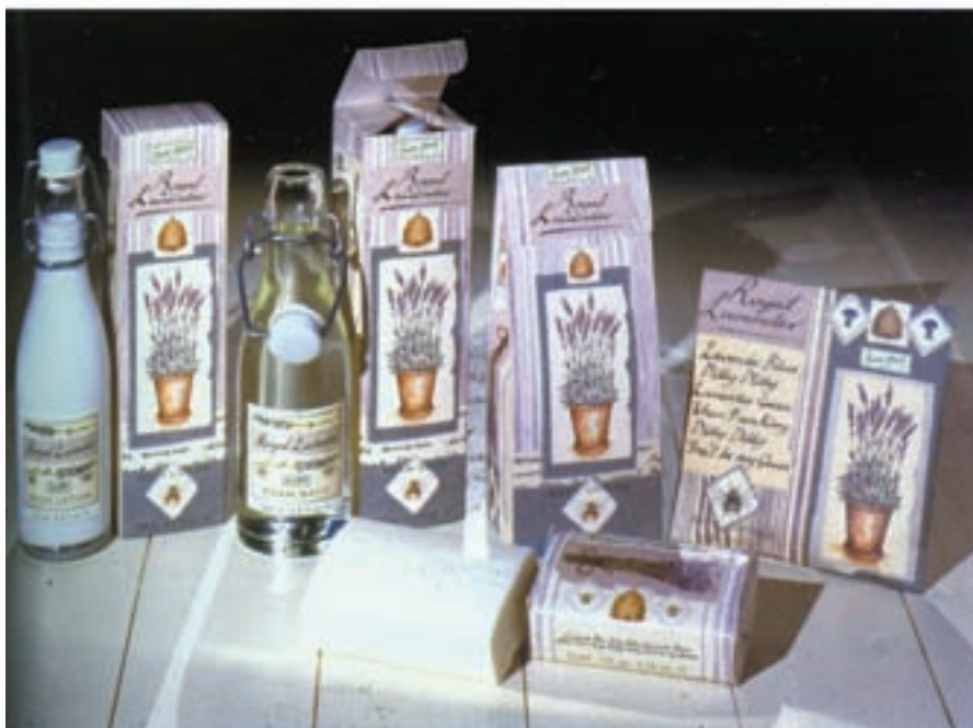
شکل ۲۹-۴- عکاسی از چیدمان محصولات و کاربردهای گوناگون (لوسیون - کرم - صابون و ...)