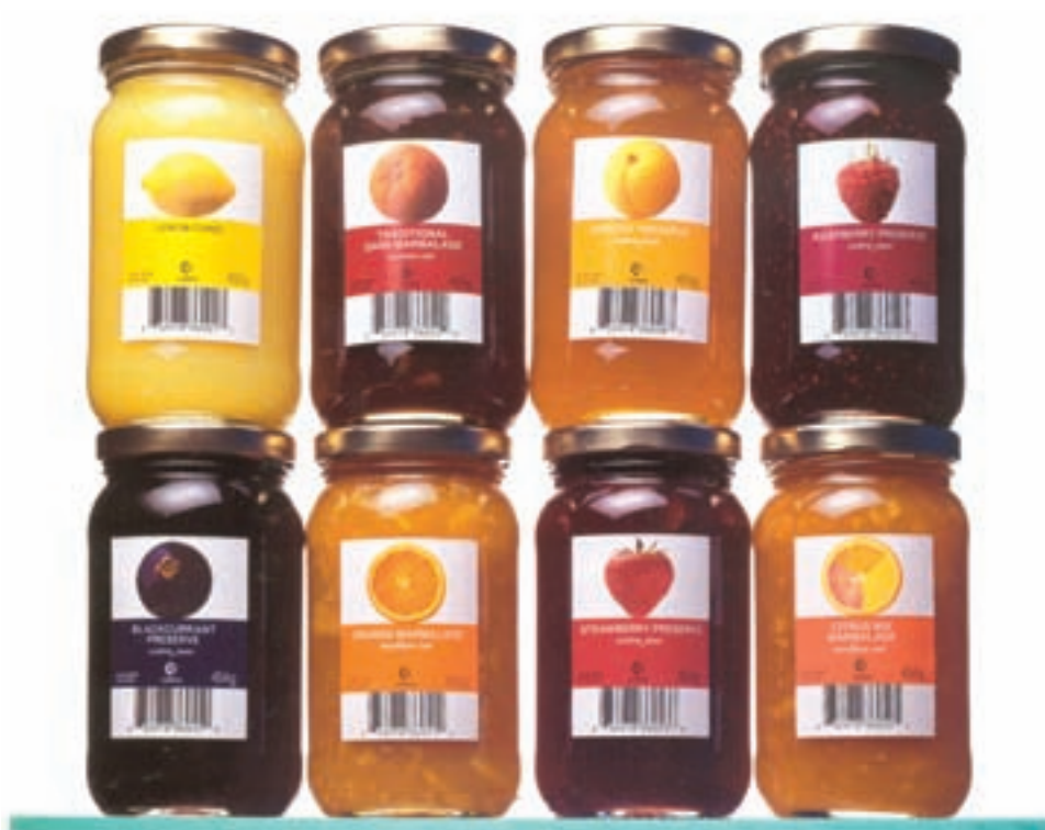
شکل ۳۱-۴ - چیدمان انبوه بسته‌ها و جلوه‌های بصری بسته‌بندی در این نوع از چیدمان (برچسب) - مارمالاد