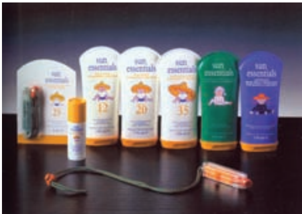
شکل ۲۸ - ۴ - تأثیرات عکاسی از چیدمان محصولات و جلوه‌های تبلیغی آن

یکی از جلوه‌های بصری در طراحی بسته‌بندی، در نظر گرفتن طراحی بسته در چیدمان انبوه و تبلیغات فروشگاه‌های می‌باشد که از جذابیت بصری خاصی برخوردار است. بسیاری از محصولات مانند روغن موتور اتومبیل، پاک‌کننده‌ها و شوینده‌های بهداشتی و ... به صورت تعداد زیادی که روی هم چیده شده، عرضه می‌گردند. در این صورت ممکن است هنگام طراحی روی جعبه یا طراحی لیبل (برچسب) لازم باشد که کاربرد محصول در چیدمان هنری عکاسی شود و تصویر مجموعه‌ای از این محصول با کاربردهای گوناگون در یک ترکیب‌بندی مطلوب مورد استفاده قرار گیرد. تشویق هنرجویان در کارگاه بسته‌بندی به عکس گرفتن از چند بسته‌بندی و رعایت مواردی مانند عمق میدان، نورپردازی و زاویه‌ی دید بسیار ضروری و مؤثر می‌باشد.