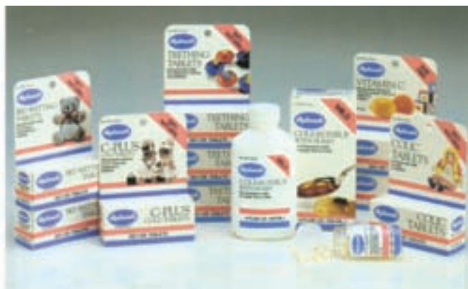
شکل ۳۴ - ۴ - طراحی بسته‌بندی داروهای کودکان