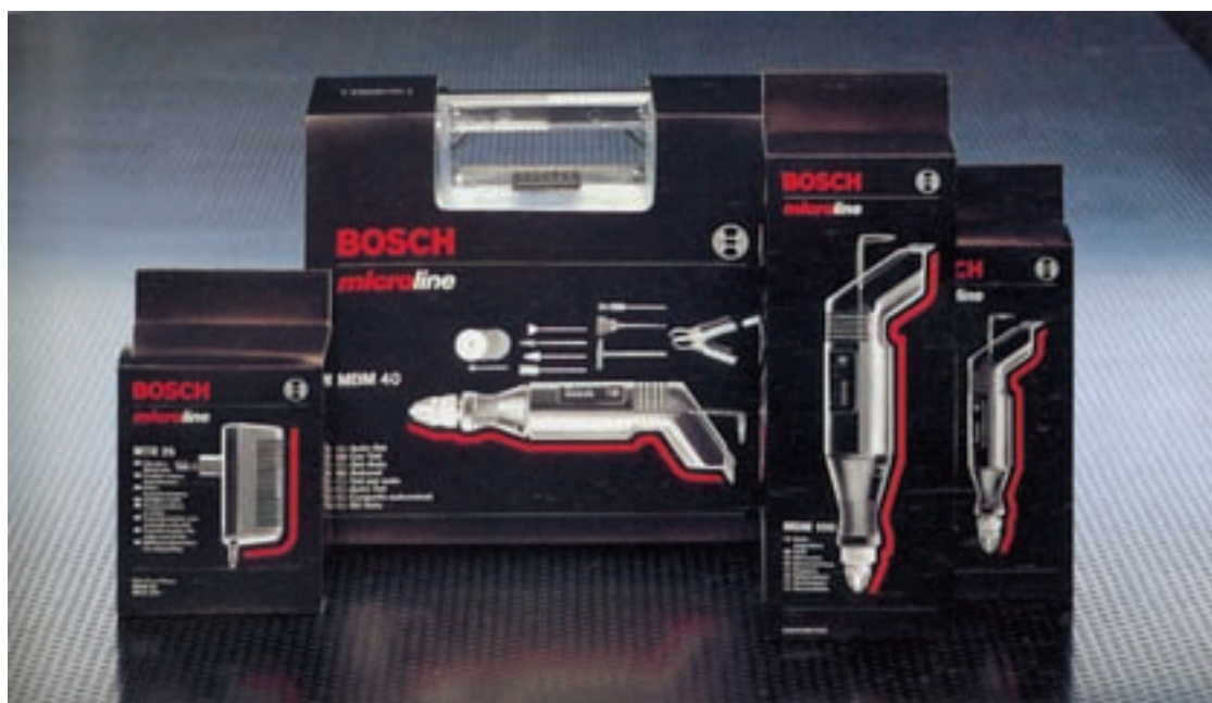
شکل ۴۱ - بسته‌بندی ابزار و لوازم صنعتی تفاوت در طراحی بسته‌بندی برای مخاطبین متفاوت