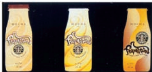
شکل ۲۴ - ۴ - بسته‌بندی مایعات با غلظت‌های متنوع و بسته‌های متفاوت