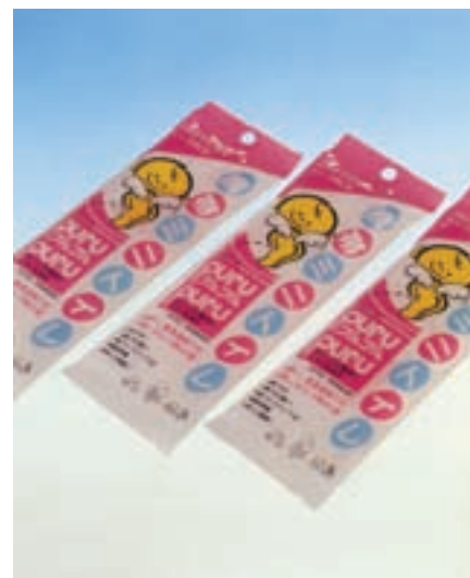
شکل ۴۰ - بسته‌بندی لوازم بهداشتی کودک