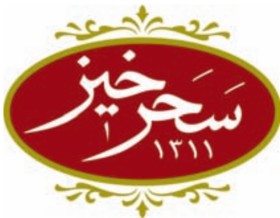
شکل ۲۵ - ۴ - کاربرد لوگوتایپ (عنوان محصول) به صورت طرح اصلی روی بسته

برای شروع این تمرین شناخت عناصری مانند رنگ و طرح و چیدمان محصول ... ضروری است. بنابراین در حین انجام کار عملی توسط هنرجویان هنرآموزان محترم می‌توانند اطلاعات زیر را در ضمن کار کارگاهی به هنرجویان خود منتقل نمایند.