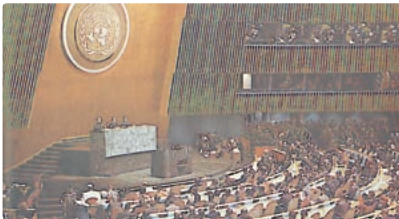
سازمان ملل متحد