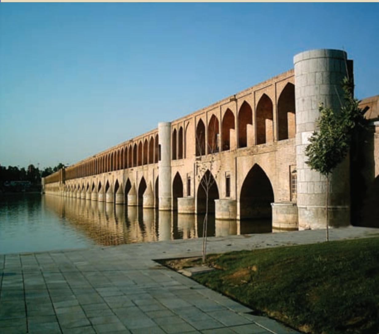
اصفهان — سی وسه پل (پل اللہ وردی خان)