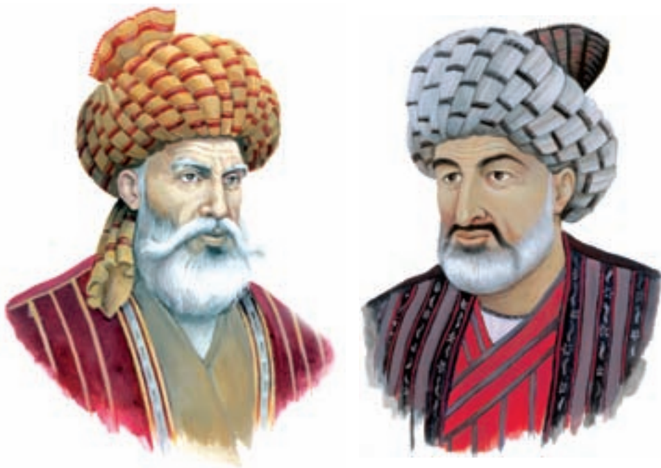
شیخ بهایی، عالم مشهور دوره شاه عباس اول