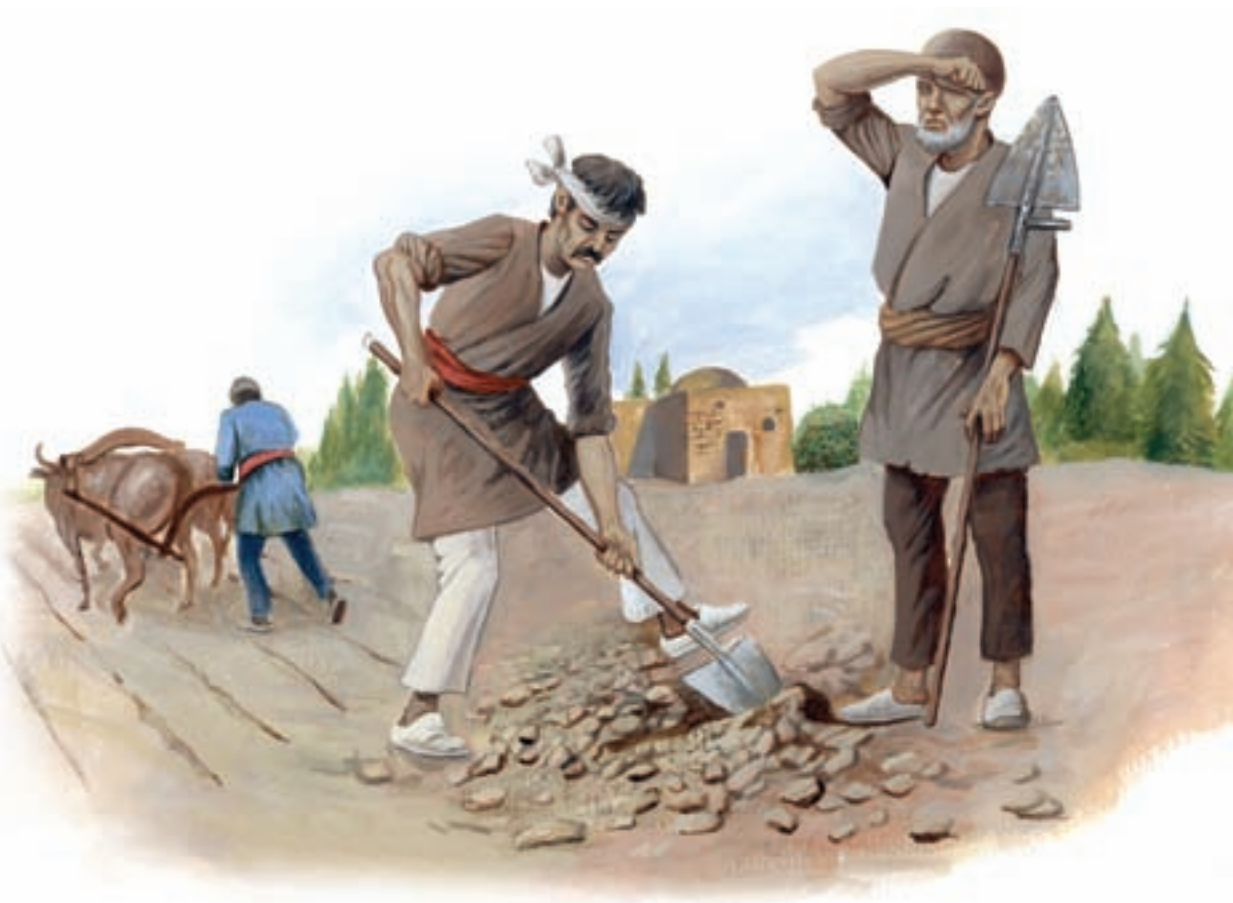
روستاییان عصر صفوی

روستاییان بیش از نصف جمعیت ایران را به خود اختصاص می‌دادند. این گروه تقریباً در ۴۰ هزار روستای بزرگ و کوچک زندگی می‌کردند. با وجود آنکه بیشتر دسترنج کشاورزان به جیب مالکان بزرگ و حاکمان و مأموران حکومتی می‌رفت، اما به گفته جهانگردان اروپایی، کشاورزان ایرانی در آن زمان از نظر تغذیه و پوشاک وضع بهتری نسبت به کشاورزان اروپایی داشتند. کوچ‌نشینان در حدود ۳۵ درصد کل جمعیت ایران بودند. مهم‌ترین آنها هفت قبیله تشکیل‌دهنده گروه قزلباشان بودند. گروه قزلباشان تا دوران پادشاهی عباس اول، قدرت سیاسی و نظامی زیادی داشتند، اما شاه عباس اول با انجام اصلاحاتی، از قدرت آنان کاست.