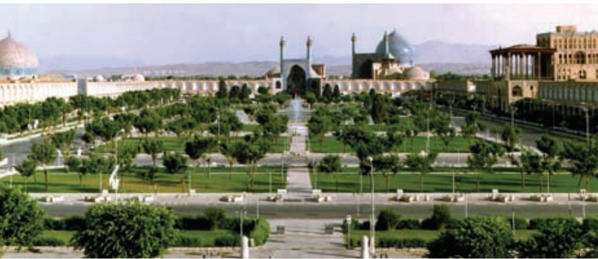
میدان نقش جهان (امام خمینی کنونی) اصفهان؛ طراحی و ساخته شده در عصر صفوی

همکاری نظامی انگلستان با حکومت صفوی علیه پرتغالی‌ها دو علت داشت :