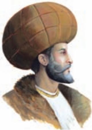
شاه اسماعیل اول صفوی

اسماعیل صفوی پس از پیروزی بر حاکم آق قویونلو و تصرف تبریز در سال ۹۰۷ ق، حکومت صفوی را بنیان نهاد و آن شهر را به پایتختی خود برگزید. او از نوادگان شیخ صفی الدین اردبیلی است. شیخ صفی دو قرن پیش از اسماعیل، سلسلهٔ طریقت صوفیانه‌ای را در اردبیل به وجود آورد که پس از مرگ او، توسط فرزند و نوادگانش رهبری می‌شد. بیشترین مریدان طریقت صفوی را اعضای هفت طایفه ترک تشکیل می‌دادند که به قزلباش معروف شدند. این طریقت تحت رهبری پدر بزرگ و پدر اسماعیل گام در مسیر فعالیت‌های سیاسی و نظامی گذاشت و سرانجام اسماعیل با پشتیبانی مریدان مطیع و پرشور به حکومت رسید.