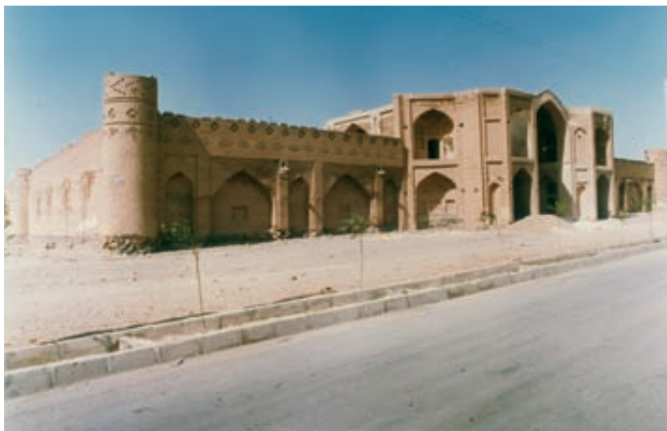
کاروانسرای کوهپایه اصفهان