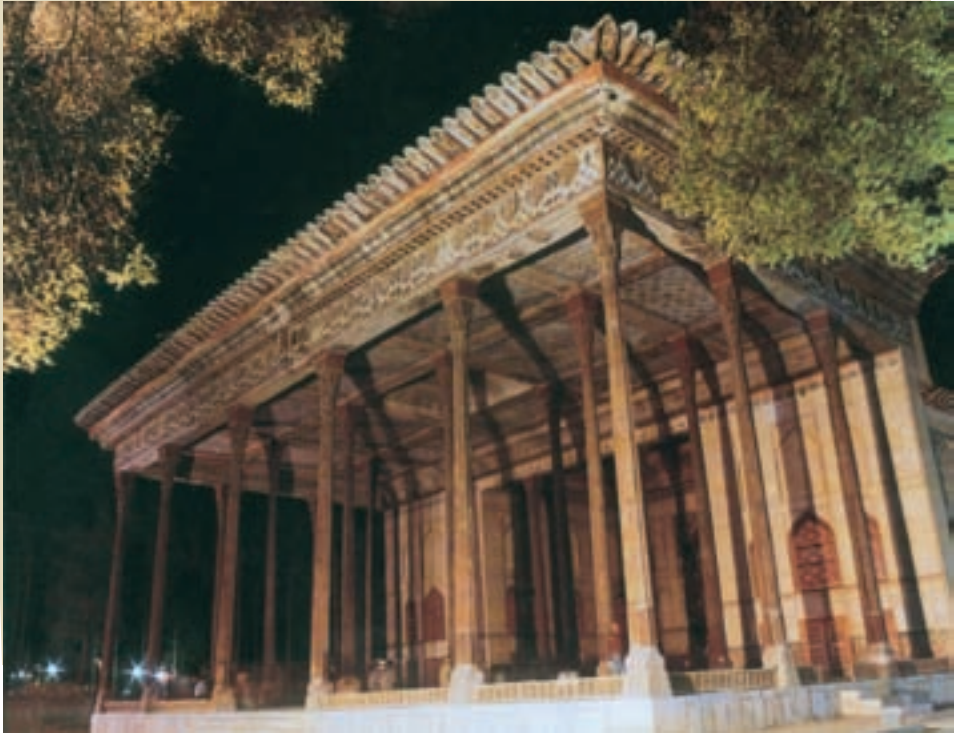
اصفهان - کاخ چهلستون