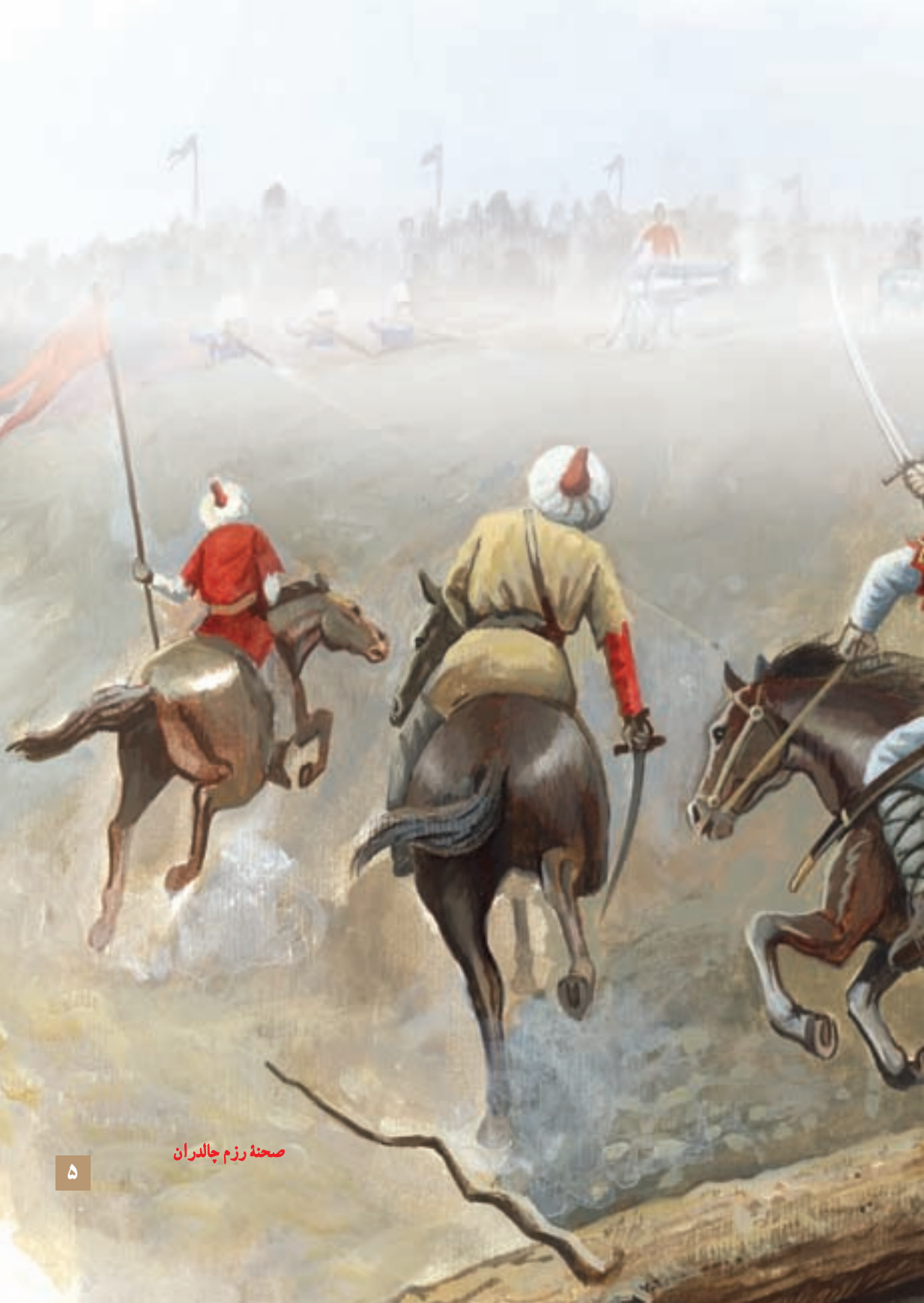
صحنه رزم چالدران