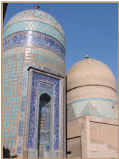
بقعه شیخ صفی‌الدین اردبیلی در شهر اردبیل

همزمان با تأسیس حکومت صفوی در ابتدای قرن ۱۰ ق، اوضاع سیاسی ایران بسیار آشفته