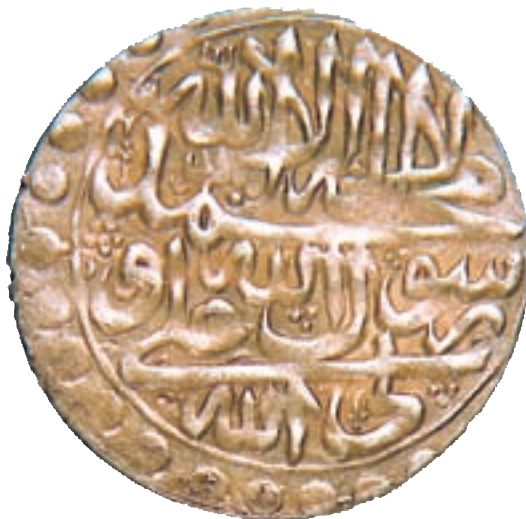
نمونه‌ای از سکه‌های عصر صفوی

مالیات اصلی‌ترین منبع درآمد حکومت بود که از کشاورزان و دامداران (کوچ‌نشینان) گرفته می‌شد. فعالیت‌های تجاری و پیشه‌وری نیز مشمول عوارض خاص خود بودند.