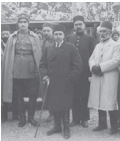
* احمدشاه، رضاخان و تعدادی از کارگزاران حکومتی

رئیس دیویزیون (لشکر) قزاق اعلیحضرت اقدس شهریاری و فرماندهٔ کل قزاق - رضا