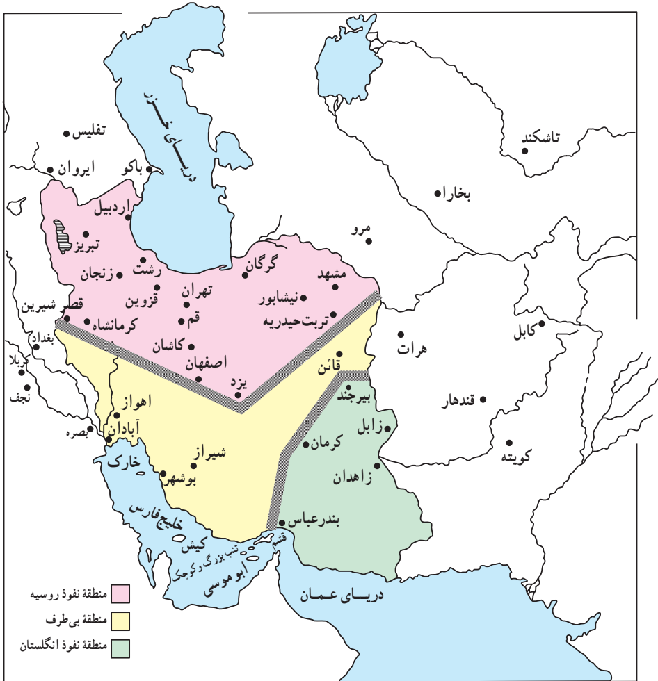
نقشه تقسیم ایران به سه منطقه براساس قرارداد ۱۹۰۷

جنگ جهانی اول: از آنجا که قدرت‌های استعمارگر قدیمی اروپا حاضر نبودند بخشی از مستعمرات خود را به قدرت‌های نوظهور اروپا واگذار کنند، دو طرف در مقابل یکدیگر صف‌آرایی کردند. در یک طرف آلمان، ایتالیا و اتریش – مجارستان قرار داشتند که به اتحاد مثلث یا متحدین معروف شدند و در سوی دیگر انگلستان، روسیه و فرانسه قرار گرفته بودند که به اتفاق مثلث یا متفقین مشهور شدند.