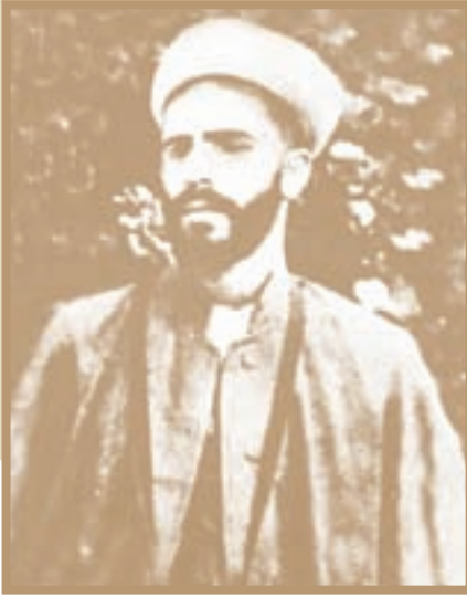
شیخ محمد خیابانی