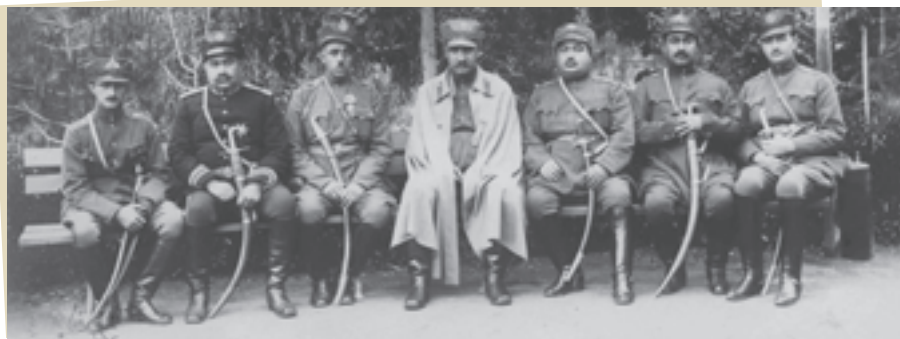
* رضاخان در میان جمعی از فرماندهان نظامی

سیاست مذهبی رضاخان قبل از سلطنت و در دوران سلطنت: رضاخان قبل از رسیدن به