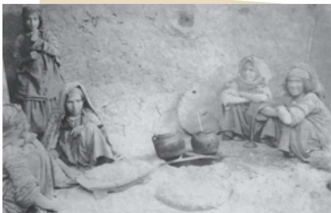
مردم قحطی‌زده ایران در دوران جنگ جهانی اول