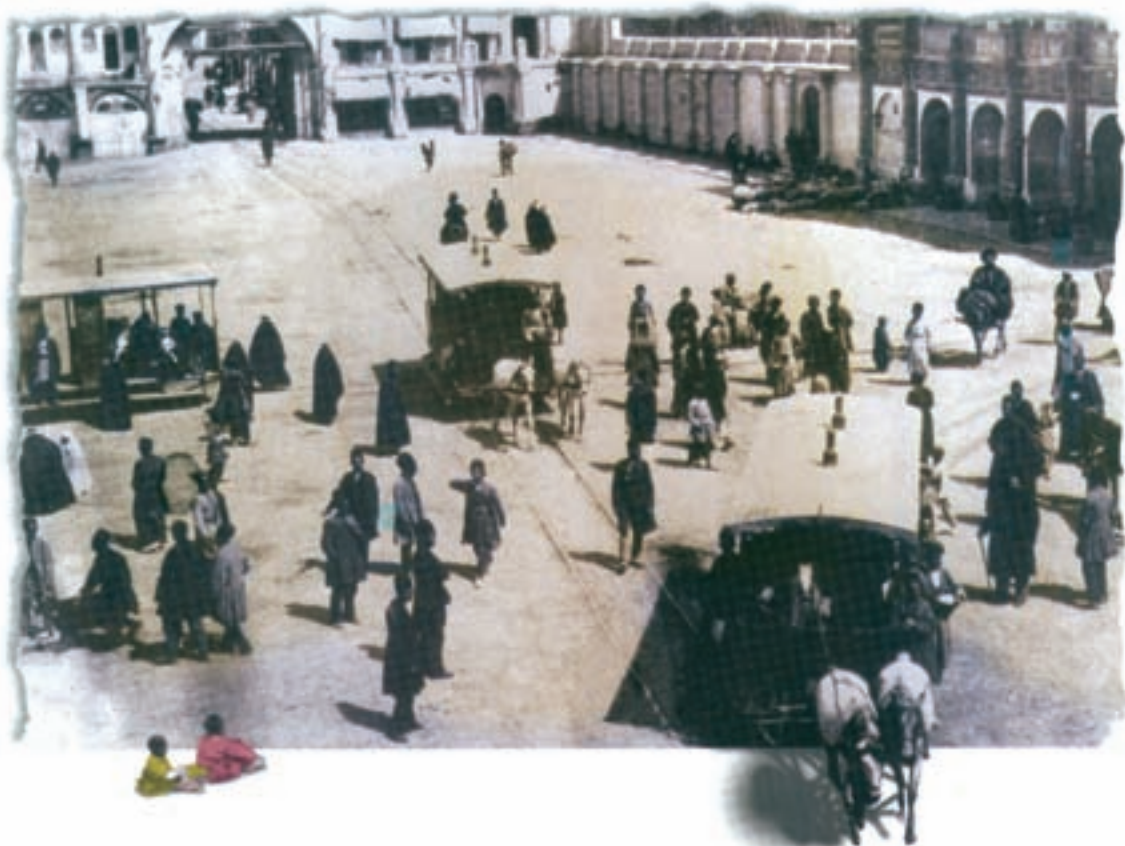
تهران - میدان توپخانه، ابتدای لاله‌زار (سال ۱۲۹۰ ش.)