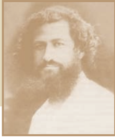
* میرزا کوچک خان جنگلی

در این میان، گروه‌هایی از مردم که خواهان استقلال کشور و اصلاح امور بودند، به مبارزه علیه بیگانگان و وابستگان آنها برخاستند. شیخ محمد خیابانی، محمد تقی خان پسیان و میرزا کوچک جنگلی از جمله رهبران این گروه‌ها بودند.