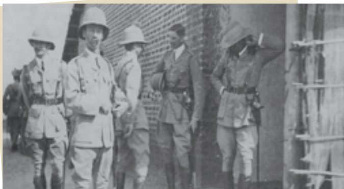
افسران انگلیسی مستقر در ایران در دوران جنگ جهانی اول

گرچه حکومت قاجار اراده و توان ایستادگی در برابر اشغالگران را نداشت، اما گروه‌هایی از مردم در نواحی جنوبی ایران مانند تنگستانی‌ها و دشتستانی‌ها به رهبری رئیسعلی دلواری در برابر متجاوزان ایستادند و با ایثار و از خود گذشتگی ضربه‌های سختی به نیروهای انگلیسی وارد کردند. بر اثر این جنگ، بسیاری از مردم ایران به خاطر سیاست انتقال آذوقه، توسط نیروهای روسی و انگلیسی گرفتار قحطی شدند و جان سپردند.