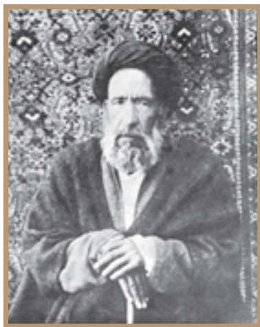
شهید آیت‌الله سیدحسین مدرّس

آیت‌الله سیدحسین مدرّس از جمله علمای بزرگی بود که در طول حیات خویش دست به مبارزه‌ای بی‌گیر با استبداد و استعمار زد. پس از فتح تهران و گشایش دوباره مجلس شورای ملی، مراجع نجف که مدرّس را شخصیتی صاحب صلاحیت در امور مذهبی و سیاسی می‌دانستند، به او و چندتن دیگر مأموریت دادند تا طبق متمم قانون اساسی به عنوان مجتهد طراز اول در جلسات مجلس شرکت کنند و بر مصوّبات آن نظارت داشته باشند. با آشکار شدن شخصیت مردمی مدرّس، مردم