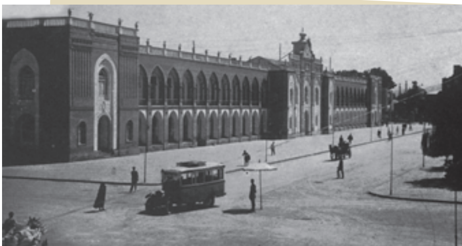
میدان توپخانه (امام خمینی کنونی) شهر تهران در دوران رضاشاه