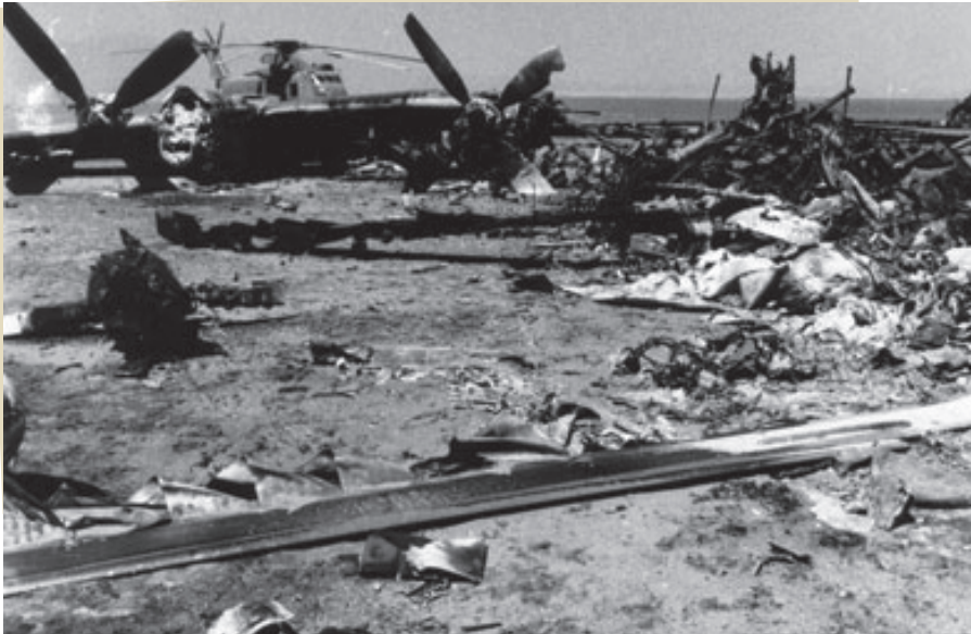
صحرای طبس : مدفن هلیکوپترها و هواپیماهای آمریکایی

و هلیکوپترهای جنگی آن کشور در صحرای طبس گرفتار طوفان شن شدند و نیروهای امریکایی با تحمل تلفات و خسارت فرار کردند.