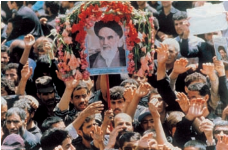
وداع جان‌سوز ملت با رهبر و امام خویش

امام خمینی پس از عمری مجاهدت علمی و مبارزه سیاسی برای سربلندی اسلام و استقلال ایران، سرانجام در ۱۴ خرداد ۱۳۶۸ به رحمت ایزدی پیوست. میلیون‌ها نفر پس از یک تشییع بی نظیر، پیکر ایشان را در بهشت زهراي تهران به خاک سپردند. امام، انقلابی را آغاز و رهبری کرد که به قول حضرت آیت الله خامنه‌ای «در هیچ کجای جهان بی نام او شناخته شده نیست».