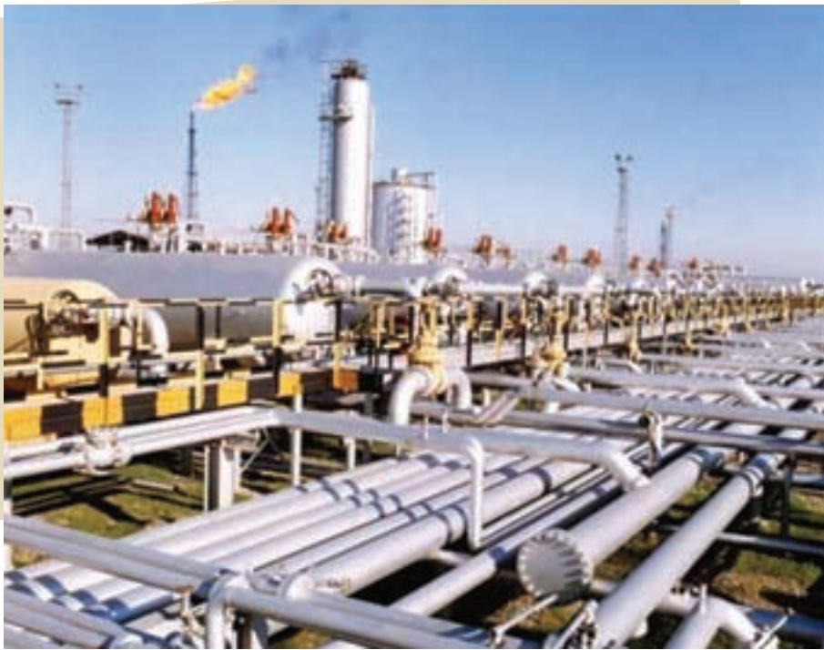
صنایع نفت و گاز بارس جنوبی مظهر توانمندی و عزم راسخ ملت ایران برای سازندگی ایران