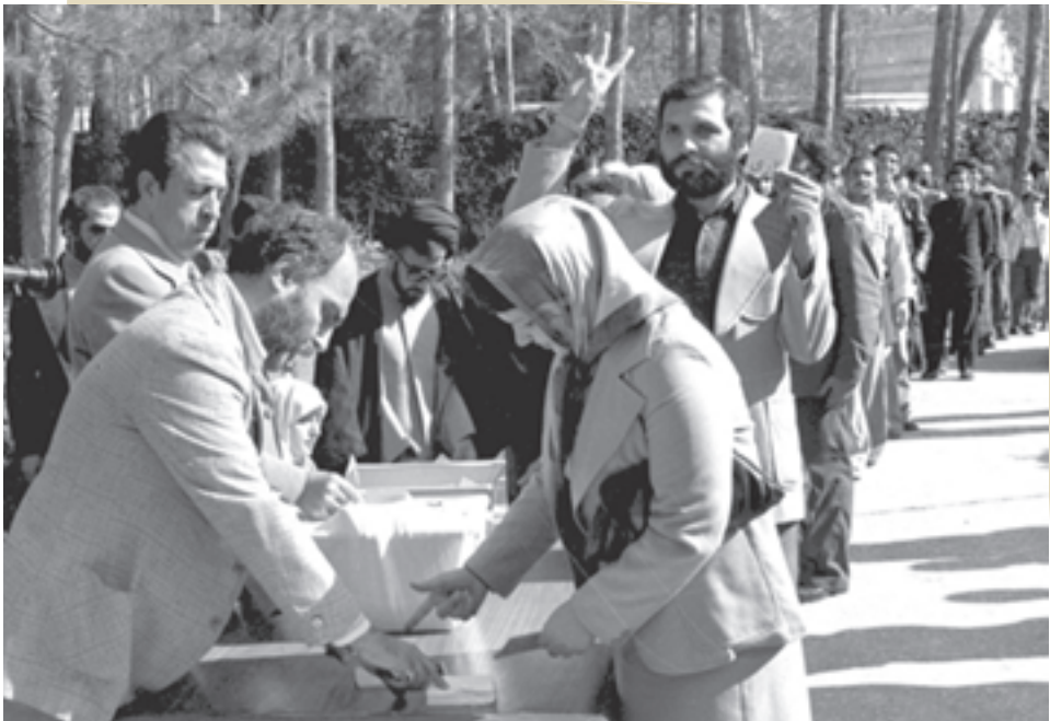
همه‌پرسی نظام جمهوری اسلامی ایران در فروردین ۱۳۵۸

در درس‌های گذشته خواندید که نهضت اسلامی از سال ۱۳۴۱ به رهبری امام خمینی (ره) آغاز شد و سرانجام، در ۲۲ بهمن ۱۳۵۷ به پیروزی رسید و حکومت پهلوی سقوط کرد. از فردای پیروزی انقلاب تلاش برای تحقق شعار «استقلال، آزادی، جمهوری اسلامی» با رهبری حکیمانه امام شروع شد.