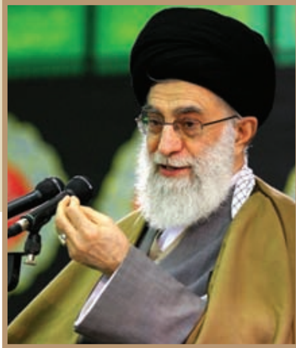
حضرت آیت الله سیدعلی خامنه‌ای مقام معظم رهبری