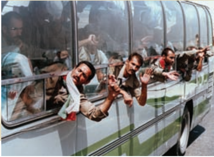
ورود آزادگان به میهن اسلامی