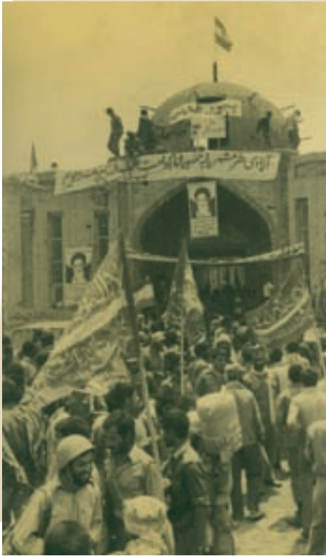
مسجد جامع خرمشهر، لحظاتی پس از آزادی از اشغال دشمن

آزادسازی مناطق اشغالی : نبرد رزمندگان ایرانی برای بیرون راندن متجاوزان بعثی از خاک ایران، به طور جدی، از مهرماه ۱۳۶۰ شروع شد. ابتدا نیروهای متحد بسیجی، سپاهی و ارتشی به فرمان امام، آبادان را از محاصره نجات دادند، سپس در عملیات فتح المبین، بخش وسیعی از سرزمین‌های اشغالی خوزستان را آزاد کردند. بعد از آن، در عملیات بیت المقدس که به فاصله کمی پس از عملیات فتح المبین انجام گرفت، خرمشهر بعد از ۱۸ ماه اشغال، روز سوم خرداد ۱۳۶۱ آزاد شد.