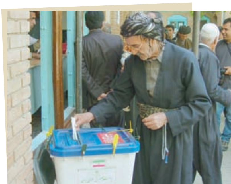
میزان رأی ملت است (امام خمینی)

۲- مشارکت ملت در اداره امور کشور: یکی دیگر از دستاوردهای انقلاب اسلامی، مشارکت حقیقی مردم در اداره کشور است. رئیس‌جمهور و نمایندگان مجلس شورای اسلامی، مجلس خبرگان رهبری و شورای شهر و روستا با رأی مستقیم مردم انتخاب می‌شوند. بالاترین مقام کشور، یعنی رهبر، نیز توسط نمایندگان مردم در مجلس خبرگان رهبری برگزیده می‌شود.