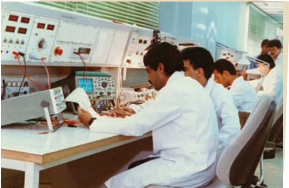
افتخار آفرینی مستمر دانشمندان جوان ایرانی

۲- شکوفایی علمی: انقلاب اسلامی علاوه بر تقویت بنیان‌های معنوی جامعه، موجب شکوفایی علم و دانش نیز شد. نرخ بی‌سوادی در سال‌های پس از پیروزی انقلاب اسلامی به‌طور چشمگیری کاهش یافت؛ تحصیلات دانشگاهی رشد و توسعه بسیاری داشته است و در رشته‌های مختلف علمی و فنی، به ویژه دانش پزشکی پیشرفت و موفقیت‌های زیادی حاصل شده است. دانشمندان جوان ایرانی با وجود فشارها و تحریم‌های آمریکا و هم‌بیمانانش، دانش هسته‌ای بومی و چرخه کامل سوخت هسته‌ای را بنیان نهادند؛ مراحل تهیه سوخت هسته‌ای از اورانیوم، بسیار پیچیده و ظریف است. دانش انجام این کار از