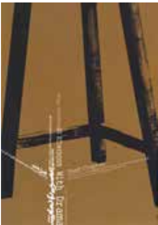
نمونه‌ی استفاده از ترکیب‌بندی مثلثی در یک پوستر (راس مثلث خارج از کادر واقع شده است).

آثاری که دارای ترکیب‌بندی مثلثی هستند، عموماً از استحکامی استثنایی برخوردارند. هنرمندان رشته‌های مختلف هنری در بسیاری از موارد از استحکام و ساختار منسجم مثلث، برای ترکیب‌بندی سود برده و کیفیت آن‌را با نیاز تصویر مورد نظر خود منطبق کرده‌اند.