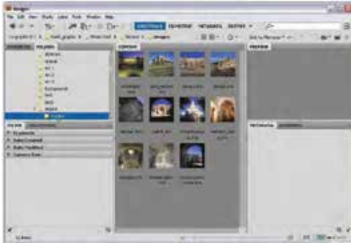
شکل ۲-۱۶- نحوه باز کردن فایل‌ها در پنجره Bridge

در این روش برای باز کردن فایل‌های تصویری از دستور Browse in Bridge در منوی File استفاده می‌کنیم که در این حالت نرم‌افزار Adobe Bridge باز خواهد شد. (شکل ۲-۱۶) البته این برنامه از طریق منوی Start گزینه All Program نیز قابل دسترسی است.