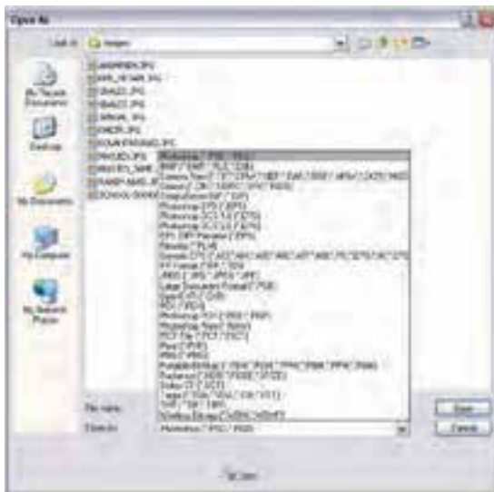
شکل ۱۶-۱ پنجره Open as و فرمت فایل ها

نکته: با استفاده از منوی File | Open as می توان فایل ها را با فرمت مشخص باز کرد. به طوری که اگر دقت کرده باشید با باز شدن پنجره Open As و انتخاب فرمت فایل مورد نظر لیست تمامی فایل ها با فرمت های مختلف نمایش داده می شود (برخلاف Open که با انتخاب نوع فرمت فقط فایل های با فرمت تعیین شده نمایش داده می شوند) که می توان فایل مورد نظر را باز کرد. (شکل ۱۶-۱)