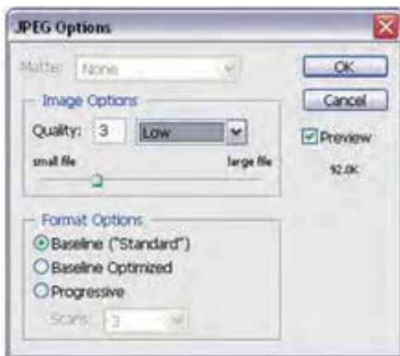
شکل ۴-۱۶- تغییر کیفیت فایل با فرمت JPG