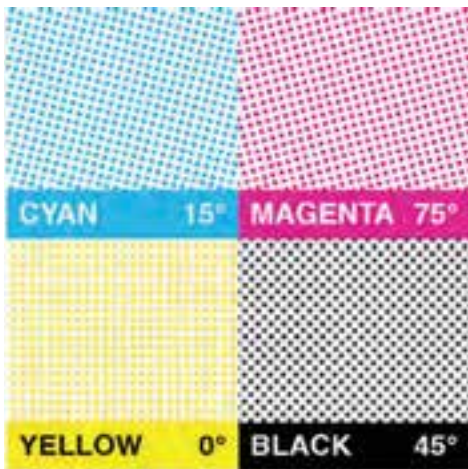
شکل ۱-۲۷ چهار تصویر تفکیکی مد CMYK

۲. برای قرار دادن منظم نقاط در عمل تفکیک رنگ، آن‌ها را روی خطوطی مستقیم تحت زاویه مشخصی پشت سر هم قرار می‌دهند. برای آگاهی از زوایای هر یک از ترام‌های رنگی به شکل زیر توجه کنید (شکل ۲-۲۷)