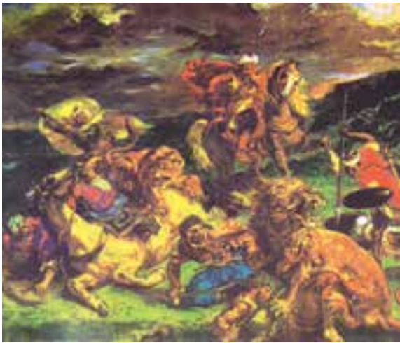
قسمتی از پرده‌ی شکار شیر، دلاکروا، اکسپرسیونیست