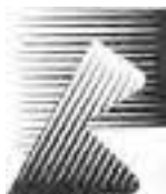
نشانه نوشته‌ی شرکت بی. بی طراح: نورالدین زرین کلک

خطوط عمودی، افقی، مایل و منحنی می‌توانند در مسیر حرکت خود دارای شرایط زیر باشند که برای آشنایی بیش‌تر شما با چگونگی استفاده از تغییرات انواع خطوط در طول مسیر حرکت، نمونه‌هایی از کارهای گرافیک را نیز در این‌جا می‌آوریم. ۱. ضخیم یا نازک، قوی یا ضعیف، تیره یا روشن شوند.