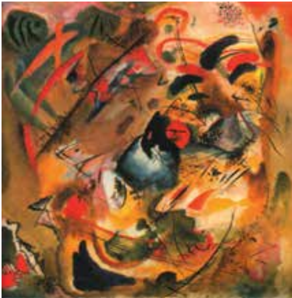
بدیه‌نگاری، واسیلی کاندینسکی، سبک انتزاعی