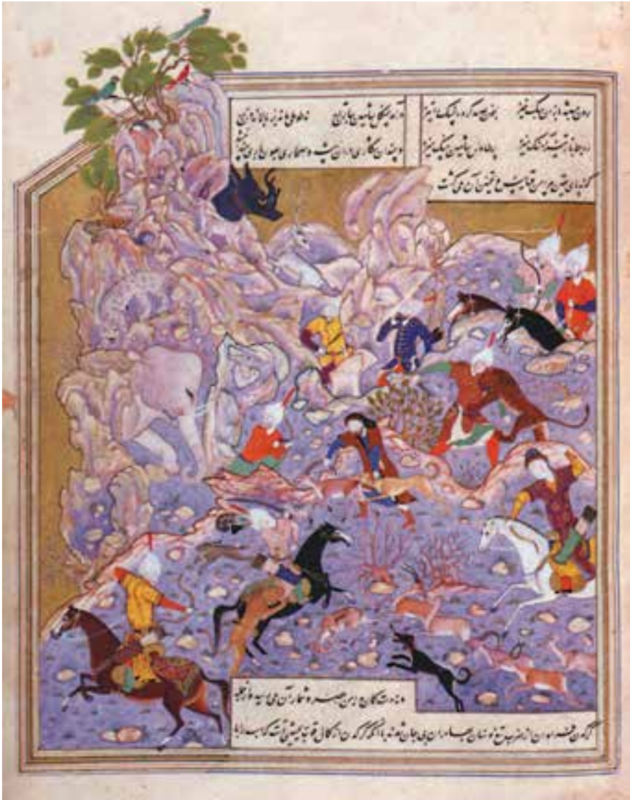
صحنه‌ی شکار، نقاشی ایرانی، مکتب تبریز