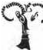
نشانه‌ی انتشارات مارلیک طراح: نیلوفر وکیل بهرامی

۳. می‌توانند در جهت مسیر اصلی خود به‌صورت بریده بریده یا ممتد باشند.