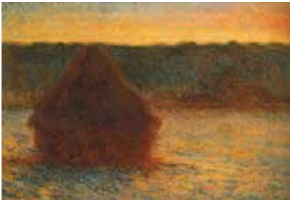
تل علف درغروب آفتاب، کلود مونه، امپرسیونیست