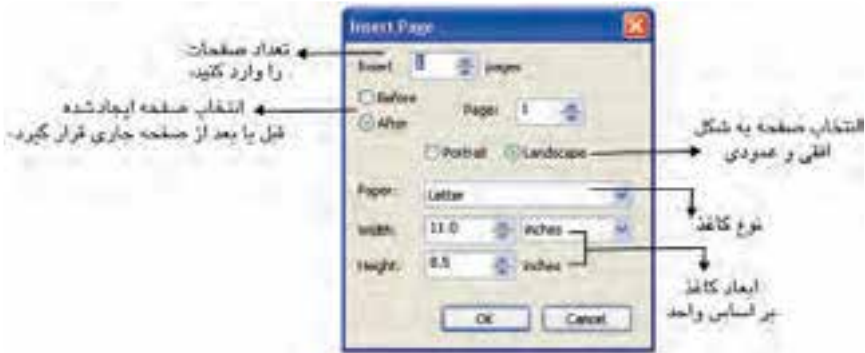
شکل ۳-۴ کادر محاوره Insert Page