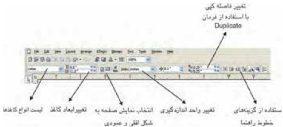
شکل ۲-۳ نوار ویژگی‌ها برای تنظیمات صفحه طراحی

نکته: همان‌طور که گفتیم این نوار (Property Bar) امکان ایجاد تغییرات در اشیاء و ابزارهای انتخابی را به شما می‌دهد.