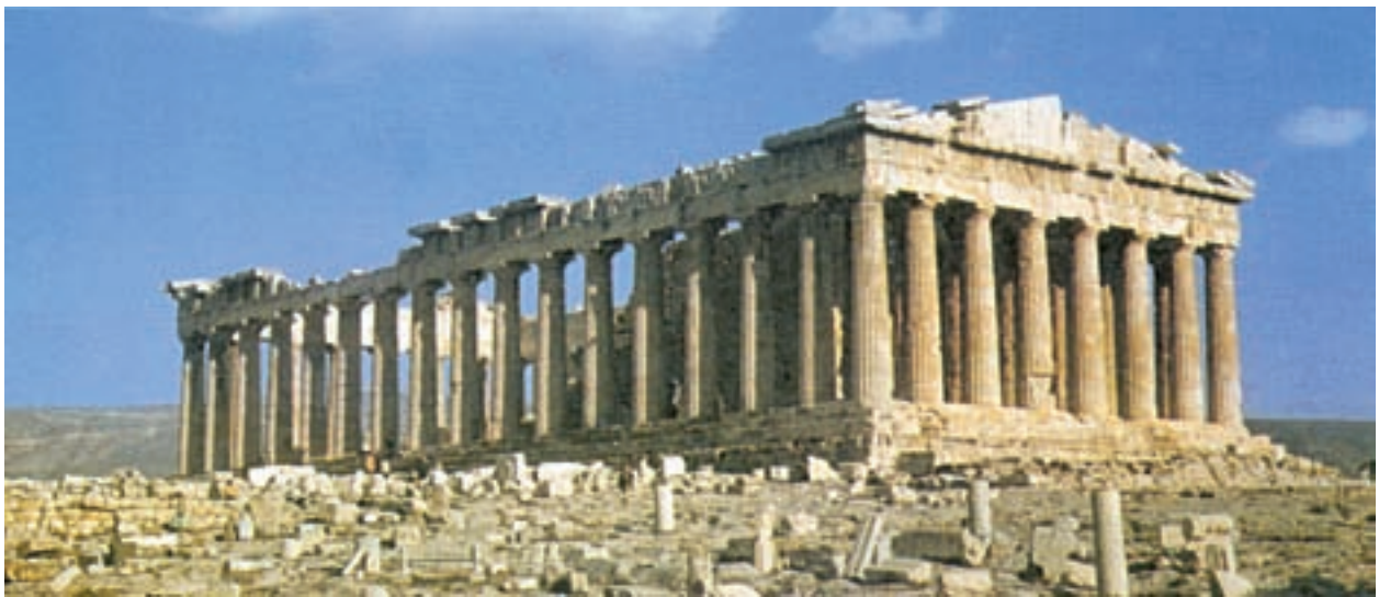
بنای پارتون یکی از آثار تاریخی مشهور که از یونان باستان به جامانده است.

رشد و رونق به سزایی یافت. یونانیان اغلب ساختمان‌های خود را از چوب و آجر می‌ساختند، بعدها برای بنای معابد بزرگ و کاخ‌ها از سنگ استفاده کردند. موسیقی و تئاتر نیز در میان یونانیان رواج زیادی داشت. علم و فلسفه: علم و فلسفه در یونان باستان پیشرفت زیادی کرد؛ زیرا: