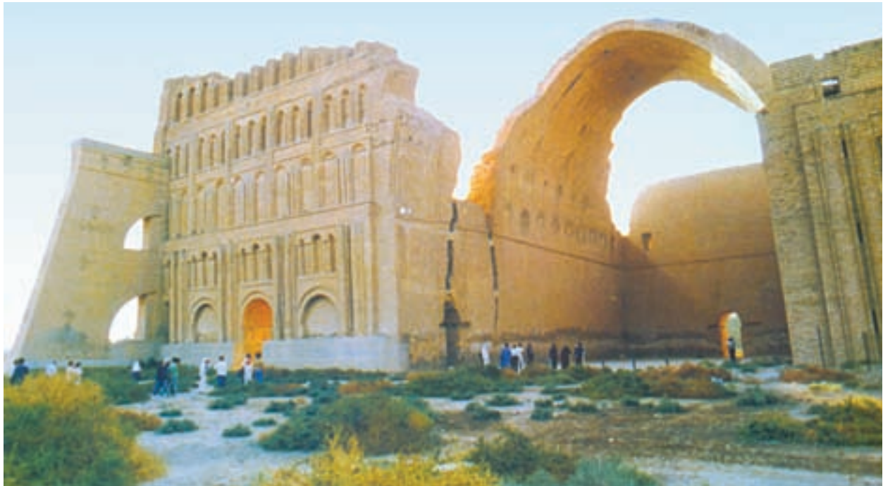
طاق کسری یا ایوان مداین مشهورترین اثر به‌جامانده از عصر ساسانی است که در کشور عراق امروزی قرار دارد. این بنا در فرهنگ و ادبیات ایرانیان به‌عنوان مظهر ناپایداری اوضاع جهان شناخته شده است.

قباد نیز وارث مشکلات بسیاری بود. البته برای حل آن‌ها تلاش کرد اما توفیق زیادی نیافت. هم زمان با روی کار آمدن قباد، جنگ‌های مکرر در شرق و غرب ایران ساسانیان را سر درگم کرده بود. به علاوه کشمکش با بزرگان که مدام در امور کشور دخالت می‌کردند و برای کسب قدرت با یک‌دیگر به رقابت می‌پرداختند، شاهان ساسانی را دچار زحمت می‌کرد. از طرفی، مالیات‌های سنگین و ستم بر مردم، پریشانی اوضاع را بدتر می‌ساخت. وقوع خشک‌سالی نیز بر مشکلات افزود و قباد را در وضعیت سختی قرار داد. در چنین شرایطی مزدک ظهور کرد. او خود از اشراف بود اما اندیشه‌های تازه‌ای درباره‌ی شیوه‌ی اداره‌ی کشور مطرح کرد؛ از جمله، خواهان توزیع آذوقه در میان مردم قحطی‌زده و کاهش قدرت بزرگان (فرماندهان نظامی، زمینداران و...) بود. قباد، مزدک را وسیله‌ای برای کاهش قدرت بزرگان دید؛ بنابراین، او را به خود نزدیک کرد اما گروهی از بزرگان که وجود مزدک را به زیان خود می‌دیدند با طرح این شعار که مزدک از اصول دین زردشتی منحرف شده است، علیه او و