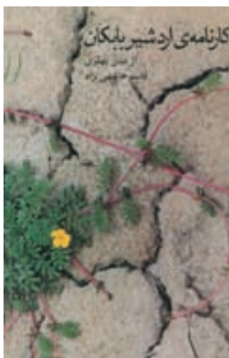
کارنامه‌ی اردشیر بابکان، کتابی است که سرگذشت اردشیر را بیان می‌کند.

اردشیر بابکان بنیان‌گذار حکومت ساسانیان است. او نزد مورّخانی که در قرن‌های نخستین هجری می‌زیستند، پادشاهی خوش‌نام است. جدّ او، ساسان، موبدی زردشتی بود که ریاست معبد آنها را در پارس به عهده داشت. از این رو، خاندان ساسان در پارس از نفوذ و احترام لازم