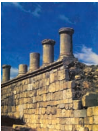
تصویری از معبد آناهیتا در کنگاور

همان‌گونه که گفته شد، از دوره‌ی اشکانی هم سنگ نوشته و هم پوست نوشته‌ها و نیز نوشته‌هایی بر روی ظروف سفالین باقی مانده که نشان‌دهنده‌ی خطّ رایج در آن زمان است. این نوشته‌ها هم به خطّ یونانی و هم به خطّ پهلوی اشکانی است. منشأ خطّ پهلوی اشکانی، خطّ آرامی بود که توسط دبیران نگاشته می‌شد. ظروف سفالی که به ویژه در نسا در نزدیکی عشق‌آباد کنونی، یافت شده، کمک ارزشمندی به شناخت تاریخ و فرهنگ عصر اشکانی کرده است.