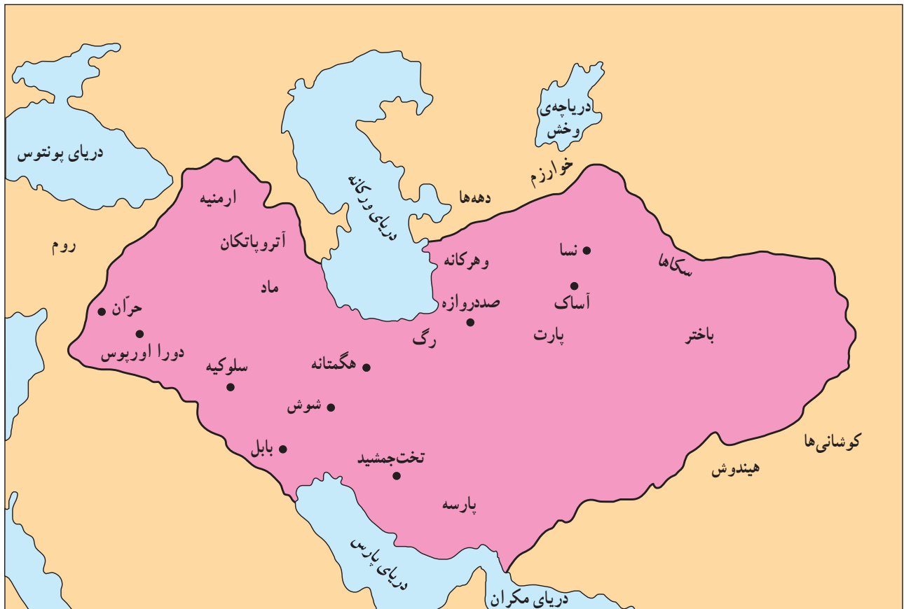
قلمرو ایران در زمان اشکانیان

مهرداد، قلمرو اشکانیان را در شرق و غرب وسعت داد. مورخان مسلمان، حکومت اشکانیان را ملوک الطوائف نامیده‌اند؛ زیرا در طول حکومت آنان، پادشاهان مناطقی هم‌چون ارمنستان، آذربایجان و پارس از استقلال داخلی برخوردار بودند و فقط هنگام جنگ به کمک شاه اشکانی می‌آمدند.