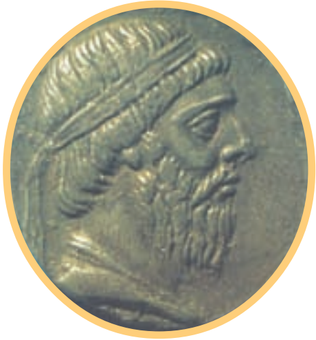
سکه‌ی نقره مربوط به زمان مهرداد اول یکی از پادشاهان معروف اشکانی

از آن پس، پارت‌ها بر متصرفات خود افزودند و به تدریج به سوی غرب پیشروی کردند. تیرداد، برادر و جانشین اشک، در تثبیت حکومت اشکانی نقش زیادی داشت.