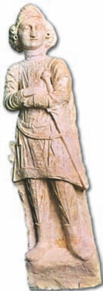
مجسمه‌ای از سنگ آهک مربوط به دوره‌ی اشکانی (قرن دوم میلادی)

دو کشور محدود نمی‌شد و جنبه‌های فرهنگی نیز داشت.