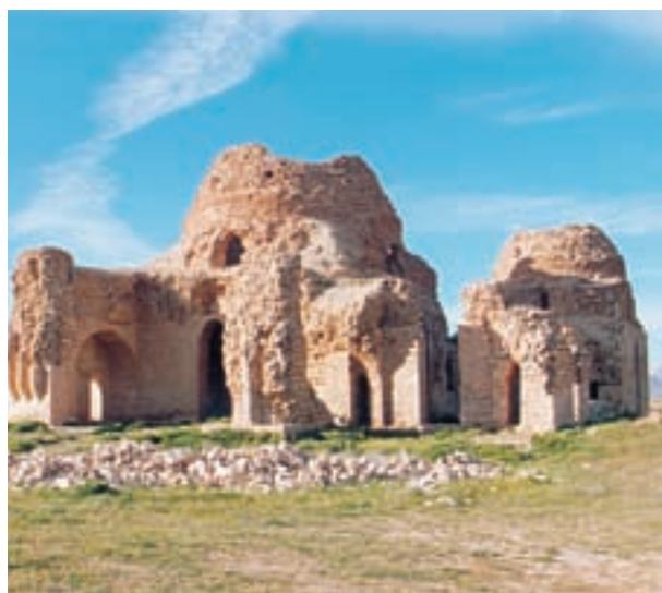
بقایای یک کاخ مربوط به دوره‌ی ساسانیان در سروستان فارس

برپا کرد و به جنگ رومیان رفت؛ زیرا دولت روم که خبر سقوط اشکانیان را شنیده بود، فرصت را مغتنم شمرده و در امور ارمنستان دخالت می‌کرد. او قصد داشت در آن جا حکومتی دست‌نشانده ایجاد کند. (سرنوشت جنگ ایران و روم در زمان جانشین اردشیر، شاپور اول، روشن شد.)