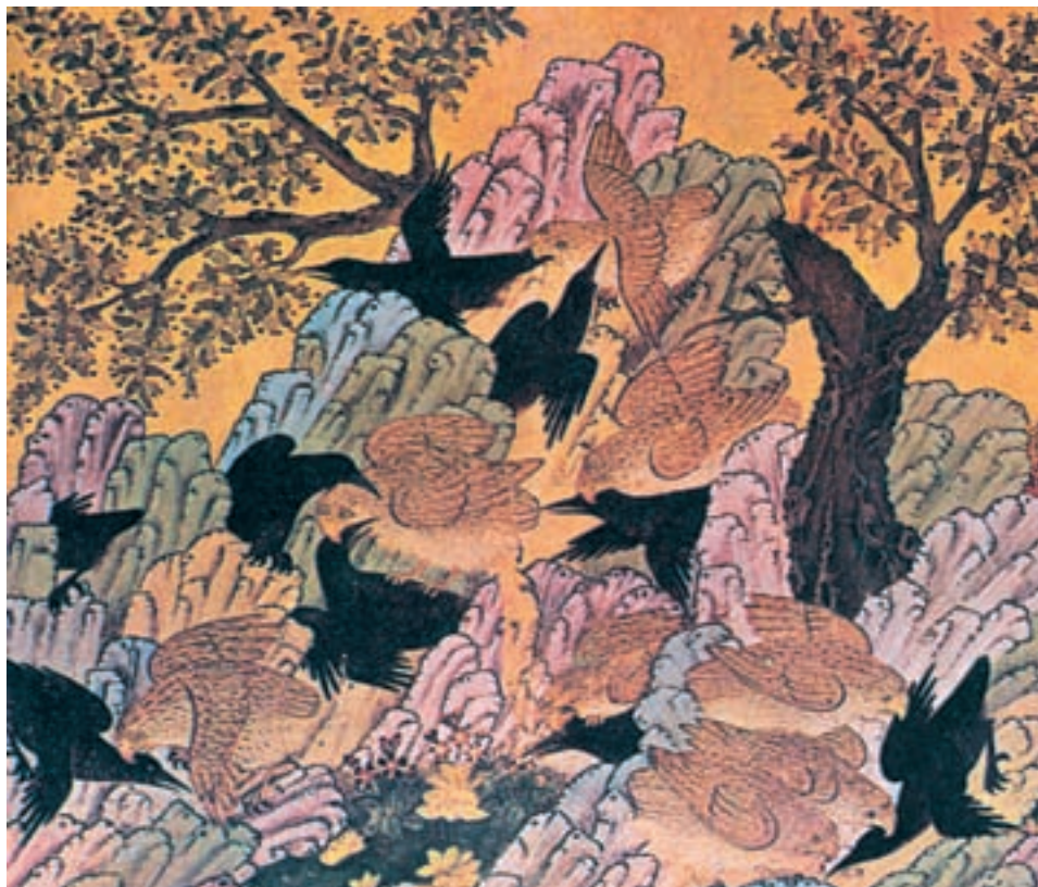
مینیاتوری از کلیله و دمنه، داستان زاغان و بومان، مکتب هرات

نثر کتاب از لحاظ استواری انشا و ترکیب عبارات و داشتن اسلوب عالی و آراستگی