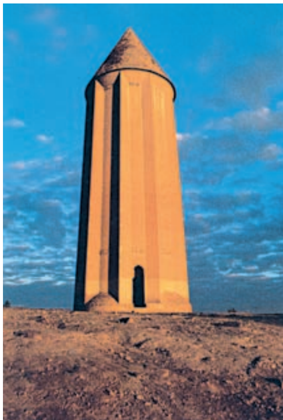
مقبره‌ی قابوس بن وشمگیر در شهر گنبد کاووس

الف) قابوس‌نامه: عنصرالمعالی، کیکاووس بن اسکندر بن قابوس وشمگیر، از شاهزادگان خاندان زیاری است که پدرانش در نواحی شمالی ایران حکومت داشتند. خود او به حکومت نرسید اما از تربیت امیرزادگان و یک زندگی نسبتاً مرفه برخوردار بود و از دانش‌ها و فنون و پیشه‌های روزگار آگاهی داشت. مجموعه‌ی این دانی‌ها در وجود این امیر روشن ضمیر به بار نشسته بود و او حاصل تجربه‌های خود را در سنّ شصت و سه سالگی، در کتابی به نام قابوس‌نامه برای نشان دادن راه و رسم زندگی به فرزند خود، گیلان‌شاه به یادگار گذاشت. در این کتاب، تأثیر متون آموزشی پیش از اسلام آشکار است.