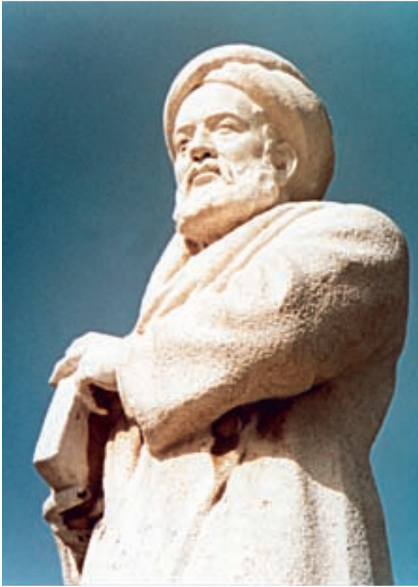
مجسمه‌ی ابوعلی سینا (همدان)

(ب) التّفهیم لاوایل صناعة التّنجم: نام ابوریحان محمد بن احمد بیرونی (فوت: ۴۴۰ ه.ق.) دانشمند بزرگ و استاد ایرانی اهل خوارزم بر تارک علم و معرفت قرن‌های چهارم و پنجم هجری می‌درخشد. او بیش‌تر آثار گران‌قدر خویش را در زمینه‌های طب، جغرافی، ریاضی و فلسفه به زبان عربی تألیف کرده است اما کتاب التّفهیم را ابتدا به خواهش ریحانه، دختر حسین خوارزمی، یکی از رجال دانش‌دوست معاصر خود در سال ۴۲۰ ه.ق. به فارسی نوشته و بعداً آن را به عربی درآورده است. این کتاب اوّلین و مهم‌ترین کتابی است که خاصّ علم نجوم و هندسه و حساب به فارسی نوشته شده و از آن‌جا که نویسنده‌ی آن یکی از دانشمندانِ بنام در این رشته است، اهمّیت و اعتبار خاصّی یافته است.