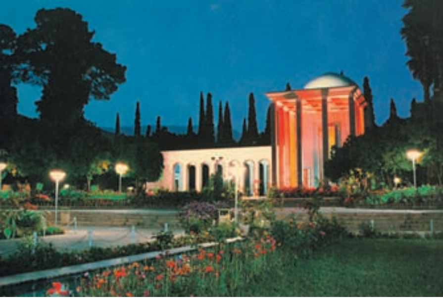
نمایی از مقبره‌ی سعدی (شیراز)

ت) گلستان: ابتکارات و رهیابی‌های ممتاز مصلح‌الدین سعدی، شیخ فرزانه‌ی شیراز، به قلمرو شعر فارسی منحصر نمی‌ماند. او چنان که خود یک بار به حق اشاره کرده، فرمانروای مسلم مُلکِ سخن – اعمّ از شعر و نثر – است. قوه‌ی ابتکار شگرف و شیوه‌ی بی‌همتا و اسلوب سهلِ ممتنعی که سعدی در تنظیم گلستان به کار برده است، کم‌تر از بوستان و غزلیات وی نیست.