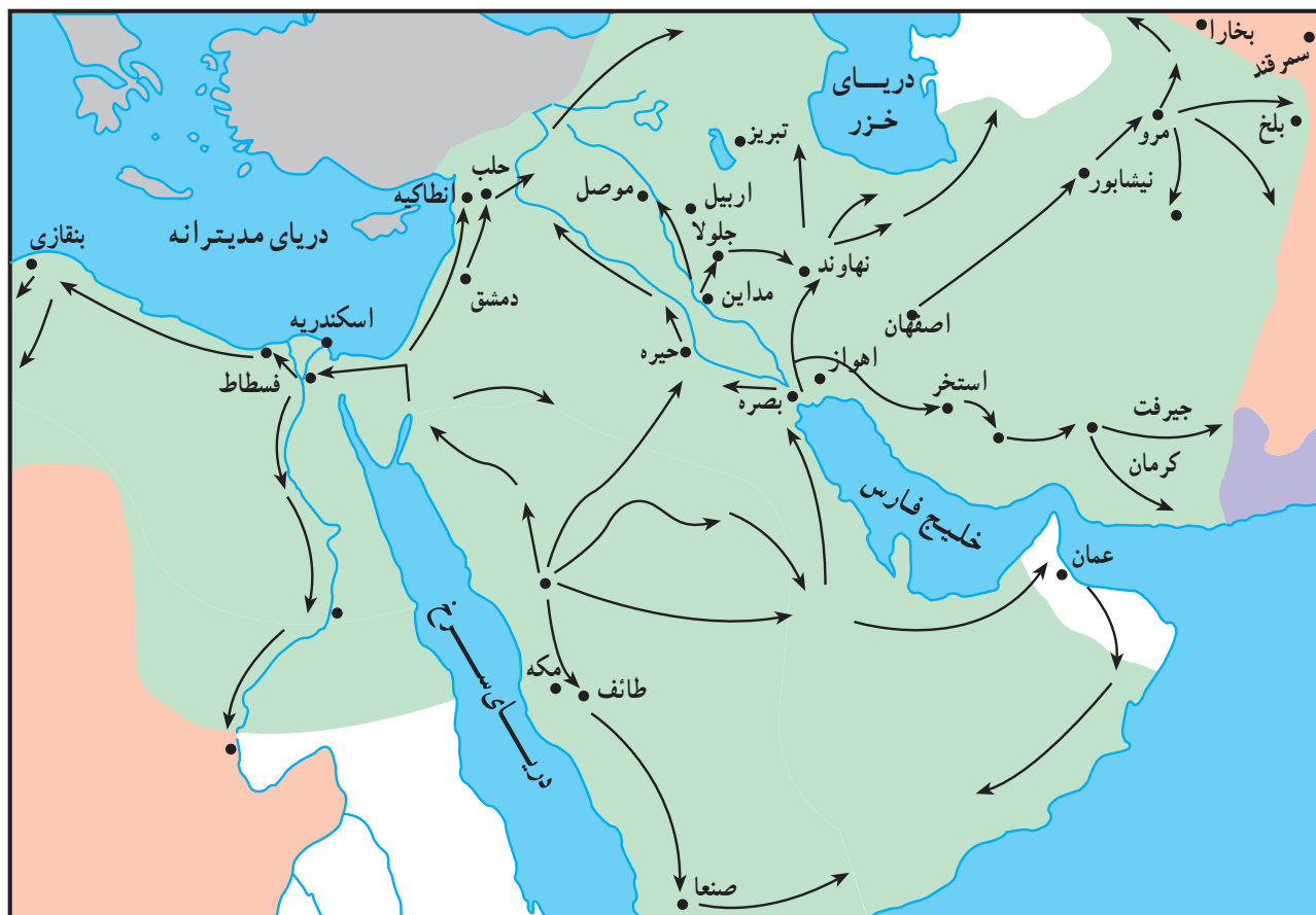
گسترش قلمرو مسلمانان

۳- رفتار انسانی و صلح طلبانه‌ی سرداران سپاه اسلام: مردم سرزمین‌هایی که مورد حمله‌ی سپاهیان مسلمان واقع می‌شدند، اجازه داشتند با پرداخت مالیاتی تحت عنوان جزیه بر دین خود باقی بمانند و در امنیت کامل جامعه‌ی اسلامی قرار بگیرند. ساکنان شهرها و روستاهای زیادی در ایران، مصر و شام به این طریق با مسلمانان به توافق رسیدند.