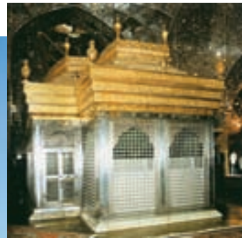
حرم و مرقد مطهر حضرت امام حسین (ع) در کربلا

سجاد (ع) - که سخت بیمار بود - در طول مسیر و در کوفه و شام با خطبه‌های خود، پیام نهضت حسینی، فرجام بد ظالمان و تکلیف مسلمانان و همه‌ی انسان‌های شرافتمند را با عزت و سربلندی بیان داشته، مانع فراموشی حقیقت حماسه‌ی دینی و تاریخی کربلا شدند.