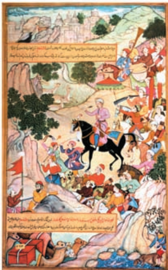
غازان خان در حال خروج از شهر تبریز

دوره‌ی حکومت غازان خان از جهات مختلف، در تاریخ ایران در عصر مغول، اهمیت دارد؛ از جمله آن که غازان خان علاوه بر مسلمان شدن، تابعیت از خان بزرگ مغول را نیز کنار گذاشت و بدین ترتیب استقلال حکومت ایلخانی را کامل کرد. در چنین شرایطی زمینه برای حضور گسترده‌تر ایرانیان در صحنه‌ی سیاسی آماده شد. غازان خان که اکنون خود را پادشاه یک کشور مسلمان می‌دانست، با راهنمایی وزیران و مشاوران ایرانی خویش به‌ویژه خواجه رشیدالدین فضل‌الله همدانی از اقدامات اصلاحی حمایت کرد. در زمینه‌ی سیاسی بر یک پارچگی حکومت ایلخانی افزوده و به شورش‌های داخلی و خودسری بعضی حکام و سرداران پایان داده شد. برای اداره‌ی بهتر سپاه و جلوگیری از غارتگری‌های سپاهیان، قواعدی وضع شد که از جمله تعیین مقرری برای سربازان و واگذاری زمین‌هایی به فرماندهان بود. مسأله‌ی مالیات‌ها که تا این زمان یکی از مشکل‌سازترین مسائل بود و به‌ویژه