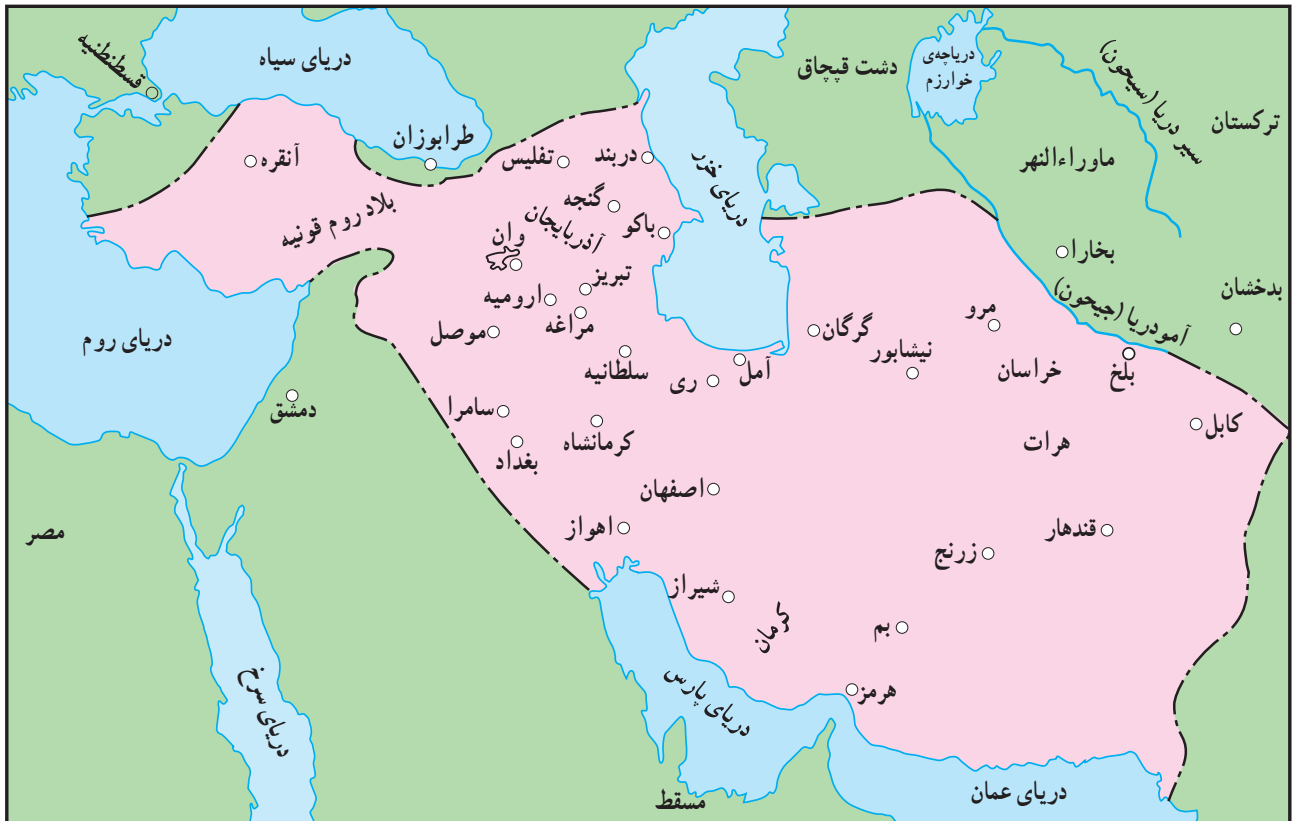
قلمرو ایلخانان در زمان غازان خان