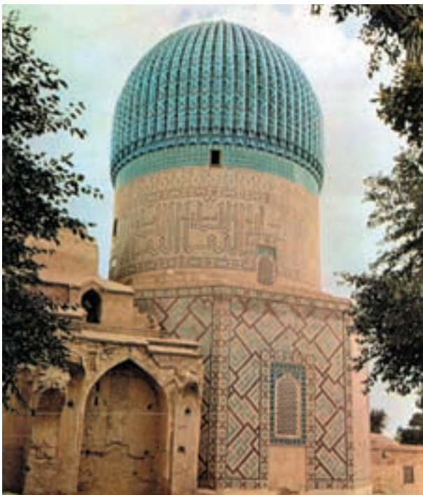
مقبره‌ی تیمور در سمرقند

تیمور در جریان واپسین لشکرکشی خود به غرب ایران، که در سال‌های نخست قرن نهم هجری صورت گرفت، متوجه آسیای صغیر شد و در آن‌جا با سلطان بایزید فرمان‌روای عثمانی ۱ جنگید و بر او پیروز شد. در جریان این حمله شهرهای دمشق و بغداد به تصرف تیمور درآمد و او تا نزدیکی مرزهای مصر پیشروی کرد. تیمور در اواخر عمر به فکر حمله به چین افتاد تا با تصرف آن‌جا به آرزوی خود در تسلط بر تمامی متصرفات چنگیزیان جامه‌ی عمل بپوشاند؛ اما در بین راه در شهر اترار یعنی همان نقطه‌ی آغاز حملات چنگیز به سوی ایران، از دنیا رفت.