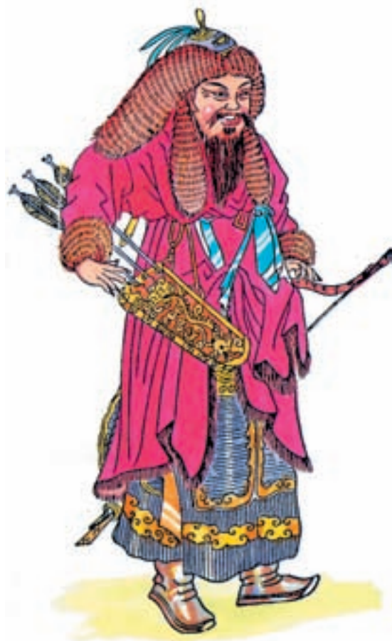
چنگیزخان از نگاه یک طراح چینی

مغول با عبور از دیوار چین قسمت‌های شمالی چین را تصرف کردند. شهرها و روستاهای چین یکی پس از دیگری عرصه‌ی یورش‌های گسترده‌ی مغولان شد. شهر پکن به آتش کشیده شد و بیش‌تر ساکنان آن قتل‌عام شدند. چنگیزخان پس از تصرف چین شمالی به مغولستان بازگشت. در این زمان سپاهیان او با آموختن بعضی فنون جدید جنگی از چینی‌ها، از قبیل نحوه‌ی محاصره‌ی شهرها و استفاده از منجنیق و باروت، آمادگی بیش‌تری برای حمله به سرزمین‌های دیگر داشتند. پس از چین، چنگیزخان متوجه ترکستان در غرب مغولستان شد. چنگیزخان توانست قبایل ترک را نیز به اطاعت خود وادارد. در جریان پیشروی در ترکستان بود که مغولان برای نخستین بار با سپاهیان خوارزمشاهی برخورد کردند. کمی بعد که واقعه‌ی اترار یعنی کشته شدن بازرگانان اعزامی از سوی چنگیزخان رخ داد و بهانه‌ی لازم برای حمله‌ی مغولان به ایران فراهم شد؛ حمله‌ای که نه تنها طومار حکومت خوارزمشاهی را درهم پیچید بلکه مسیر تحول تاریخ ایران را نیز عوض کرد.