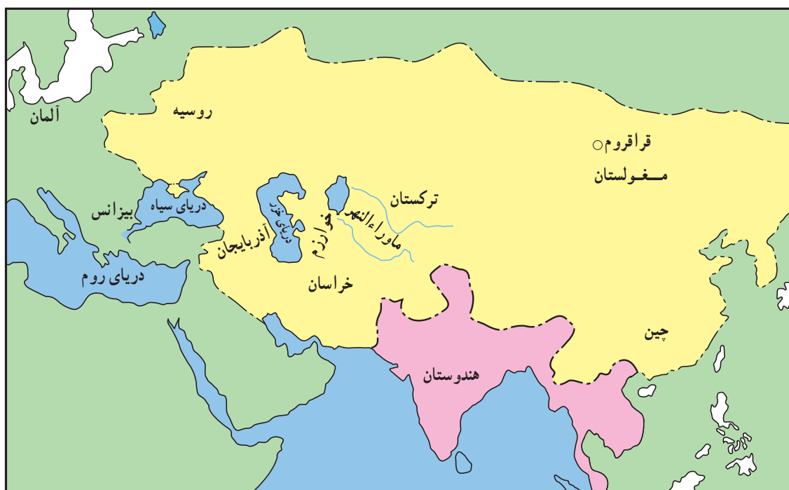
امپراتوری مغولان در اوج گسترش

مغول با عبور از دیوار چین قسمت‌های شمالی چین را تصرف کردند. شهرها و روستاهای چین یکی پس از دیگری عرصه‌ی یورش‌های گسترده‌ی مغولان شد. شهر پکن به آتش کشیده شد و بیش‌تر ساکنان آن قتل‌عام شدند. چنگیزخان پس از تصرف چین شمالی به مغولستان بازگشت. در این زمان سپاهیان او با آموختن بعضی فنون جدید جنگی از چینی‌ها، از قبیل نحوه‌ی محاصره‌ی شهرها و استفاده از منجنیق و باروت، آمادگی بیش‌تری برای حمله به سرزمین‌های دیگر داشتند. پس از چین، چنگیزخان متوجه ترکستان در غرب مغولستان شد. چنگیزخان توانست قبایل ترک را نیز به اطاعت خود وادارد. در جریان پیشروی در ترکستان بود که مغولان برای نخستین بار با سپاهیان خوارزمشاهی برخورد کردند. کمی بعد که واقعه‌ی اترار یعنی کشته شدن بازرگانان اعزامی از سوی چنگیزخان رخ داد و بهانه‌ی لازم برای حمله‌ی مغولان به ایران فراهم شد؛ حمله‌ای که نه تنها طومار حکومت خوارزمشاهی را درهم پیچید بلکه مسیر تحول تاریخ ایران را نیز عوض کرد.