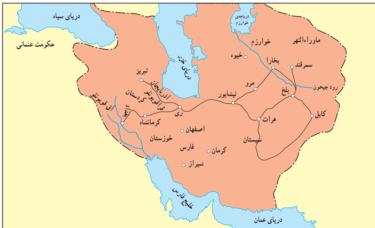
قلمرو تیموریان در زمان شاه‌رخ

قلمرو تیمور بعد از مرگش به سرعت تجزیه شد. بروز اختلاف میان فرزندان و نوادگان او و شورش‌های مردم و بعضی قدرتمندان محلی عامل اصلی این وضع بود. پس از چند سال کش‌مکش میان اعضای خاندان تیموری، سرانجام شاه‌رخ پسر تیمور که در خراسان به سر می‌برد، توانست حکومت را به دست بگیرد. او پایتخت را از سمرقند به هرات منتقل کرد. شاه‌رخ اگرچه بر همه‌ی متصرفات پدرش تسلط نداشت، اما در مجموع شاه‌زادگان تیموری از او اطاعت می‌کردند. در زمان فرمان‌روایی شاه‌رخ دگرگونی‌های قابل توجهی در سیاست‌های حکومت تیموری به وجود آمد. او که خود سال‌ها در محیط فرهنگی و تمدنی ایرانی زیسته و تحت تأثیر آن قرار گرفته بود، سیاست‌های توسعه طلبانه‌ی پدر را کنار گذاشت و به برقراری آرامش و امنیت و توسعه‌ی علم و فرهنگ توجه