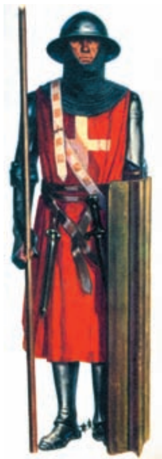
یک جنگ‌جوی صلیبی

۴- نبرد ملازگرد: در چنین شرایطی پیروزی برق‌آسای سلجوقیان بر روم شرقی (بیزانس) در جنگ ملازگرد ۱۰۷۱ م / ۴۶۳ هـ. ق رخ داد. امپراتور بیزانس که قسمت‌های وسیعی از قلمرو خود در آسیای صغیر را از دست داده بود از پاپ علیه مسلمانان کمک خواست و این برای پاپ فرصت مناسبی بود تا کلیسای بیزانس را که از سال ۱۰۵۵ م / ۴۴۷ هـ. ق از کلیسای رم جدا شده بود بار دیگر تحت فرمان خود درآورد. کلیسای بیزانس بر خود نام ارتدوکس ۲ گذاشته بود و کلیسای رم نام کاتولیک ۳ . پاپ به تقاضای کمک امپراتور بیزانس پاسخ مثبت داد و بدین ترتیب جنگ‌های صلیبی آغاز شد.