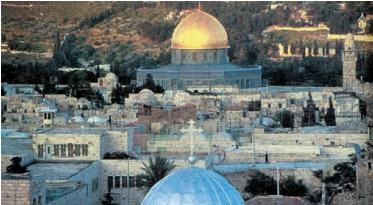
با فرمان پاپ اوربان دوم صلیبی‌ها برای تصرف بیت‌المقدس به حرکت درآمدند.

در سال ۱۰۹۶ م / ۴۹۰ هـ پاپ اوربان دوم ۱ فرمان جنگ علیه مسلمانان را، برای تصرف بیت‌المقدس، صادر کرد. در پی آن جمعیت بزرگی از نواحی غربی و مرکزی اروپا به طرف بیزانس به راه افتادند تا از آن طریق خود را به این شهر کهن برسانند. این عده که اغلب روستاییان و شوالیه‌ها بودند به شکل ارتش بی‌نظم و فاقد یک فرماندهی مشخص در مسیر خود بسیاری از روستاها و مزارع را