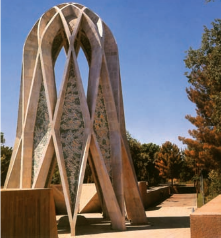
نیشابور، آرامگاه خیتام