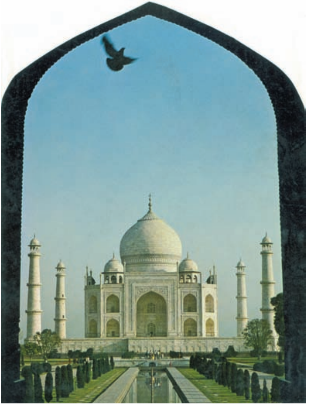
تاج محل — هندوستان