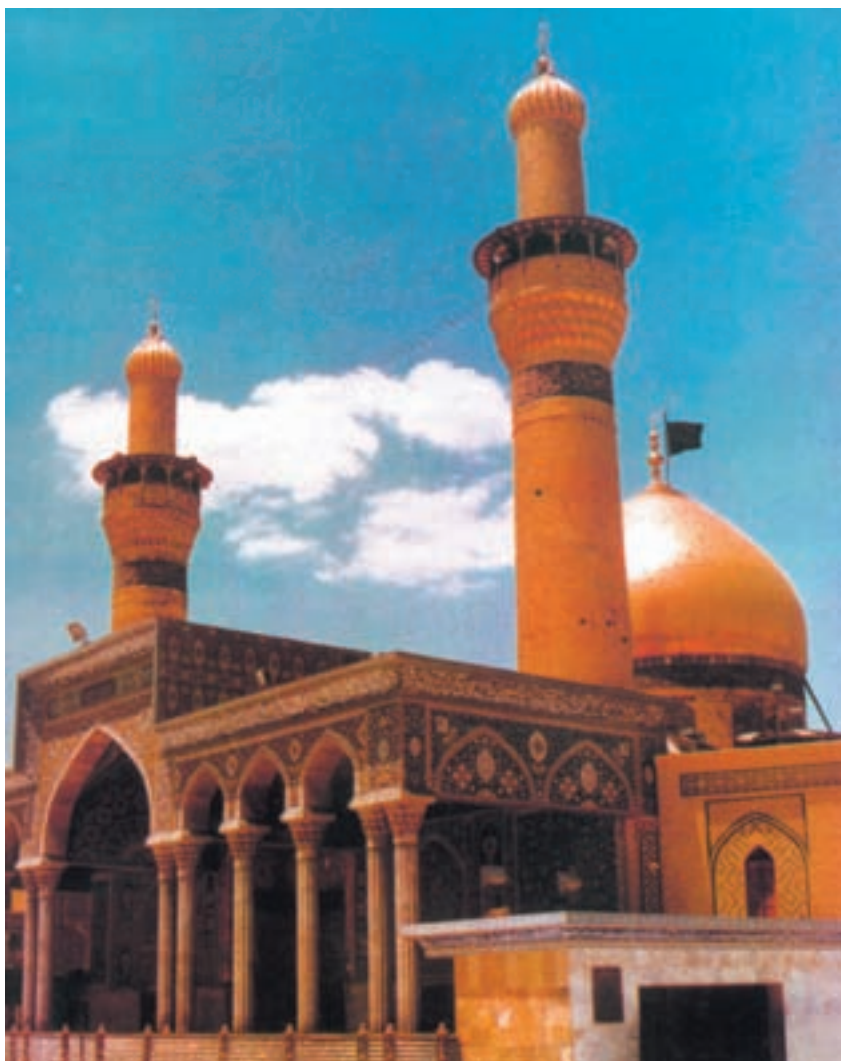
حرم مطهر حضرت اباعبدالله الحسین (ع)

که دیدیم، مدیحه‌ای که مقارن جلوس شاه تهماسب به دربار او فرستاد، سلطان شریعتمدار صفوی را واداشت تا شاعران را به ترک مدیحه‌سرایی توصیه کند و آنان را به نظم‌مراثی و مناقب امامان شیعه ترغیب نماید. محتشم خود از کسانی بود که به توصیه‌ی شاه تهماسب به اشعار دینی روی آورد و با سرودن مرثیه‌ی معروف به دوازده بند درباره‌ی واقعه‌ی کربلا در مرثیه‌سرایی به جایگاه والایی دست یافت. این جایگاه پس از گذشت نزدیک به چهار قرن از