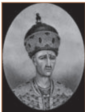
آقا محمدخان قاجار

آقامحمدخان پسر بزرگ محمدحسن خان بود. او بعد از مرگ پدر، به عنوان گروگان در شیراز بسر می برد. مرگ کریم خان زند، فرصتی را در اختیارش نهاد که خود را به استرآباد برساند و با متحد کردن ایل قاجار، آماده روبرویی با خاندان زندیه گردد. نزاع بازماندگان کریم خان با یکدیگر این فرصت را برای آقامحمدخان فراهم آورد که نواحی شمالی و مرکزی ایران را تصرف کند و تهران را به عنوان مرکز فرمانروایی خویش، برگزیند. خان قاجار پس از پیروزی بر لطفعلی خان زند و