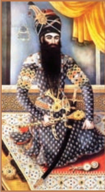
فتحعلی شاه قاجار

بعد از مرگ آقامحمدخان، برادرزاده وی، به کمک سران نظامی و بزرگان قاجار، به نام فتحعلی شاه تاج‌گذاری کرد. سال‌های نخست سلطنت فتحعلی شاه صرف سرکوب طغیان‌های داخلی و تحکیم پادشاهی در خاندان قاجار شد. تغییر اوضاع جهانی و تشدید تکاپوهای استعماری سبب شد تا دومین شاه قاجار در مقابله با دشمنان خارجی و حفظ قلمرو ایران ناکام باشد. سهل‌انگاری در اداره کشور و واگذاری بخش‌هایی از ایران به بیگانگان سبب شده است که قضاوت عمومی نسبت به او با نوعی احساس تنفر همراه باشد. تقریباً همه منابع و تحقیقات تاریخی از دوران سلطنت وی به تلخی یاد می‌کنند. البته این سخن به معنای آن نیست که فتحعلی شاه، هیچ تلاشی برای حفظ یکپارچگی ایران انجام نداد و به عمد زمینه مداخله و حضور بیگانگان را در کشور فراهم کرد. بلکه می‌توان گفت که با وجود خواست عمومی و