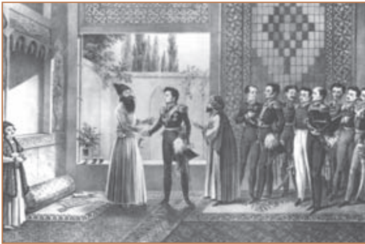
ملاقات عباس میرزا با فرماندهٔ نیروهای روسیه

به موجب عهدنامهٔ ترکمانچای، افزودن بر مناطق و شهرهایی که در عهدنامهٔ گلستان از ایران جدا شده بودند، شهرهای ایروان و نخجوان و بخشی از دشت مغان نیز به روسیه داده شد. همچنین ایران متعهد شد که ۵ میلیون تومان غرامت به روسیه پرداخت کند و به اتباع آن کشور در ایران، حق مصونیت قضایی (کاپیتولاسیون) ۲ بدهد. علاوه بر آن، روس‌ها یک قرارداد تجاری را نیز ضمیمهٔ عهدنامهٔ ترکمانچای کردند که اقتصاد و بازار ایران را عملاً در اختیار آنان قرار می‌داد.