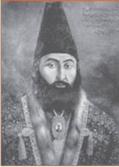
میرزاتقی خان امیرکبیر

با مرگ محمد شاه، ولیعهد او ناصرالدین میرزا با حمایت میرزاتقی خان فراهانی به عنوان چهارمین پادشاه قاجار بر تخت سلطنت نشست. میرزاتقی خان به مقام صدراعظمی منصوب و به امیرکبیر ملقب شد. صدراعظم ابتدا به سرکشی و طغیان گردنکشان داخلی پایان داد و نظم و امنیت را برقرار کرد. او سپس بر پایه شناختی که از دیگر کشورها داشت، برنامه منسجمی را با هدف اصلاح امور و جبران عقب ماندگی ایران طراحی کرد و به اجرا گذاشت. اصلاحات مورد نظر امیرکبیر به سرانجام مطلوب نرسید؛ زیرا مدتی بعد قربانی توطئه درباریان نالایق و طماع و دسیسه های روسیه و انگلستان شد. ناصرالدین شاه با وجود علاقه ای که به وزیرش داشت، تحت تأثیر دشمنان امیرکبیر، فرمان برکناری، تبعید و سرانجام قتل او را صادر کرد.