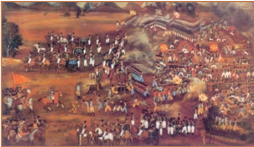
یک نقاشی از صحنه جنگ ایران و روسیه

۱- دور اول جنگ‌های ایران و روسیه: دور اول جنگ‌های ایران و روسیه که نزدیک به ۱۰ سال طول کشید ۱ ، در نهایت به سبب ضعف سیاسی و نظامی ایران، به پیروزی روسیه انجامید و حکومت قاجار مجبور به امضای قرارداد گلستان شد. طبق مفاد آن قرارداد، نه تنها بخش‌هایی از نواحی شمالی میهن ما، شامل ولایات گرجستان، داغستان و اران و شهرهایی چون تفلیس، دربند، باکو، گنجه، شکی، شیروان و ... به روسیه واگذار گردید، بلکه ایران از داشتن نیروی دریایی در دریای خزر نیز محروم شد.