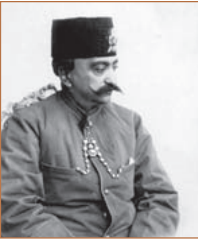
ناصرالدین شاه قاجار

با مرگ محمد شاه، ولیعهد او ناصرالدین میرزا با حمایت میرزاتقی خان فراهانی به عنوان چهارمین پادشاه قاجار بر تخت سلطنت نشست. میرزاتقی خان به مقام صدراعظمی منصوب و به امیرکبیر ملقب شد. صدراعظم ابتدا به سرکشی و طغیان گردنکشان داخلی پایان داد و نظم و امنیت را برقرار کرد. او سپس بر پایه شناختی که از دیگر کشورها داشت، برنامه منسجمی را با هدف اصلاح امور و جبران عقب ماندگی ایران طراحی کرد و به اجرا گذاشت. اصلاحات مورد نظر امیرکبیر به سرانجام مطلوب نرسید؛ زیرا مدتی بعد قربانی توطئه درباریان نالایق و طماع و دسیسه های روسیه و انگلستان شد. ناصرالدین شاه با وجود علاقه ای که به وزیرش داشت، تحت تأثیر دشمنان امیرکبیر، فرمان برکناری، تبعید و سرانجام قتل او را صادر کرد.