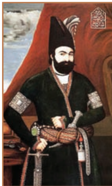
محمد شاه قاجار

فتحعلی شاه در زمان حیات خویش عباس میرزا را به عنوان ولیعهد خود معرفی کرده بود، اما مرگ ناگهانی این شاهزاده لایق باعث شد تا مقام ولیعهدی به فرزندی وی، محمدمیرزا برسد. بعد از مرگ فتحعلی شاه، محمدمیرزا به کمک میرزا ابوالقاسم قائم مقام فراهانی نیز بر مسند پادشاهی تکیه زد. قائم مقام فراهانی به منصب صدارت منصوب شد. او با تدبیر، مدعیان تاج و تخت را به جای خود نشاند و اوضاع اجتماعی و فرهنگی را بهبود بخشید. ایستادگی وی در برابر دخالت و زیاده خواهی های دولت انگلستان، موجب شد که سفیر و عوامل داخلی آن کشور علیه آن وزیر ادیب دسیسه کنند و موجبات برکناری و قتل وی را فراهم آورند.