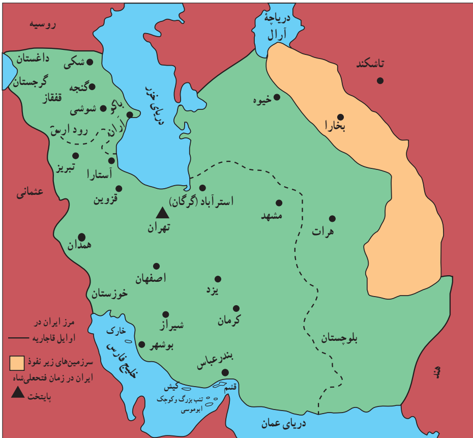
قلمرو ایران (در اوایل قاجاریه)

آقامحمدخان در سال ۱۲۱۱ ق/ ۱۱۷۵ ش. بار دیگر برای برقراری نظم و امنیت عازم قفقاز شد، اما در جریان لشکرکشی به آن منطقه توسط چند تن از همراهان خویش به قتل رسید. بدون تردید تلاش و تکاپوهای بی‌وقفه آقامحمدخان قاجار برای اعاده حاکمیت دولت مرکزی بر سرتاسر قلمرو ایران و ایجاد یکپارچگی سیاسی، قابل تمجید است، اما از طرف دیگر بی‌رحمی و کینه‌توزی و قساوت قلب وی که ریشه در حوادث زمان کودکی و نوجوانی داشت، سبب شده است که در تاریخ ایران از وی به نیکی یاد نشود.