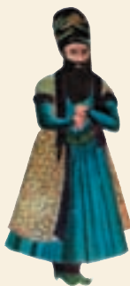
میرزا ابوالقاسم قائم مقام فراهانی

قائم مقام مردی فوق العاده باهوش و صاحب فکر و عزم ثابت بود. او به واسطه اطلاعات و تجارب خود، اوضاع و احوال همسایگان ایران و دولت های اروپایی را به خوبی می شناخت. دولت های استعمارگر اطمینان داشتند که او مانع جدی برای توسعه نفوذ و دخالت آنان در ایران است. از این رو، نویسندگان انگلیسی که در آن تاریخ در ایران سیاحت می کردند، قائم مقام را به سرپیچی از نصایح دولت انگلستان و طرح نقشه تصرف هرات متهم می کنند و حس بدبینی و دشمنی فوق العاده خود را نسبت به این مرد بزرگ، پنهان نمی کنند. او نمونه بارز تدبیر و تیزبینی آمیخته با انسان دوستی میرزا ابوالقاسم قائم مقام فراهانی میهن پرستانه بود که در آن شرایط می توانست ایران را به خوبی اداره کند.