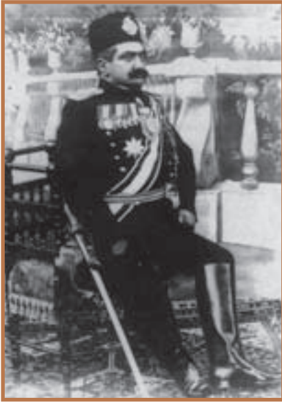
مسعود میرزا ظل السلطان پسر بزرگ ناصرالدین شاه که ۳۴ سال متوالی حاکم اصفهان و قریب ۴۵ سال به طور متناوب حاکم مازندران و اصفهان و فارس بود.