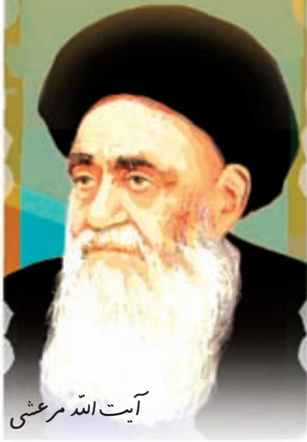
آیت الله مرعشی