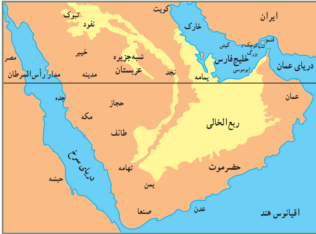
شبه جزیره عربستان