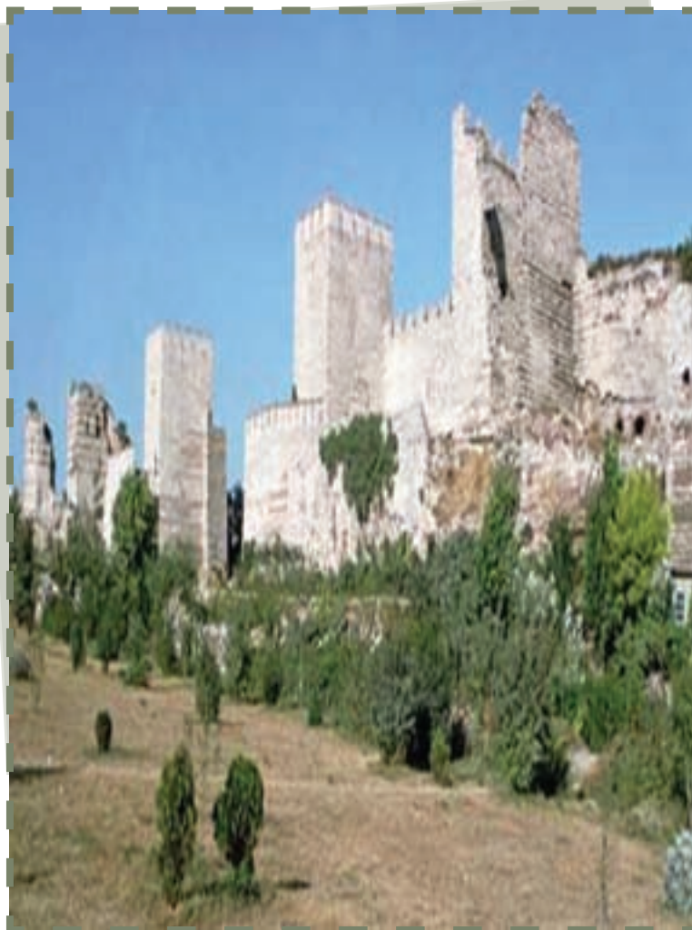
بقایایی از قسطنطنیه، پایتخت امپراتوری روم شرقی (بیزانس)

در آستانه ظهور اسلام، در کنار حکومت قدرتمند ساسانی در ایران، امپراتوری روم شرقی - با مرکزیت قسطنطنیه ۱ - حضور داشت. این امپراتوری حاصل