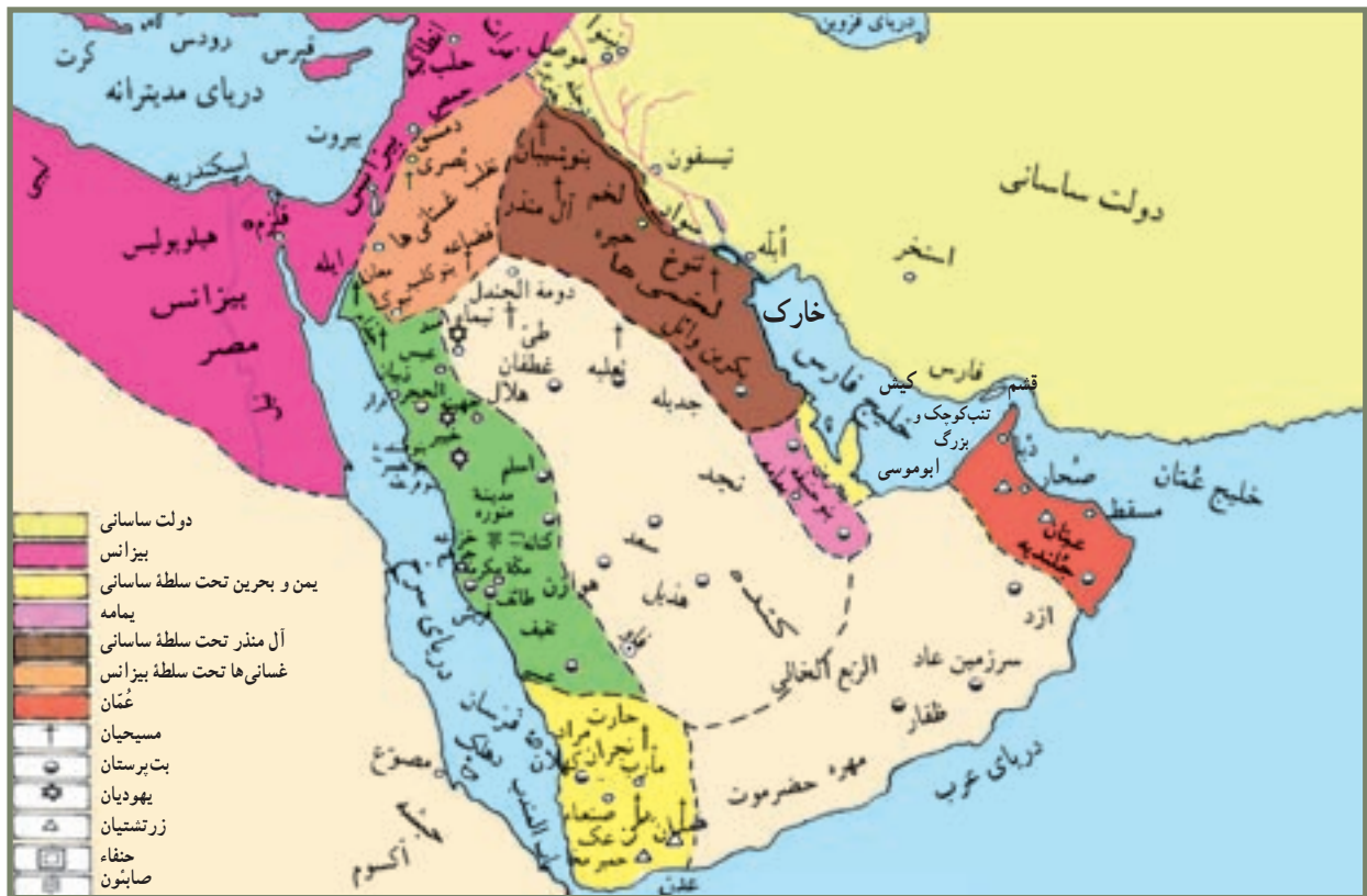
جغرافیای سیاسی، اجتماعی و دینی جزیره العرب قبل از ظهور اسلام

دین و عقاید: به لحاظ اعتقادی نیز در دوره جاهلی، سرزمین عربستان شاهد حضور جلوه های گوناگون دینی و اعتقادی بود، اما می توان گفت، گرایش غالب و رایج اعتقادی، تمایل به شرک و بت پرستی بود. پیشینه اعتقادی مردم این سرزمین، توحید و یکتا پرستی بود؛ چرا که حضرت ابراهیم علیه السلام و فرزندش - حضرت اسماعیل علیه السلام - برای تثبیت عقیده توحید در سرزمین عربستان تلاش زیادی کردند؛ ولی به مرور زمان، مجدداً جلوه های انحراف دینی در میان مردم این سرزمین - به ویژه در مکه - رسوخ کرد. در آستانه ظهور اسلام، از کسانی با عنوان حنفاء یاد می شود که از شرک و بت پرستی منزجر و گرایش به توحید داشته، خود را پیرو دین حنیف