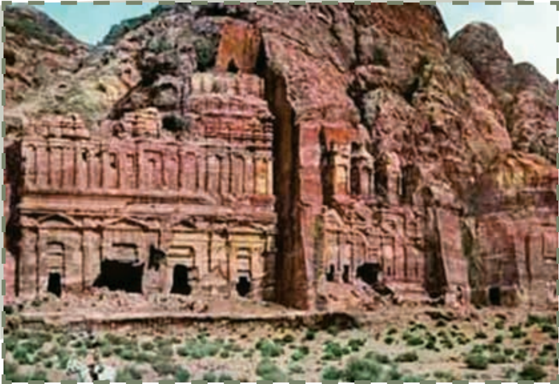
آثار به جا مانده از قوم نمود در شمال عربستان

شیخ قبیله وظایفی مانند تصمیم برای ماندن در یک ناحیه یا کوچ کردن، جنگ و یا صلح با دیگر قبایل و پذیرفتن عضو جدید قبیله را برعهده داشت. افراد قبیله نیز خود را موظف به اطاعت بی چون و چرا از شیخ قبیله می دانستند. دوره قبل از ظهور اسلام را اصطلاحاً عصر جاهلی می نامند. در این زمان، مردم ساکن در سرزمین عربستان در جاهلیتی شگفت آور به سر می بردند. یکی از جلوه های آشکار عصر جاهلی وجود جنگ و قتل و غارت بود که محدودیت و کمبود منابع طبیعی نقش مهمی در این شیوه رفتار داشت. البته عامل اصلی این گونه انحرافات، وجود اخلاق و روحیات جاهلانه بود که اسلام به مبارزه با آن برخاست. عرب جاهلی در زمینه