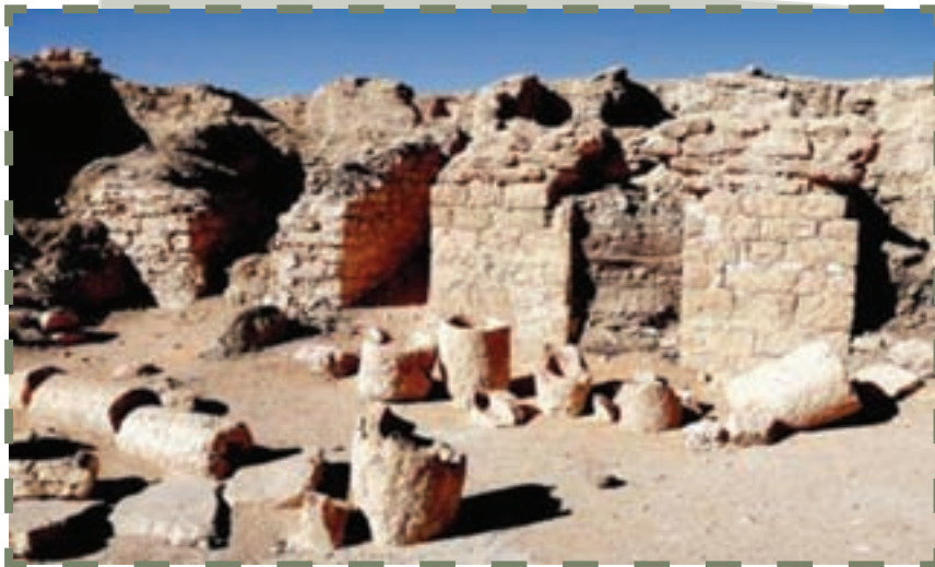
آثار به جا مانده از قوم عاد در جنوب عربستان

ساکنان: شبه جزیره عربستان، محل زندگی نژاد