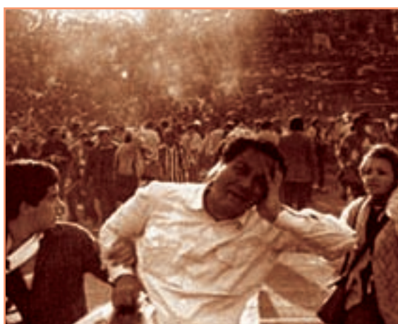
● فروریختن ورزشگاه Hillsborough در سال ۱۹۸۵