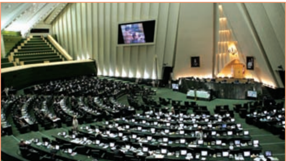
● مجلس شورای اسلامی