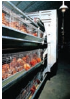
تصویر ۹-۴- دان خوری خودکار

آب خوری های چکه ای و فنجانای می توانند به نحوی نصب شوند که مرغ های دو قفس مجاور از آن استفاده کنند. آب خوری چکه ای مرسوم ترین نوع آب خوری در سیستم قفس است. میزان هدر رفتن آب در این سیستم به حداقل می رسد. به ازای هر ۶ تا ۸ قطعه مرغ تخم گذار باید یک عدد آب خوری چکه ای و به ازای هر ۱۰ تا ۱۲ قطعه مرغ تخم گذار یک عدد آب خوری فنجانای در نظر بگیرید ۴ (تصاویر ۹-۴ و ۱۰-۴).