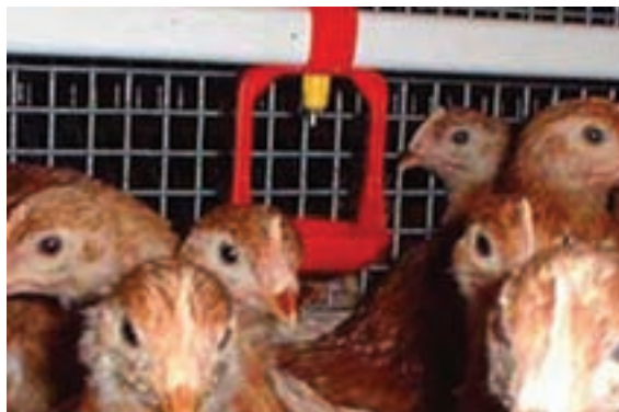
تصویر ۱۰-۴- انواع آب خوری چکه ای