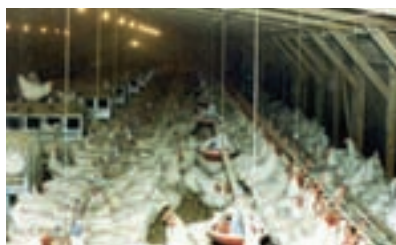
تصویر ۱۱-۴- انواع لانه تخم گذاری