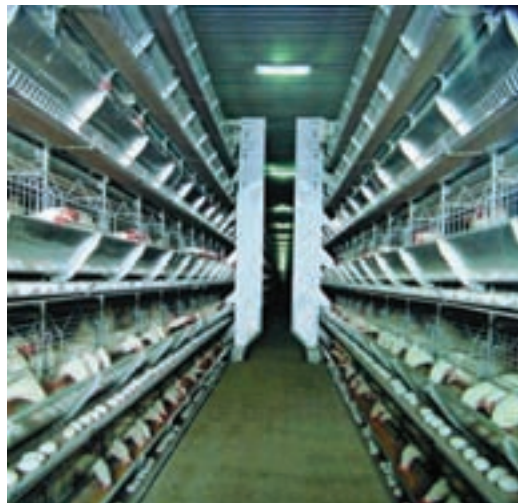
تصویر ۸-۴- جمع آوری تخم مرغ به روش خودکار