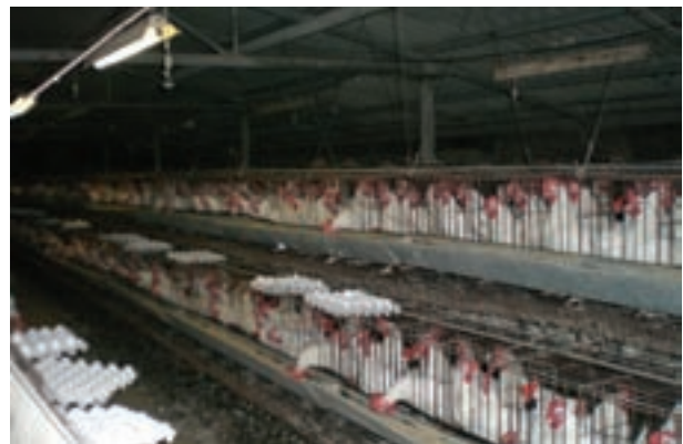
تصویر ۷-۴- جمع آوری تخم مرغ به روش دستی