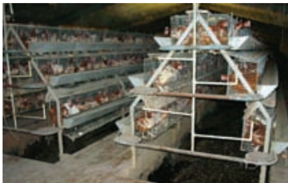
تصویر ۴-۶ - قفس پله ای