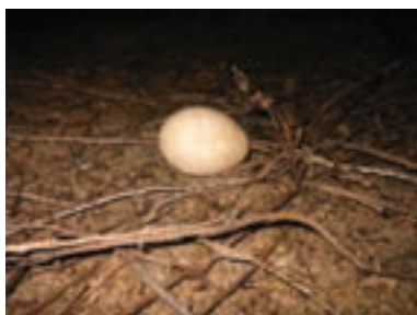
تصویر ۷-۲- تخم غاز