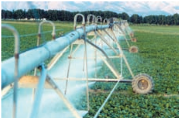
شکل ۸-۶- آبیاری بارانی خطی