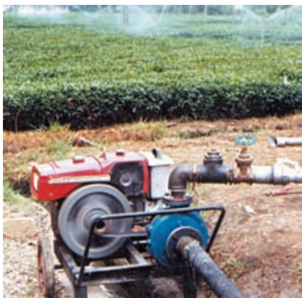
شکل ۴-۶- آبیاری بارانی با سیستم ثابت