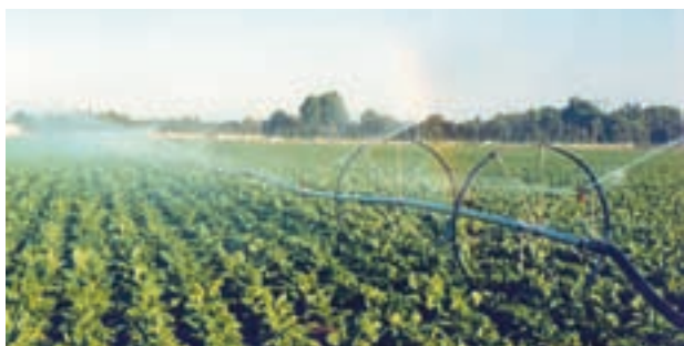
شکل ۵-۶- آبیاری بارانی ویل موو

(ویل موو): در این سیستم، به جای لوله‌های فرعی، یک خط لوله به صورت یکپارچه ساخته شده است و به وسیله نیروی موتور بنزینی که در وسط خط لوله نصب می‌گردد، به جلو یا عقب حرکت داده می‌شود (شکل ۵-۶).