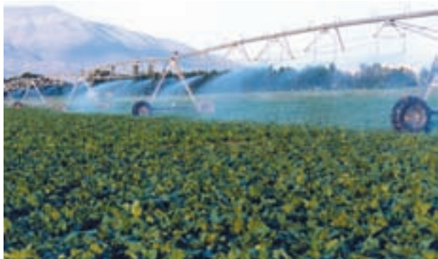
شکل ۶-۶- آبیاری بارانی قرقره‌ای

(تک‌گان): در این سیستم، از آبپاشهای بزرگ به نام «گان» استفاده می‌شود که بر روی شاسی چرخدار و یا ارابه مستقر می‌گردد و بیشتر برای آبیاری تکمیلی در اراضی دیم مورد استفاده قرار می‌گیرد (شکل ۶-۶).