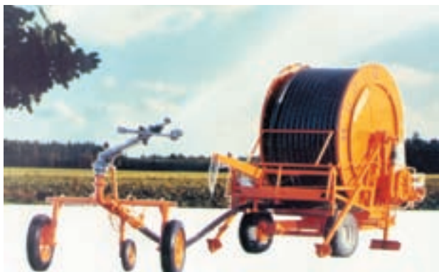
شکل ۷-۶- آبیاری بارانی دوار مرکزی (سنترپیوت)

(سنترپیوت): این سیستم از یک بازوی فرعی با آبپاشها تشکیل شده است که بر روی یک سری چرخ نصب می‌گردد و در اثر نیروی برق یا هیدرولیک در نقطه مرکزی می‌چرخد و اراضی را به شکل دایره آبیاری می‌کند (شکل ۷-۶).