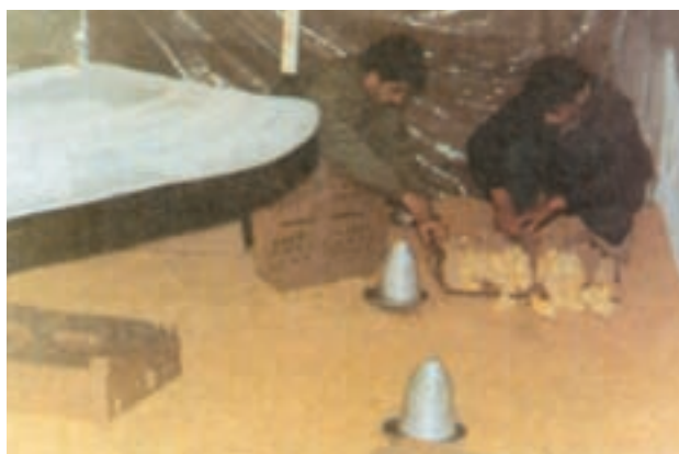
نوعی مادر مصنوعی