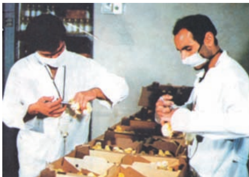
واکسیناسیون جوجه یکروزه در مؤسسات جوجه‌کنشی