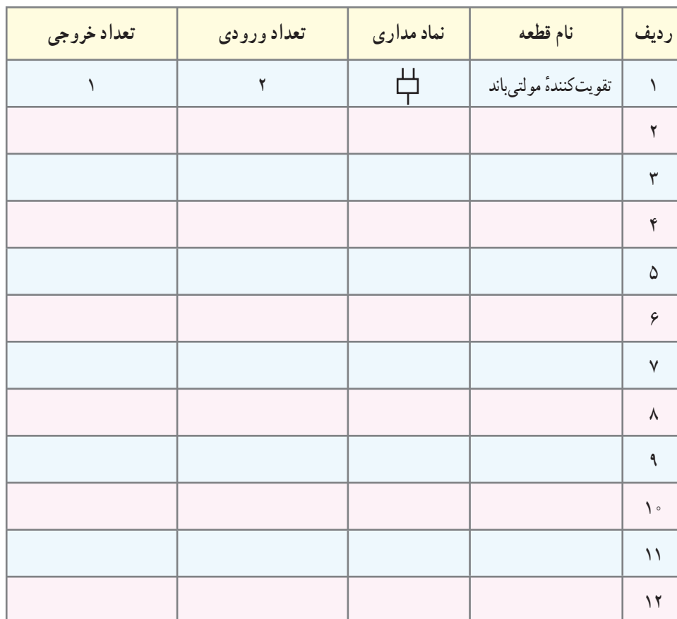
جدول ۱۱-۴- قطعات سیمولاتور آنتن مرکزی