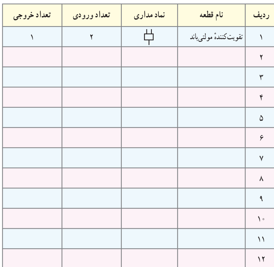
جدول ۴-۱۲- قطعات آنتن مرکزی مجتمع مسکونی