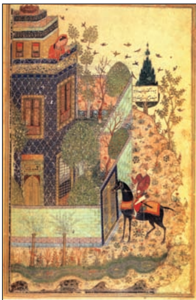
۷۰-۷- دیوان خواجوی کرمانی (مجموعه همای و همایون)، دوران جلایری، سده هشتم هجری