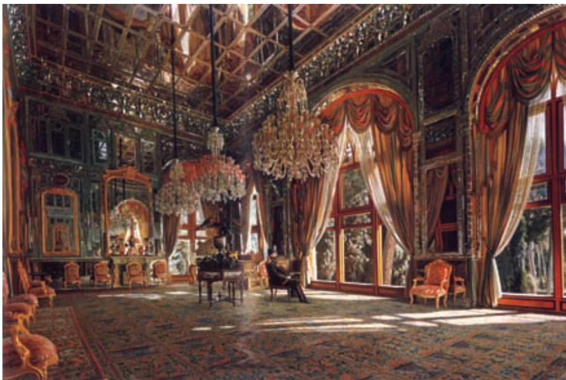
۹۵-۷- تالار آینه ، اثر کمال الملک ، رنگ و روغن ، تهران ، سده سیزدهم هجری

از دیگر هنرمندان این دوره محمود خان ملک الشعرا است که شیوه‌ی پرداز را با رنگ روغن و کلاژ تصویری ۶۶ اجرا نمود. ادامه‌ی مکتب کمال الملک توسط شاگردان وی از جمله اسماعیل آشتیانی (که پس از وی به ریاست مدرسه‌ی صنایع مستظرفه رسید) شکل گرفت (تصویر ۹۶-۷).