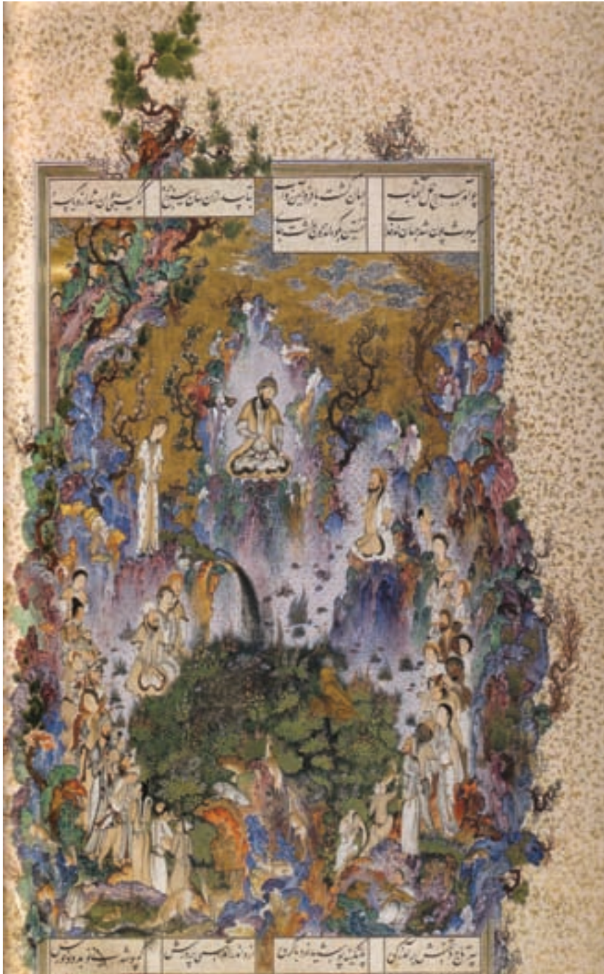
۷-۸۲- شاهنامه فردوسی (طهماسبی)، دربار کیومرث، اثر سلطان محمد، مکتب تبریز، حدود ۹۴۲-۹۳۲ هجری