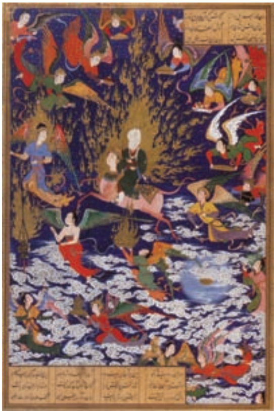
۷۸-۷-خمسہ نظامی (طهماسبی)، معراج حضرت محمد (ص)، اثر سلطان محمد، مکتب تبریز، سده دهم هجری (۹۵۰-۹۴۶ هجری)