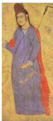
۷-۸۶- درویش جوان با چوبدستی، اثر محمد یوسف، مکتب اصفهان، ۱۰۵۰ هجری

از دیگر نقاشان مکتب اصفهان می توان به "معین مصور"، "محمد یوسف" و "محمد قاسم" اشاره کرد.