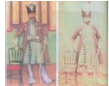
۹۳-۷- عکس و نقاشی ، ناصرالدین شاه ، تهران ، ۱۲۷۲ هجری

در این دوره با ورود دوربین عکاسی به ایران آثار نقاشی ایرانی هم تحت تاثیر قرار گرفت (تصویر ۹۳-۷). این پیروی کامل از عکس در بسیاری از موارد راه را بر خلاقیت از منشا عالم خیال بست. از این رو گرایش شیوه اروپایی و رنگ و روغن کاری شدت می‌یابد.