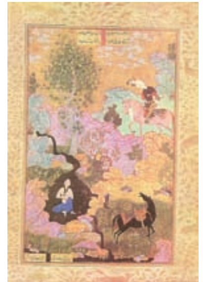
۷-۸۱- خمسه نظامی، خسرو شیرین را نظاره می کند، اثر سلطان محمد، مکتب تبریز، سده دهم هجری