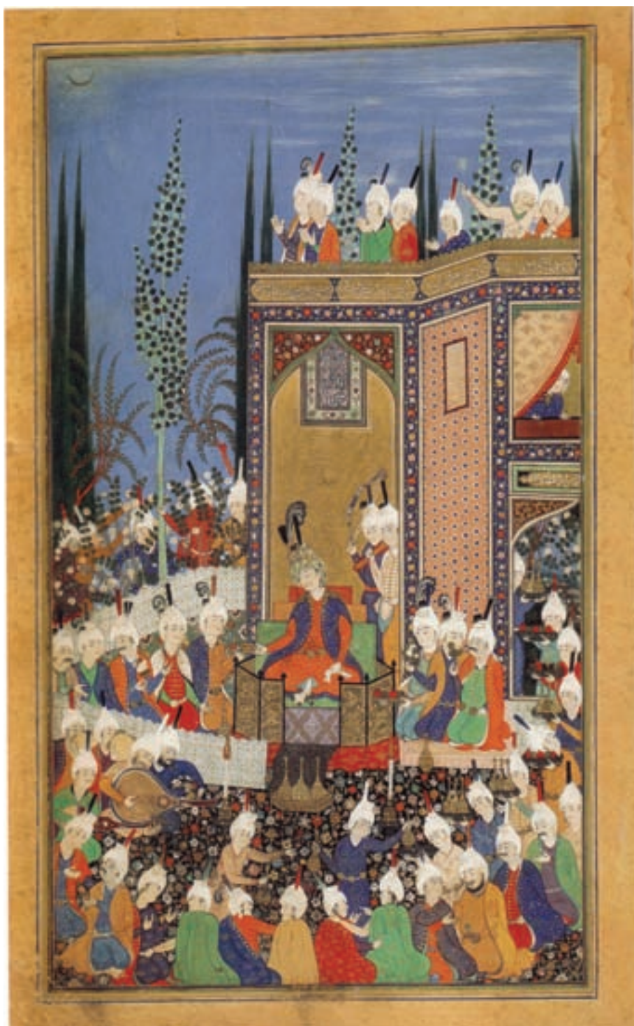
۷-۷۹- دیوان حافظ ، رؤیت هلال ماه پس از رمضان ، مکتب تبریز ، ۹۳۶-۹۳۲ هجری