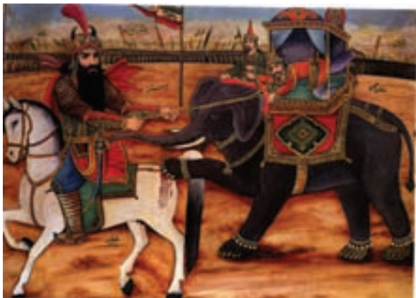
۹۷-۷- نقاشی خیالی سازی (قهوه خانه ای) ، نبرد رستم و خاقان چین ، اثر حسین قوللر آقاسی ، رنگ و روغن ، سده سیزدهم و چهاردهم هجری