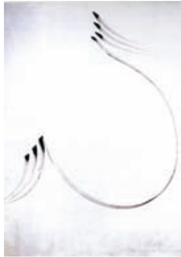
۱۰۰-۷- اثر رضا مافی