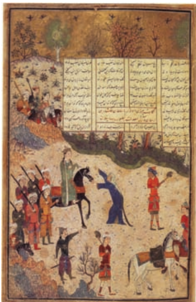
۷۱-۷- دیوان خواجوی کرمانی، دادخواهی پیرزن از ملک‌شاه، بغداد، مکتب جلایری، سال ۷۹۹ هجری

در سده هشتم هجری در دوران جلایریان حکومت در دو مرکز تبریز و بغداد به کار خود ادامه داد و یکی از مهم‌ترین مکاتب نقاشی پدیدار گشت که به مکتب جلایری شهرت یافته است. این مکتب متعالی مجموعه‌ای بر گرفته از دستاوردهای مکتب بغداد، شیراز و تبریز است. این مکتب با حضور نقاشان برجسته‌ای چون جنید بغدادی معروف به سلطانی و دیگر هنرمندان شکل گرفت. تصاویری از دیوان خواجوی کرمانی (مجموعه همای و همایون) (تصویر ۷۰-۷) که در موزه بریتانیا نگاهداری می‌شود به خط نستعلیق میر علی تبریزی و از آثار برجسته جنید نقاش است (تصویر ۷۱-۷).