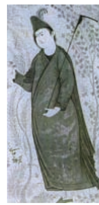
۷-۸۴- درویش جوان با چوبدستی، اثر رضا عباسی، مکتب اصفهان، ۱۰۴۰ هجری