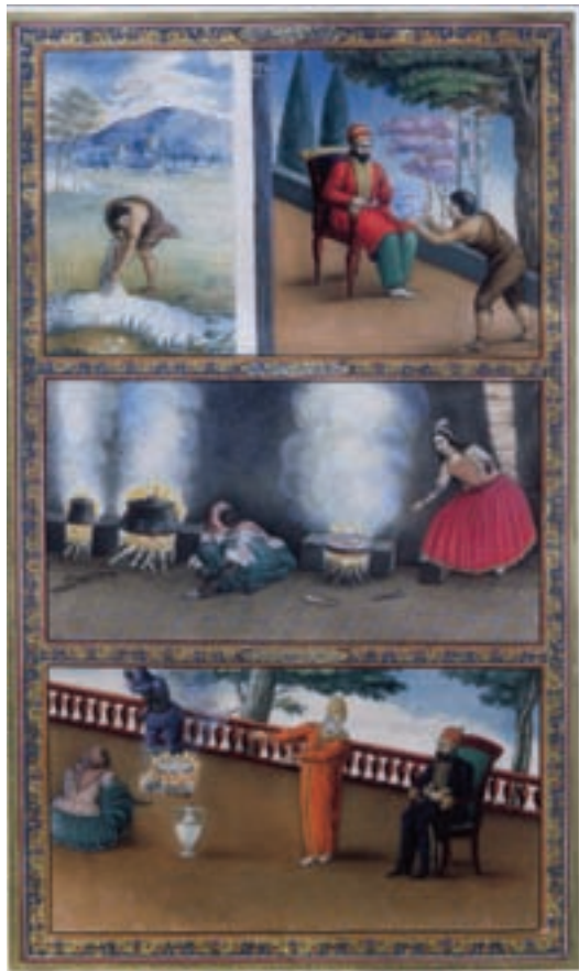
۹۴-۷- نسخه هزار و یک شب ، اثر صنایع‌الملک ، تهران ، سده سیزدهم هجری

در این دوره با ورود دوربین عکاسی به ایران آثار نقاشی ایرانی هم تحت تاثیر قرار گرفت (تصویر ۹۳-۷). این پیروی کامل از عکس در بسیاری از موارد راه را بر خلاقیت از منشا عالم خیال بست. از این رو گرایش شیوه اروپایی و رنگ و روغن کاری شدت می‌یابد.