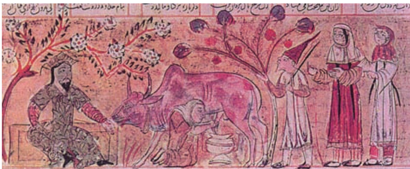
۶۹-۷- شاهنامه قوام الدین حسن ، بهرام گور در کلبه دهقان ، مکتب شیراز ، ۷۴۱ هجری

شیوه نقاشی مکتب شیراز در ادامه هنر کهن ایرانی و ابداعات جدید آن است. این مکتب با نوآوریهای خام دستانه و ابتدایی، تداوم دهنده سنت کتاب آرایبی و نقاشی سده پنجم و ششم هجری شد که در طول دو سده بعدی تکامل یافت و به خصوصیات ویژه مسلط نقاشی ایرانی بدل گردید. (تصویر ۶۹-۷)