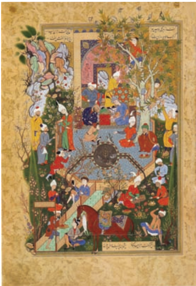
۷-۸۳- نسخه ی خطی هفت اورنگ جامی (ابراهیم میرزا)، مکتب مشهد، بین سالهای ۹۶۴-۹۷۵ هجری

مکتب مشهد با تلفیق مکتب تبریز و عناصر محلی شکل گرفت. مهمترین ویژگی این مکتب حضور انسان و اشیاء بدون ارتباط با موضوع داستانی، توجه به موضوعات روزمره و عادی، پیکره های بلند قامت با گردن بلند و صورت گرد، صخره نگاری های قطعه قطعه، درختان کهنسال با تنه و شاخه های گره دار و استفاده از رنگ سفید است. شاخص ترین اثر این دوره هفت اورنگ جامی ۵۶ می باشد (تصویر ۷-۸۳).