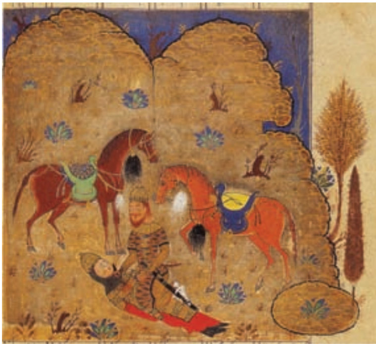
۷۴-۷- شاهنامه‌ی فردوسی، رستم و سهراب، مکتب شیراز، دوره تیموری، ۷۷۳ هجری