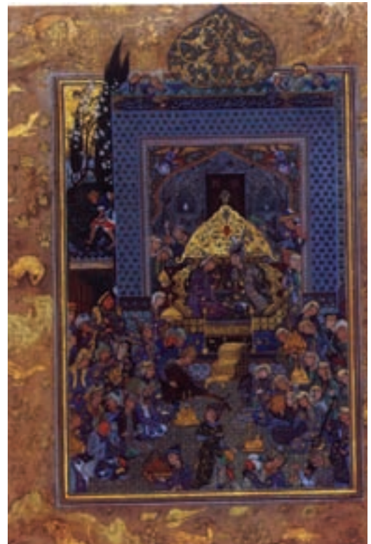
۹۸-۷- فردوسی در دربار سلطان محمود، اثر هادی تجویدی، تهران، ۱۳۰۴ شمسی