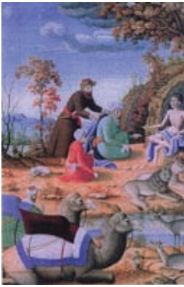
۷-۸۸- خمسه نظامی، دیدار مجنون، اثر محمد زمان، اصفهان، سال ۱۰۸۶ هجری

حضور هنرمندان اروپایی و نقاشان ارمنی در اصفهان (میناس ارمنی نقاش دیوار نگاره های کلیسای وانک) و همچنین ورود گراوورهای اروپایی و شکل گیری سبک تلفیقی هنر ایران و اروپا به صورت نقاشی رنگ روغن و رعایت اندازه‌ی طبیعی انسان در آثار (مثل نقاشی کاخ‌ها) به صورت دو بعدی و سه بعد نمایشی و فرنگی سازی (مکتب ایتالیا و اصفهان) تاثیر مهمی در نقاشی این دوره دارد (تصویر ۷-۸۸).