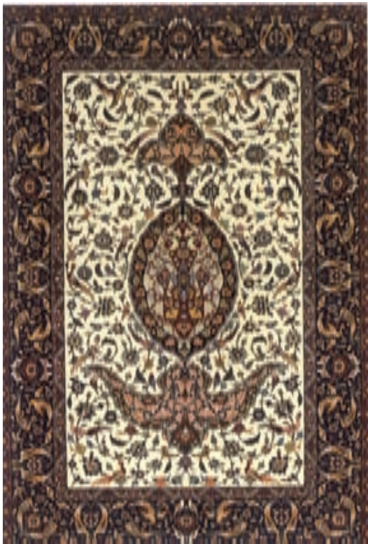
۹۹-۷- طرح و بافت فرش، اثر عیسی بهادری، اصفهان، سده چهاردهم هجری