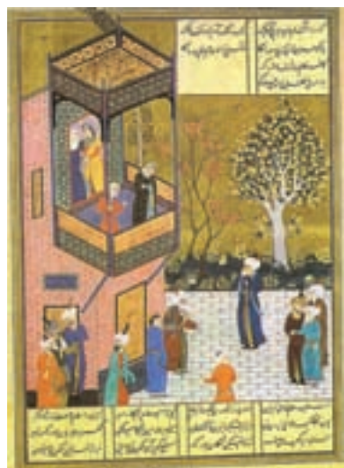
۸۰-۷- دیوان میرعلیشیر نوایی ، شیخ صنعان ، اثر شیخ زاده ، مکتب تبریز ، سده دهم هجری