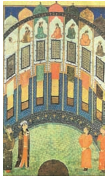
۷۳-۷- گلچین اسکندر سلطان، بهرام گور در قصر هفت گنبد، مکتب شیراز، دوره تیموری، سده هشتم هجری