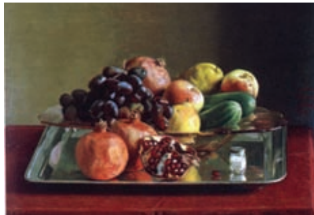
۹۶-۷- طبیعت بی جان ، اثر اسماعیل آشتیانی ، رنگ و روغن ، سده سیزدهم هجری