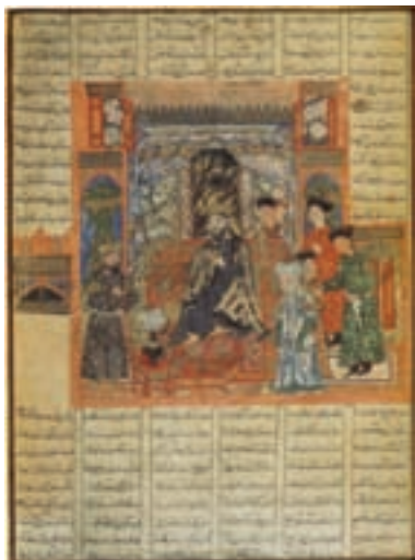
۶۸-۷- نسخه شاهنامه فردوسی ، تبریز ، سده هفتم هجری (۷۲۶-۷۲۶ هجری)