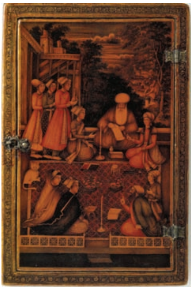
۹۰-۷- جلد آینه لاک‌ی روغنی، تدریس رساله در شب، اواخر سده دوازدهم و اوایل سیزدهم هجری

از هنرمندان می‌توان به محمد صادق، برجسته‌ترین نقاشان این دوره علی‌اشرف که در تصویر گل مهارت زیادی داشته اشاره کرد. مهمترین کتاب این دوره تاریخ جهان‌گشای نادری ۶۲ است.