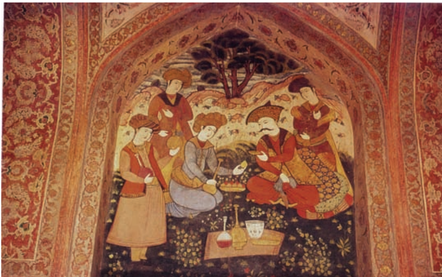
۸۷-۷- دیوارنگاری کاخ چهل ستون، بزم شاه عباس اول در باغ، اصفهان، حدود ۱۰۵۷ هجری

در این مکتب شاهد گرایش‌هایی با تحولاتی گوناگون در زمینه‌های نقاشی هستیم که می‌توان به رواج سنت دیوارنگاری در کاخ‌ها و بناهای خصوصی و عمومی ۵۹ اشاره کرد (تصویر ۸۷-۷). هم‌چنین زمینه‌ی تداوم هنر گورکانی هند به واسطه‌ی مهاجرت هنرمندان ایرانی که پیشتر در دوران مکتب تبریز آغاز شده بود بوجد آمد.