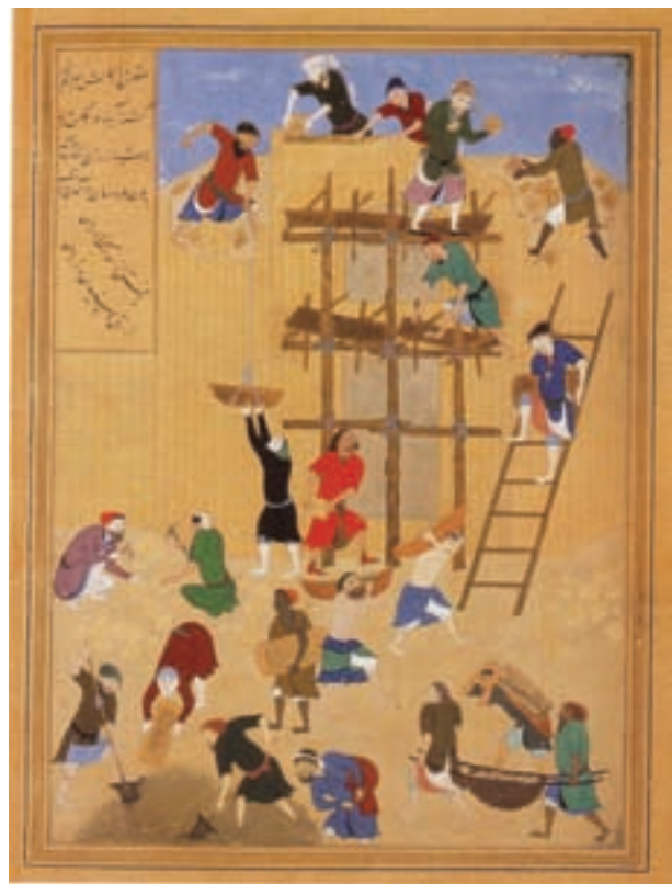
۷۷-۷-خمسہ نظامی، ساختن کاخ خورنق، کمال الدین بهزاد، مکتب هرات، ۸۹۹ هجری

درباری، بکارگیری اشیاء مربوط به زندگی، شکست کادر ۵۱ ، پوشاک هماهنگ با رسم صفویه با کلاه قزلباش ۵۲ (تصویر ۷۹-۷)، ایجاد صحنه‌های شکار با حالتی پر تحرک، صحنه‌های داخلی با حالتی خموش و متفکرانه و بزم با حالت یکنواخت و پیکره‌های محدود، بکارگیری نقوش نگارگری در بافت پارچه، توجه زیاد به چهره‌نگاری، رواج تشعیر بدون بکارگیری اسلیمی و مهارت در صحنه‌های چوپانی و به ویژه در نقاشی‌های بهزاد و شاگردان وی ۵۳ ترکیب‌بندی حلزونی یا اسپیرال می‌باشد. از آثار معروف این دوره می‌توان به دیوان میرعلیشیرنوایی، مجلس صنعان اثر شیخ زاده (تصویر ۸۰-۷)، خمسہ ی نظامی ۵۴ (تصویر ۸۱-۷) و شاهنامه شاه طهماسب ۵۵ (تصویر ۸۲-۷) اشاره کرد.