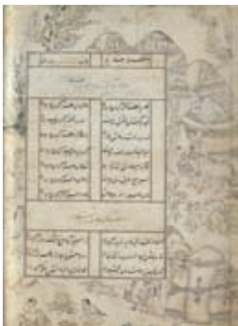
۷۲-۷۰- دیوان سلطان احمد جلایر ، تشعیر ، بغداد ، حدود ۸۰۶-۸۰۳ هجری

ویژگی‌های مهم مکتب جلایری شامل فضای بیکرانه و نمایش طبیعت شاعرانه ، تصویر سازی از جهان خیالی ، هماهنگی پیکره و منظره‌سازی ، ترکیب بندی دایره وار، تزئینات ماهرانه، تفکیک فضا ۴۳ و هندسه ترسیمی و پرسپکتیو آکسومتری ۴۴ است.