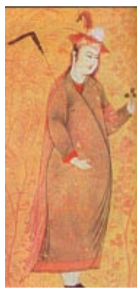
۷-۸۵- درویش جوان با چوبدستی، اثر افضل اصفهانی، مکتب اصفهان، ۱۰۵۰ هجری