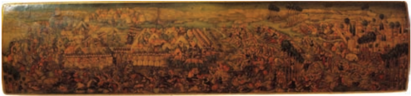
۹۲-۷- قلمدان ، صحنه نبرد ، لاکه روغنی ، تهران ، ۱۲۶۷-۱۲۶۶ هجری