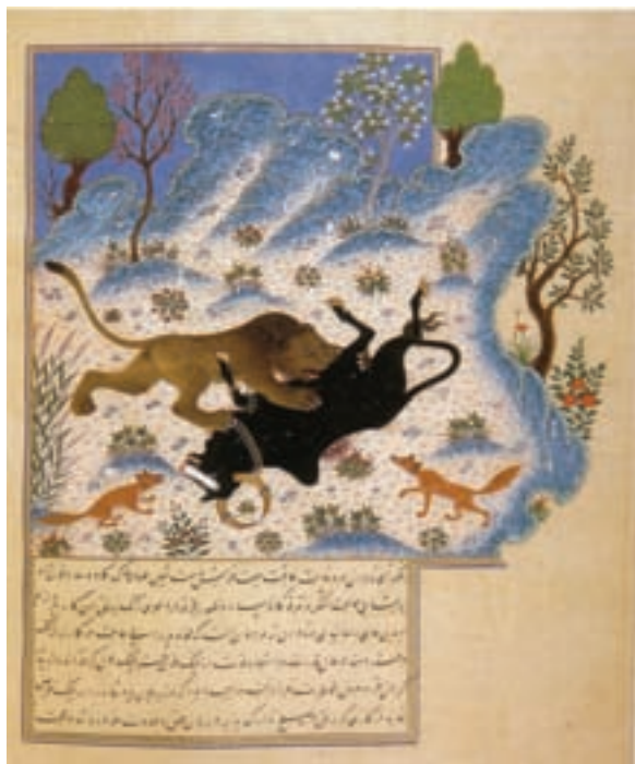
۷۶-۷-کليلة و دمنه ، نسخه بايسنقرى ، حمله شير به گاو مکتب هرات ، سدهى هشتم هجرى