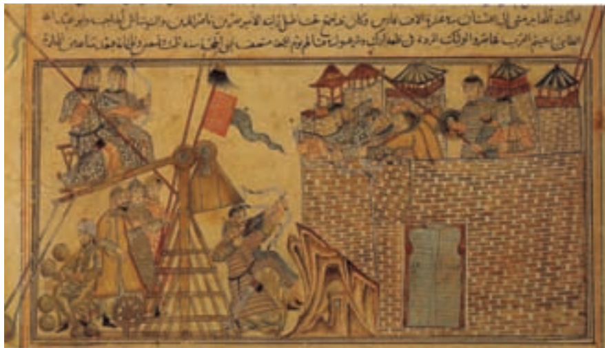
۶۷-۷- نسخه عربی جامع التواریخ ، رشیدالدین فضل الله، حمله ی محمد بن سبکتگین به زرنگ سیستان، تبریز، سال ۷۱۴ هجری