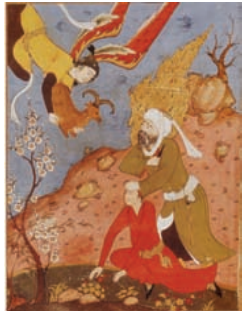
۷-۸۹- قصص الانبیا، صحنه ذبح حضرت اسماعیل (ع) توسط حضرت ابراهیم (ع)، اثر رضا عباسی، اصفهان، اوایل سده یازدهم هجری

از شاهکار های مکتب اصفهان می‌توان به قصص الانبیا و شاهنامه‌ی شاه عباسی اثر رضا عباسی نام برد (تصویر ۷-۸۹).