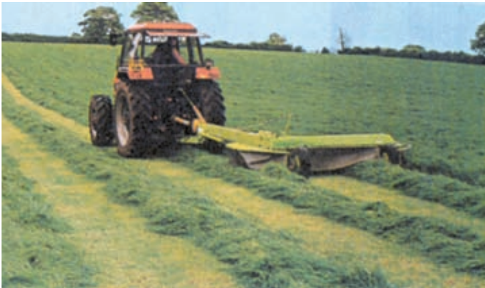
شکل ۸-۱- موور در حال برداشت علوفه

— ماشین علف‌بر (موور) : تنها ساقه را از نزدیک زمین قطع می‌کند و در یک مسیر قرار می‌دهد (شکل ۸-۱).