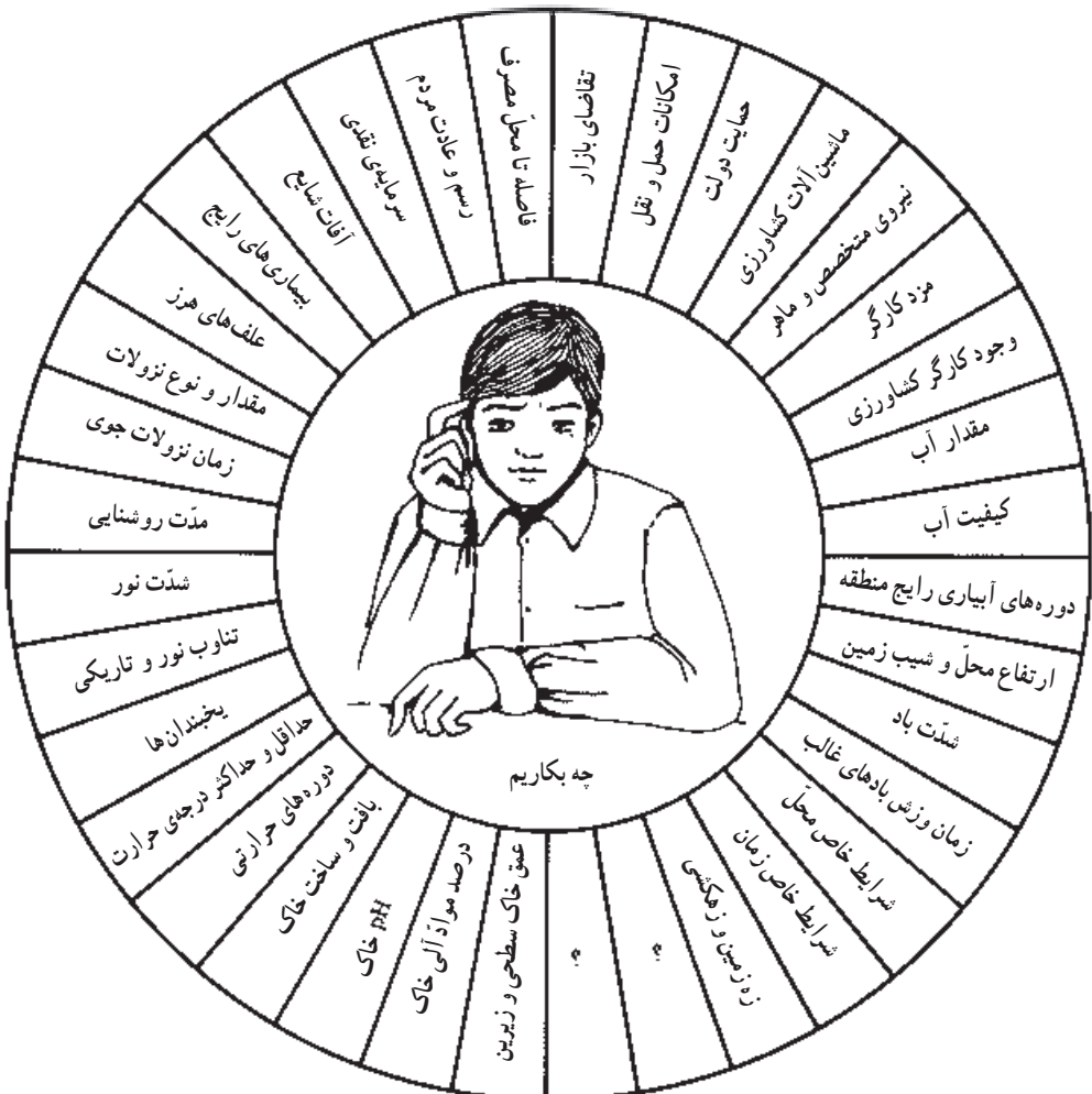
شکل ۹-۱- تعدادی از عوامل مؤثر در تعیین نوع محصول قابل کاشت در یک منطقه

شکل ۹-۱ تعدادی از عوامل مؤثر بر انتخاب نوع محصول جهت یک منطقه را نشان می‌دهد. آیا شما عامل یا عوامل دیگری را می‌توانید بر این عوامل بیافزایید؟ اگر از عوامل فوق، یکی یا تعدادی را مؤثر نمی‌دانید دلیل آورده، در کلاس بحث کنید.