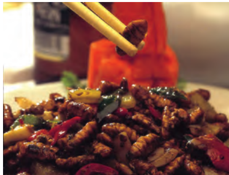
شکل ۵-۱۳- شفیره

شکم پروانه در حشرات نر دارای هشت حلقه و در ماده دارای هفت حلقه است.