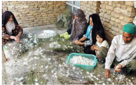
شکل ۶-۱۳- برداشت پیله به روش سنتی

چنانچه از قاب‌های پیله‌تی چرخشی استفاده شده باشد، پیله‌ها را می‌توان با ماشین‌آلات مخصوص پیله‌گیری شامل انواع دستی و نیمه اتوماتیک برداشت کرد. زمان برداشت پیله معمولاً پس از هفت تا هشت روز بعد از کامل شدن است.