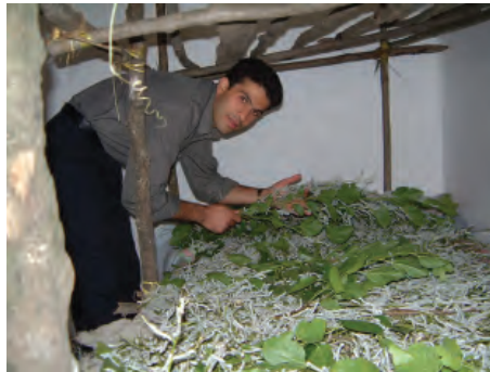
شکل ۸-۱۳- تلمبار کرم ابریشم