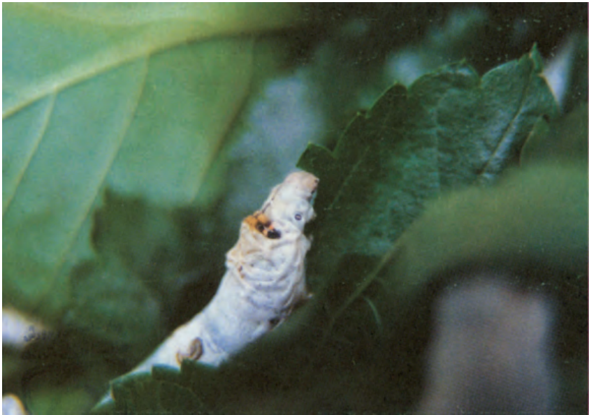
شکل ۲-۱۳- نژاد ژاپنی کرم ابریشم