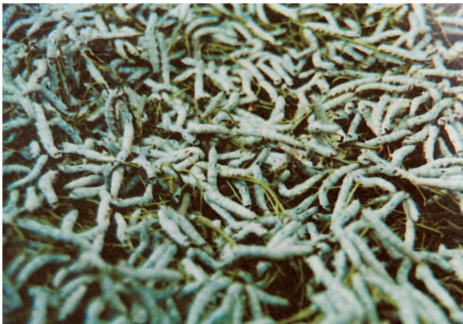
شکل ۳-۱۳- بستر پرورش کرم ابریشم