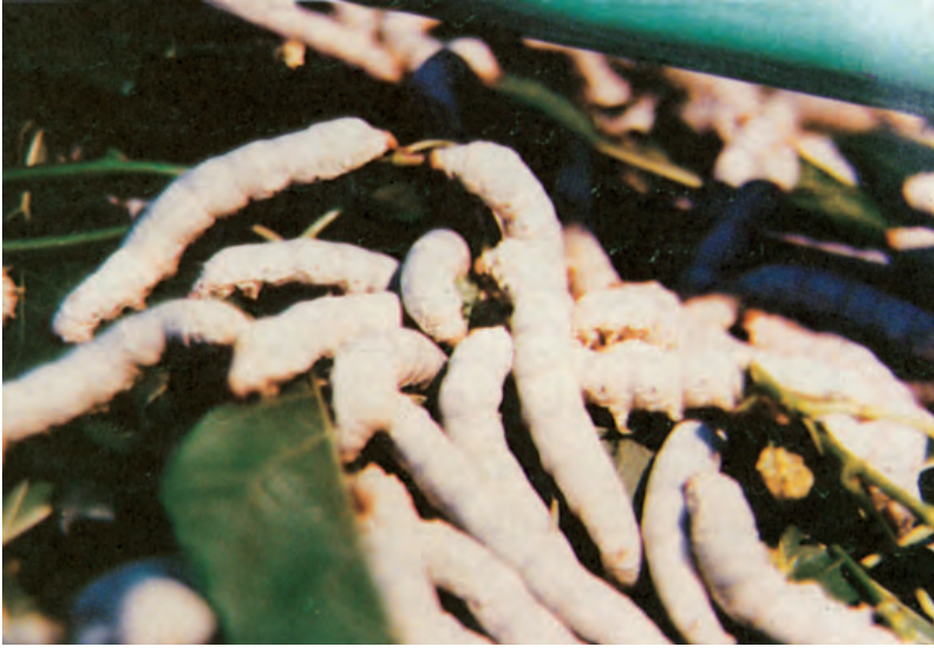
شکل ۱-۱۳- نژاد چینی کرم ابریشم