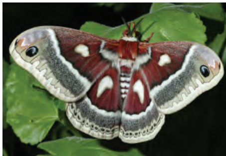
شکل ۷-۱۳- پيله و کرم و پروانه ابريشم