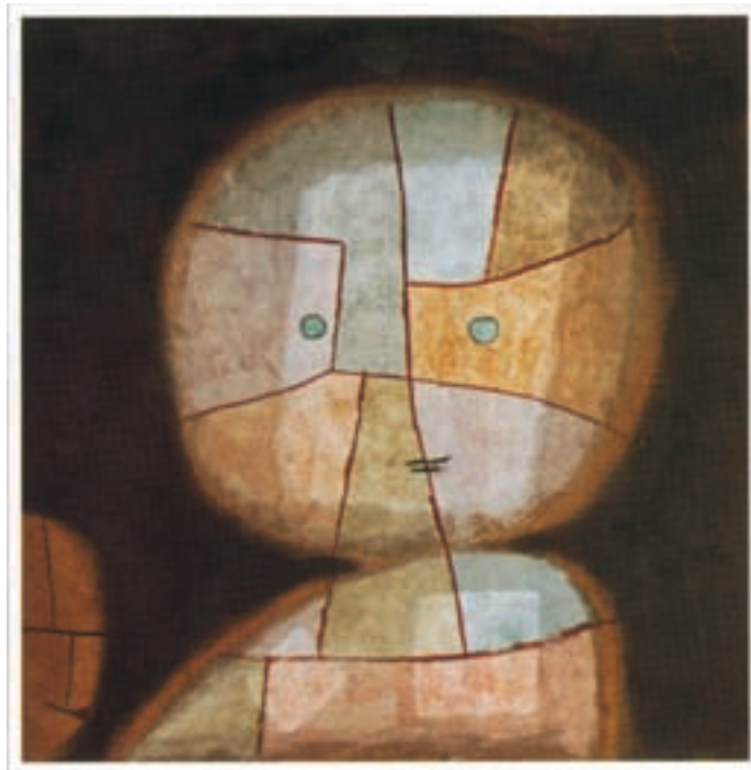
شکل ۱-۳- موانع خلاقیت

همان‌طور که در مورد عوامل مؤثر بر خلاقیت گفتیم موانع نیز می‌توانند درونی یا بیرونی باشند (شکل ۱-۳).