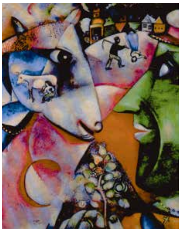
شکل ۹-۵- مارک شاکال - من و دهکده ام، ۱۹۱۱م. رنگ روغنی روی بوم (۱۵۱/۴ × ۱۹۲/۱ سانتی متر)؛ نمایش همزمان مکان‌های مختلف و اتفاقاتی که به طور موازی رخ می‌دهد فضایی گسترده‌تر از فضای واقع‌نما ایجاد می‌کند.

ج) فضای همزمان (تلفیقی): در برخی از آثار نمایش فضای تجسمی به صورت تلفیقی از فضا سازی واقع‌نما و دو بُعد نما صورت می‌گیرد. در این روش هنرمند بدون رعایت قواعد واقع‌نمایی در کل اثر، ساختار ترکیب خود را از مکان‌های مختلف به صورت موازی و به‌طور همزمان شکل می‌دهد. در عین حال سعی می‌کند با نمایش همزمان رویدادها در مکان‌های مختلف تلفیقی از فضا های داخلی و بیرونی به وجود آورد. به این ترتیب فضای تجسمی گسترش می‌یابد. در آثار نقاشی قدیم ایران این نحو از نمایش فضا به ایجاد یک فضای تجسمی گسترده برای روایت‌گری موضوعات داستانی کمک می‌کند. در هنر مدرن نیز نقاشان کوبیست کوشیدند با به نمایش گذاشتن اشیاء و مکان‌ها از چند زاویه دید مختلف زمان را در آثار خود به نمایش بگذارند. اما آن‌ها به این نگرش و شکستن شکل‌های واقع‌نما برای گریز از واقع‌نمایی، موضوع و روایت‌گری را تا حد زیادی در آثار نقاشان از میان بردند (شکل‌های ۹-۵ تا ۱۱-۵).