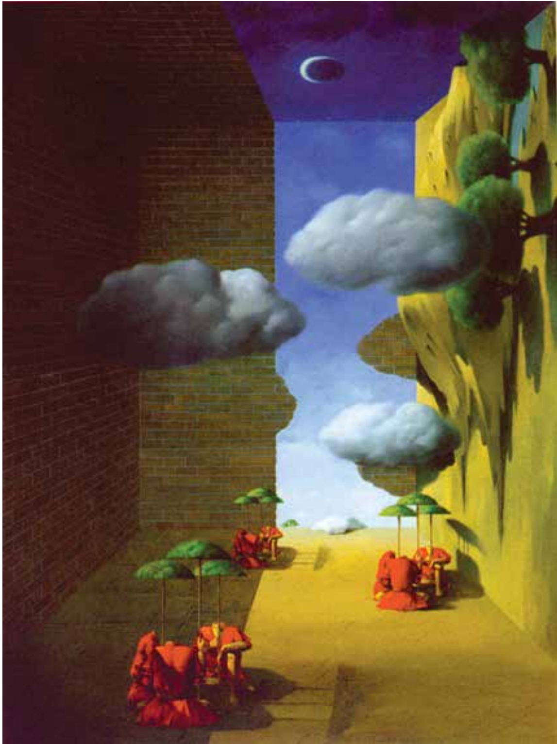
شکل ۱۵-۵- صادقی، علی اکبر؛ مأخذ: کتاب نمایشگاه، نگاه معنوی، ایجاد فضای وهمی در اثر تلفیق فضاها و عناصر نامأنوس با یکدیگر