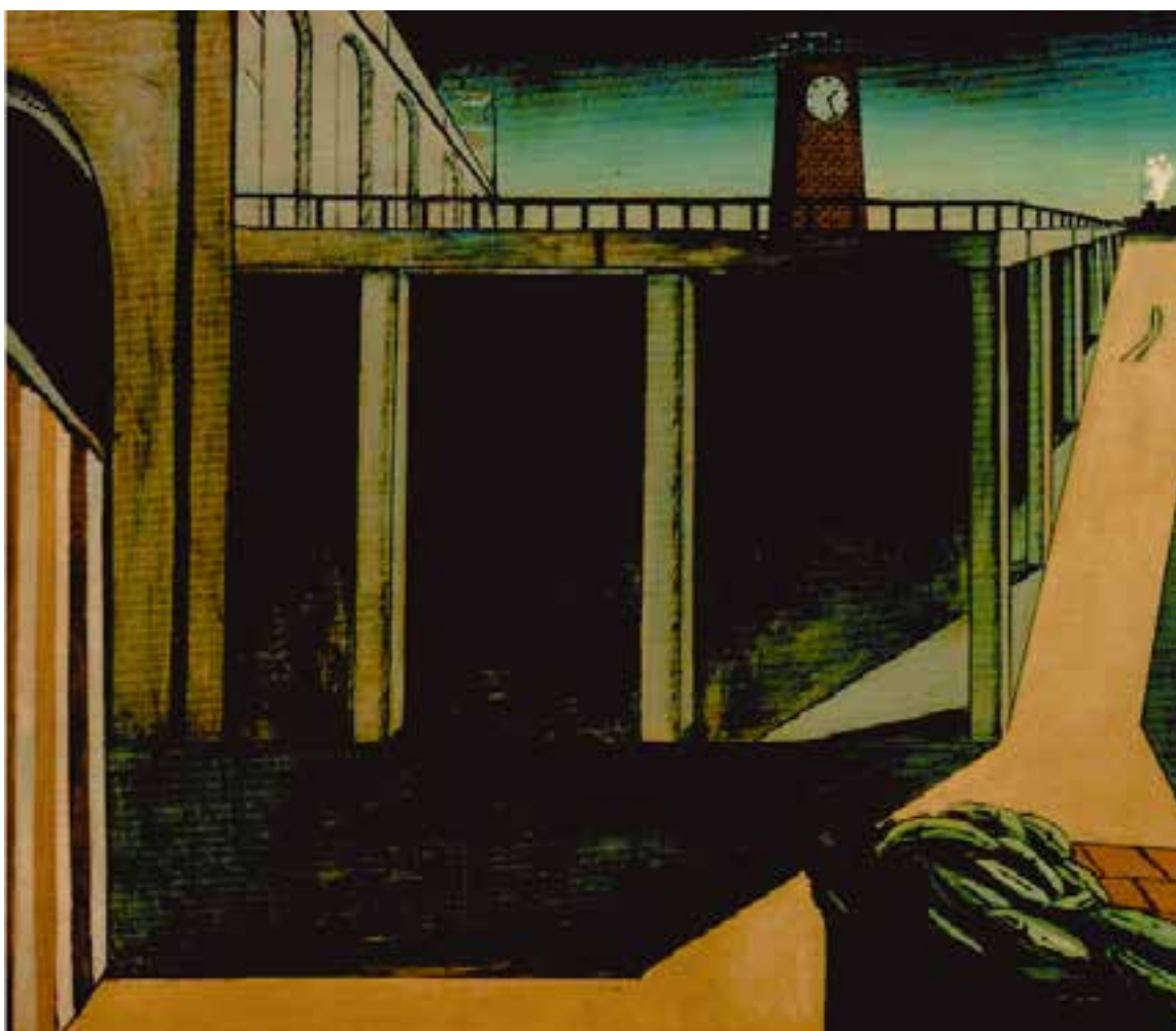
شکل ۱۲-۵- جورجو دکریکو، ایستگاه راه‌آهن مون پاراناس، ۱۹۱۴م. رنگ روغنی روی بوم، (۱۸۴/۵ × ۱۴۰ سانتی‌متر)؛ ایجاد فضای وهمی با استفاده از تمهیدات بصری مثل اغراق در نمایش عمق فضای بصری و نشان دادن ارتباط‌های نامأنوس میان اشیا در آثار دکریکو دیده می‌شود.

بسیار دیده می‌شود. نمایش این فضاها که جنبه‌ای خیالی و ذهنی دارد اگرچه توسط قوه‌ی خیال قابل تجسم است، اما در واقعیت و به‌طور طبیعی نمی‌تواند اتفاق بیفتد یا وجود داشته باشد. مثل ساعت‌هایی که ذوب شده و لخت هستند یا قطاری که از یک مکان خیالی و ناشناخته می‌گذرد، یا شیر و موجود درنده‌ای که بر خلاف طبیعت خود هیچ وحشت و اضطرابی ایجاد نمی‌کند (شکل‌های ۱۲-۵ تا ۱۵-۵).