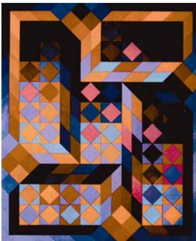
شکل ۸-۵- ویکتور وازارلی، ترکیب سه بُعدی. ترسیم شکل چهارگوش از زوایای مختلف در فضای بصری اثر ایجاد عمق کرده است.