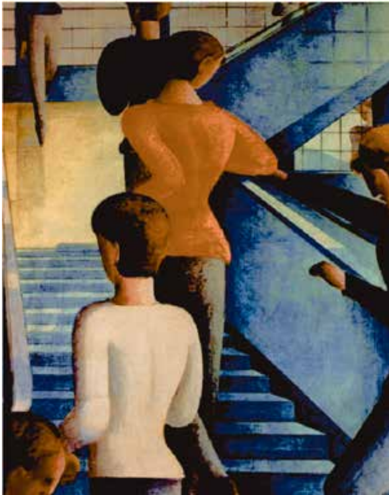
شکل ۱-۵- اُسکار شلمر، راه پله مدرسه باوهاوس، ۱۹۳۲ م.، رنگ روغنی روی بوم (۱۱۴/۳ × ۱۶۲/۳ سانتی متر)؛ نمایش فضای سه بُعدی روی سطح دو بُعدی از طریق تغییر اندازه