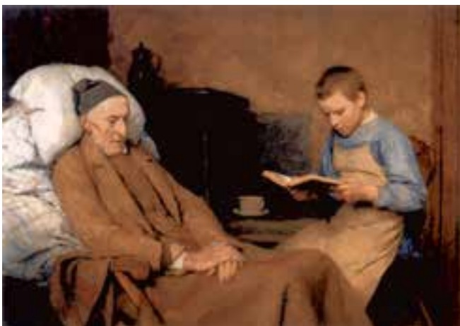
شکل ۲-۵- آلبرت آنکر، بیمار بیمار، ۱۸۹۳ م.، رنگ روغنی روی بوم، (۹۲ × ۶۳ سانتی متر)؛ ایجاد عمق فضایی با استفاده از تغییر درجه خلوص و تیرگی رنگ

۲- تغییر رنگ و تیرگی: در این روش برای نمایش دوری و نزدیکی اشکال و اشیا از تغییر رنگ آن‌ها در فاصله دور نسبت به رنگ همان اشیا در فاصله‌ی نزدیک و تغییر تیرگی - روشنی استفاده می‌شود. به این ترتیب که شدت و درجه‌ی خلوص رنگ در فاصله‌ی دور کاهش یافته و به خاکستری می‌گراید. به همین نسبت شدت تیرگی شکل‌ها و رنگ‌ها در فاصله‌های دور کاهش می‌یابد (شکل ۲-۵).