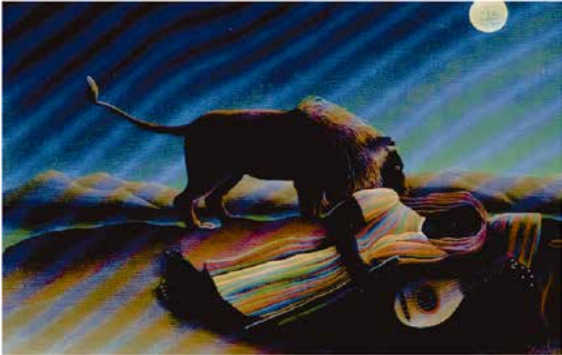
شکل ۱۳-۵- هانری روسو، کولی خفته، ۱۸۹۷م. رنگ روغنی روی بوم، (۲۰۰/۷ × ۱۲۹/۵ سانتی‌متر)؛ در آثار هانری روسو نیز عموماً فضای وهمی بر اساس روابط نامأنوس میان عناصر جهان واقعیت شکل می‌گیرد.