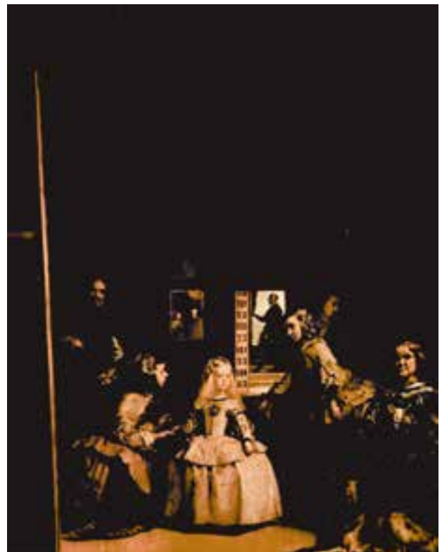
شکل ۳-۵- دیگو ولاسکز - ندیمه‌ها، ایجاد عمق فضایی با استفاده از تغییر وضوح