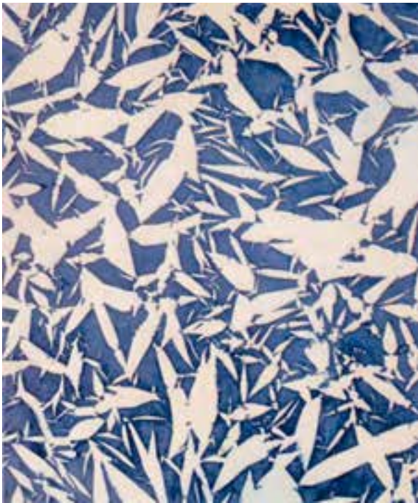
شکل ۴-۵- سیمون هانتایی، ترکیب؛ تغییر اندازه شکل‌های مشابه منجر به ایجاد عمق فضا در تصویر دو بُعدی شده است.

۳- تغییر وضوح: معمولاً هر چه اشیا از ما دورتر می‌شوند وضوح خود را بیشتر از دست می‌دهند و ما دیگر آن‌ها را به روشنی مشاهده نمی‌کنیم. در این صورت عمق فضایی با تغییر وضوح از اشکال واضح به اشکال ناواضح تعیین می‌شود (شکل ۳-۵).