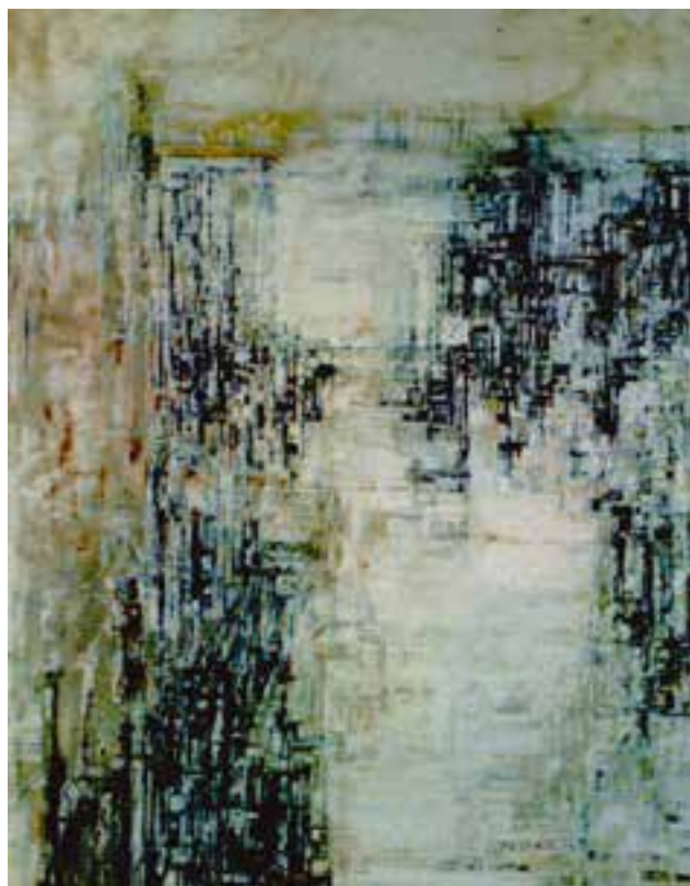
شکل ۷-۵- ماریا هلنا ویرا دوسیلوا، کارخانه برق، ۱۹۲۰م؛ تغییر وضوح و بافت شکل‌ها جهت ایجاد عمق فضایی