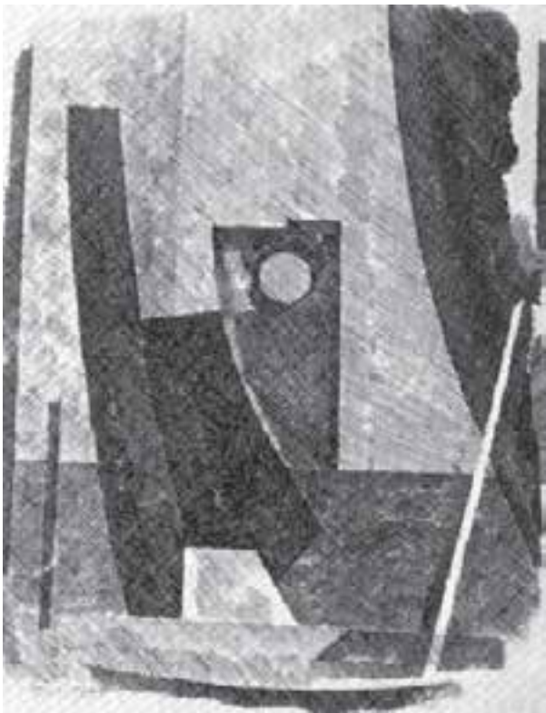
شکل ۵-۵- جیرانی کرمپای، محل ساختمان کشتی ۱۹۵۸ م.: تغییر تیرگی برای ایجاد عمق فضایی در سطح